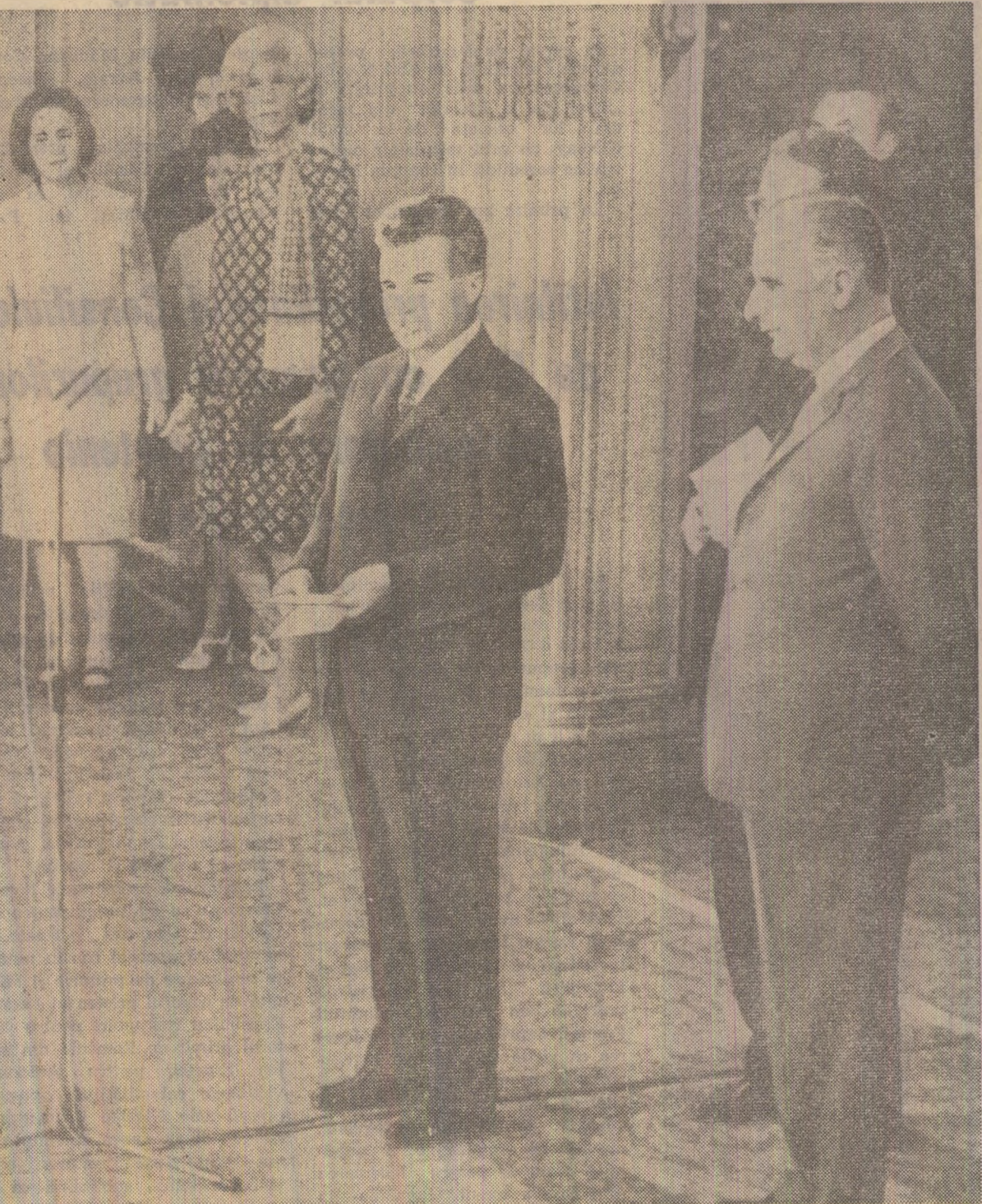
Cuvînt de solut, la palatul Elysée

Opinia publică franceză a luat cunoștință în aceste zile, prin intermediul presei, care a publicat interviuri cu președintele Ceaușescu, despre simpatia cu care poporul român urmărește munca și realizările remarcabile ale poporului francez, despre bunele raporturi existente între cele două țări și perspectivele unei colaborări și mai fructuoase în viitor. ...Ora 14.30. Orly — prima poartă aeriană a Franței. Traficul aerian al acestui imens aeroport internațional, unde la fiecare două minute aterizează o aeronavă, a încetat în momentul apariției pe cerul Parisului a avionului prezidențial românesc, escortat de la granița Franței, de reactoare ale forțelor militare franceze. În întâmpinarea înaltului oaspete se află președintele Consiliului de Miniștri al Franței, Jacques Chaban-Delmas, ministrul afacerilor externe, Maurice Schumann, cu soția,