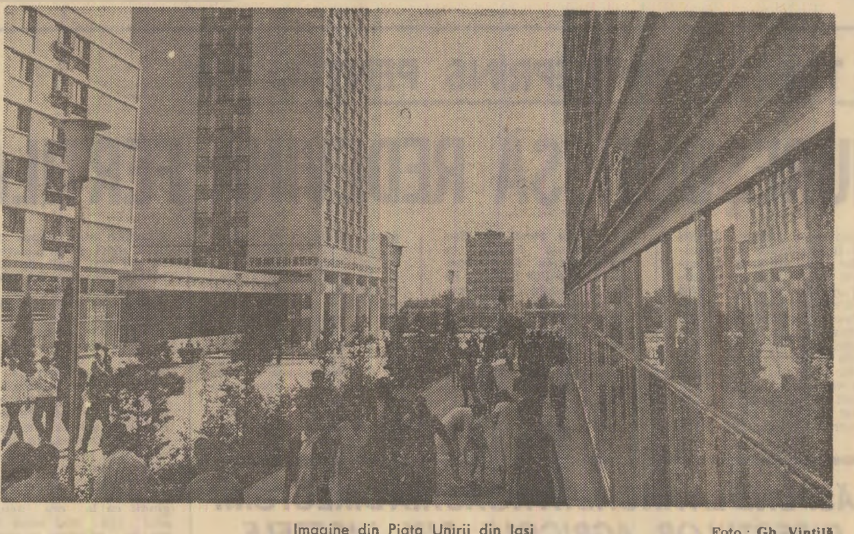
Imagine din Piața Unirii din Iași