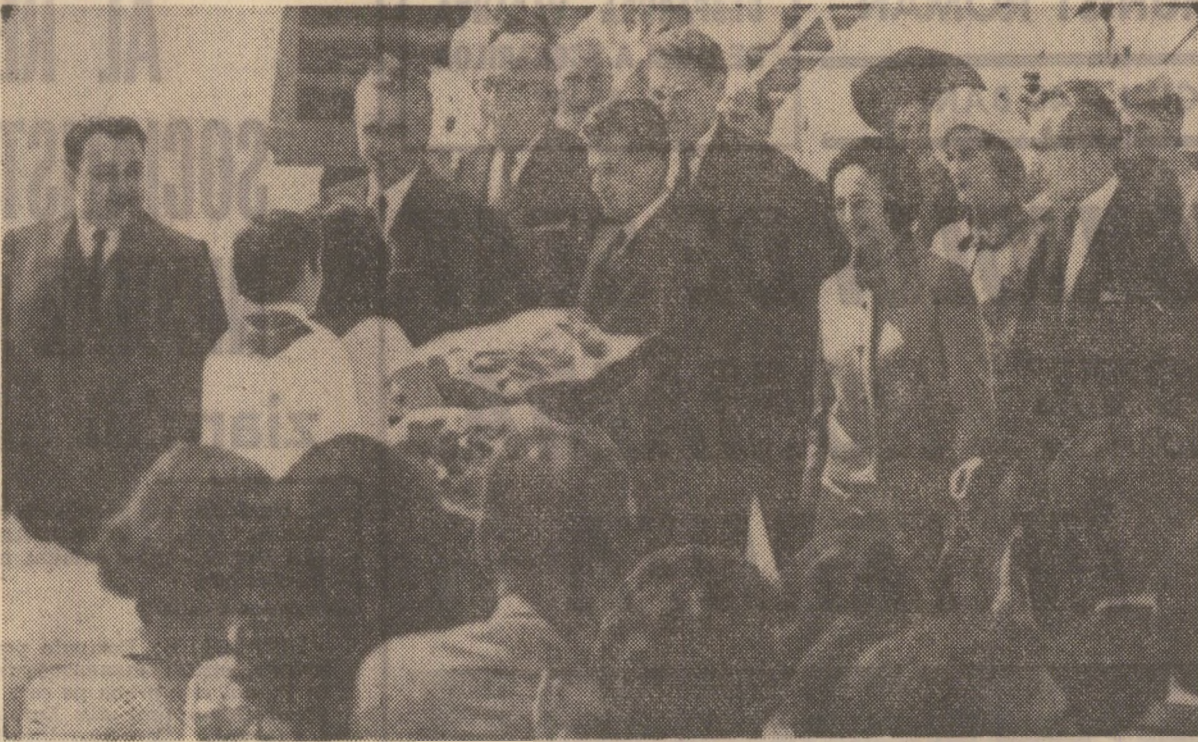
La sosire pe aeroportul Orly. În întâmpinare, primul ministru Chaban Delmas

Cadrul, amblanța generală, poartă amprenta zilelor de mare sărbătoare. Portalul aurit al impunătorului Dom al Invalizilor și domul însuși sînt, ca de altfel toate