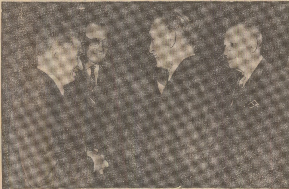
Primirea şefilor misiunilor diplomatice acreditaţi la Paris