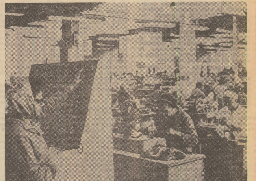
La fabrica de încălziminte „Ardeleana” din ALBA IULIA pulsează din nou activitatea productivă

Nicolae BRUIAN, corespondentul „Scintei”