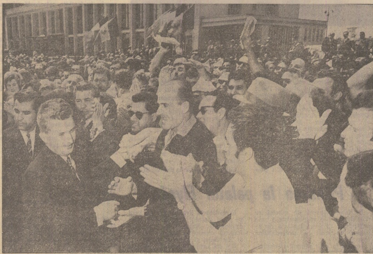
La plecare, pe aeroportul Băneasa