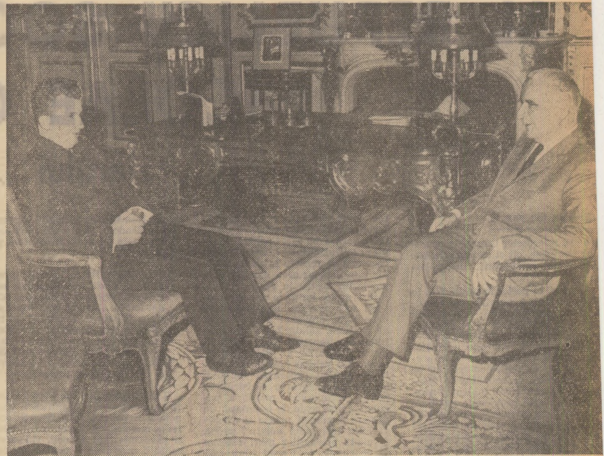
Intrevedere la palatul Elysee

Vă rog să-mi permiteţi să toastez pentru succesul acestui politic pentru prietenia între România şi Franţa, pentru pace în Europa şi în lume, în sănătatea dv., domnule preşedinte, a doamnei Pompidou, a domnului prim-ministru, în sănătatea dumneavoastră, a tuturor!