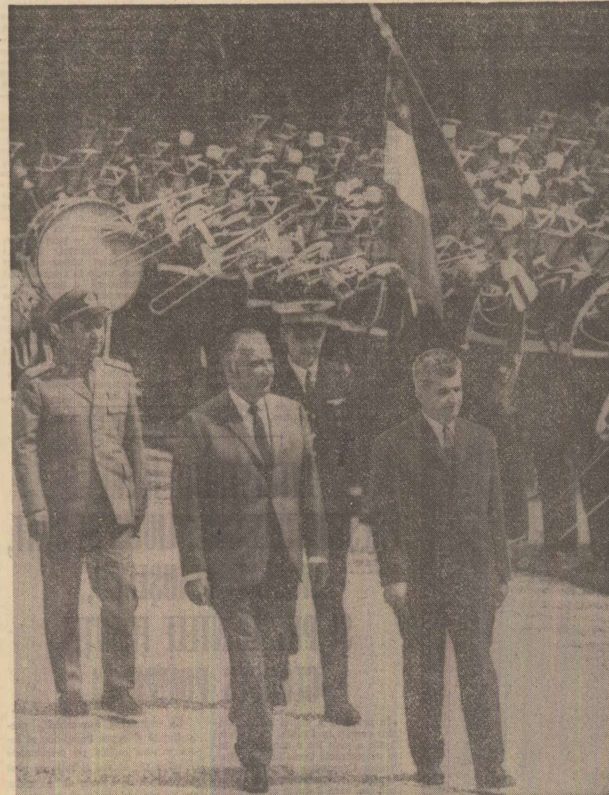
Se trece în revistă garda de onoare

Aici, în prezența primului-ministru, Jacques Chaban-Delmas, a președintelui Senatului, Alain Poher, a președintelui Adunării Naționale, Achille Peretti, a membrilor guvernului, Consiliului Constituțional, Consiliului de Stat și Consiliului Economic-Social, cei doi șefi de state au rostit alocuțiuni.