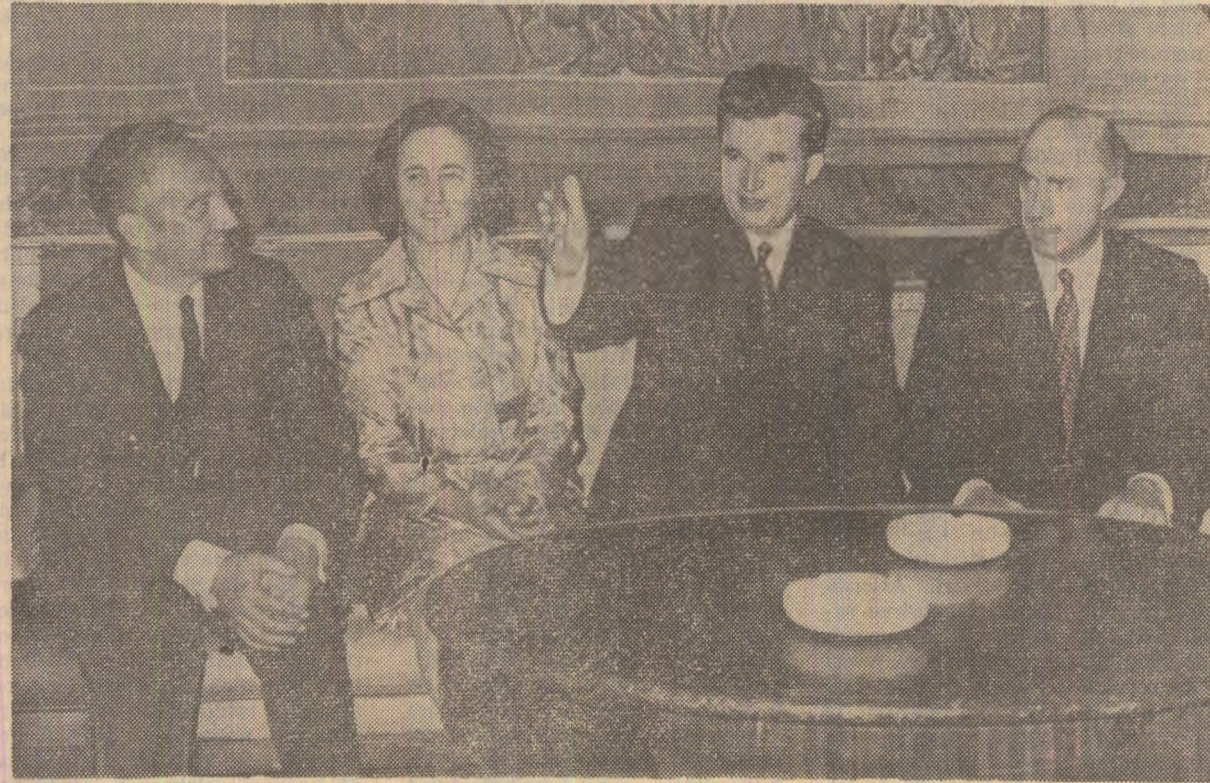
Întîlnire cordială cu parlamentari din grupurile de prietenie Franţa — România