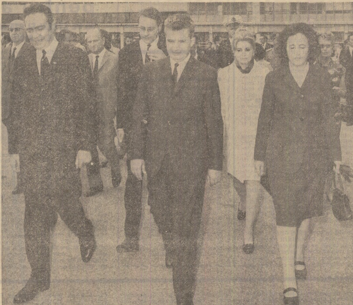
Pe aeroportul Lyon-Bron, înaintea plecării oaspetilor

Președintele Consiliului de Stat al Republicii Socialiste România, Nicolae Ceaușescu, și soția sa, Elena Ceaușescu, au invitat pe președintele Republicii Franceze, Georges Pompidou, și doamna Claude Pompidou să facă o vizită oficială în Republica Socialistă România. Invitația a fost acceptată cu plăcere, data urmînd a fi stabilită ulterior, pe cale diplomatică.