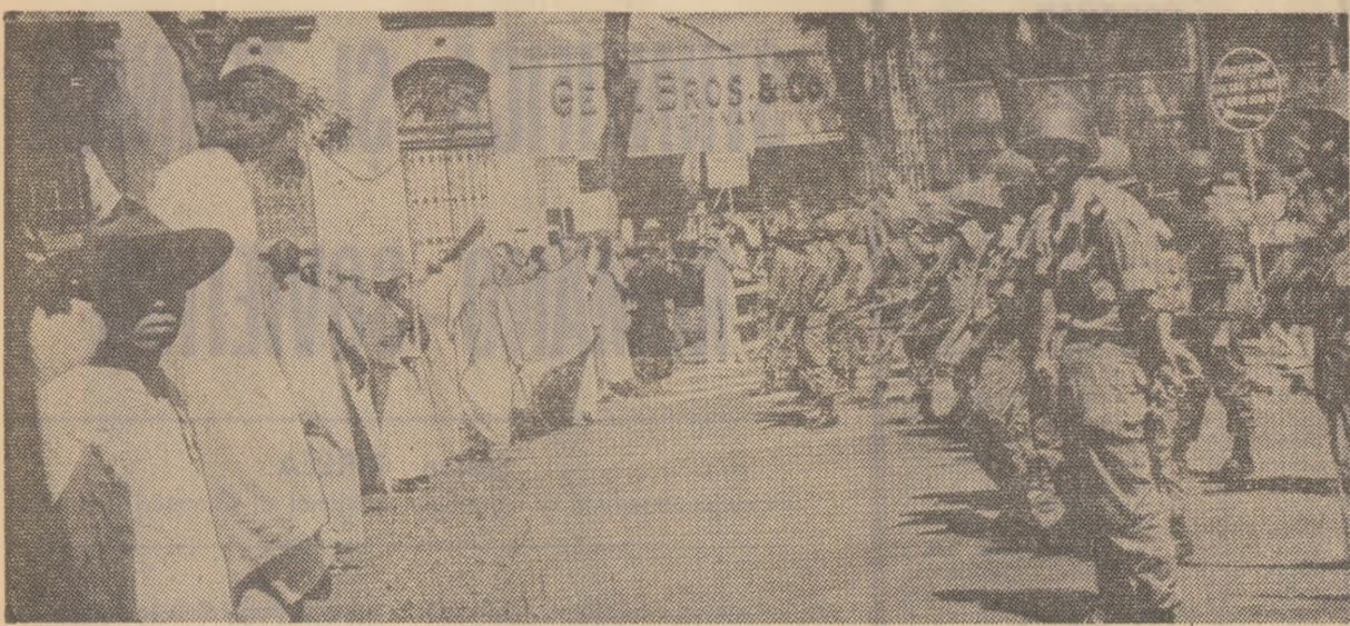
VIETNAMUL DE SUD. Poliția sud-vietnameză reprimind o demonstrație budistă prin care se cere încetarea războiului