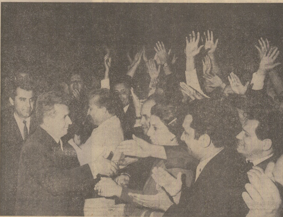
La sosire, pe aeroportul Băneasa