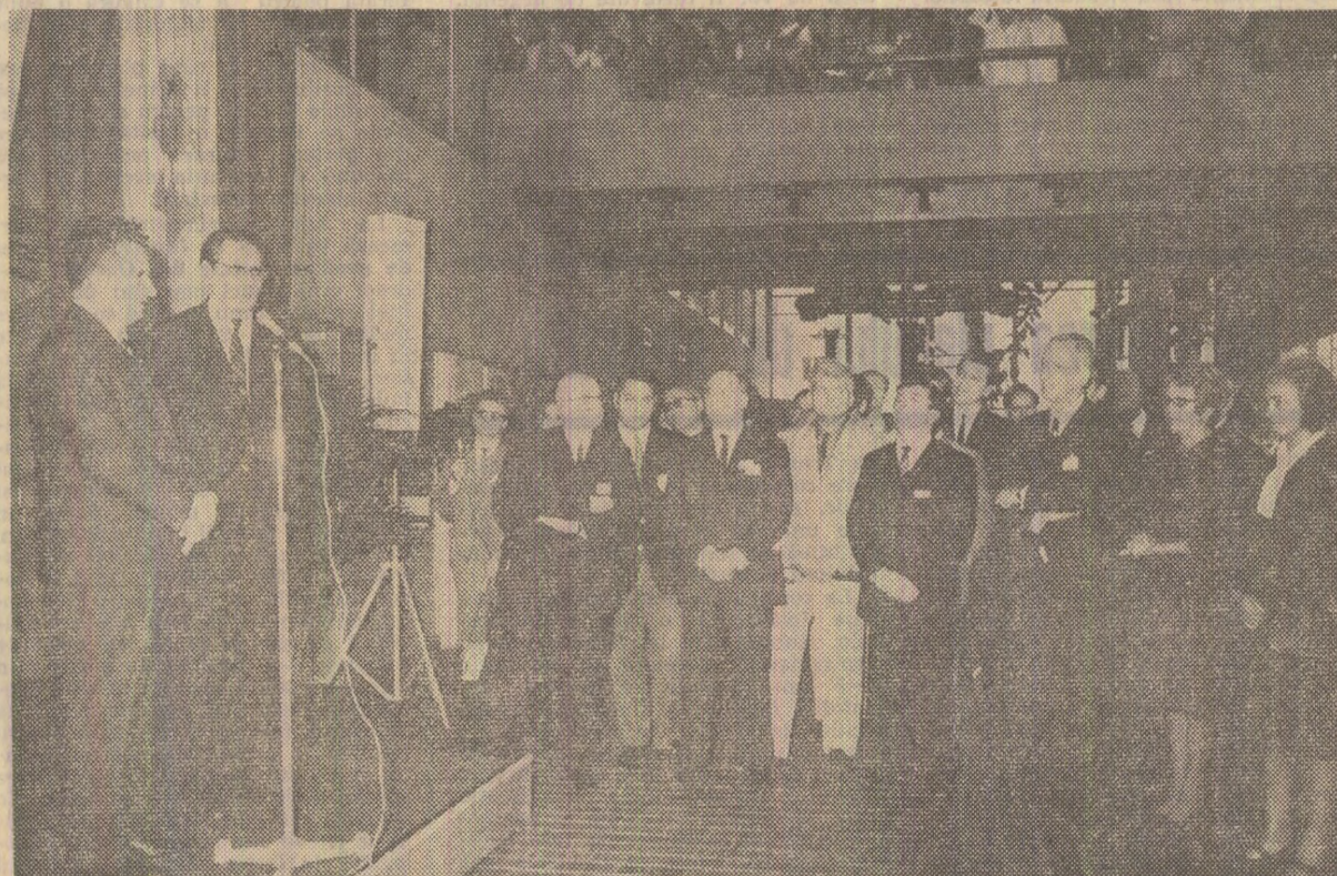
La „Delle-Alshom” — în timpul cuvîntării rostite de șeful statului român