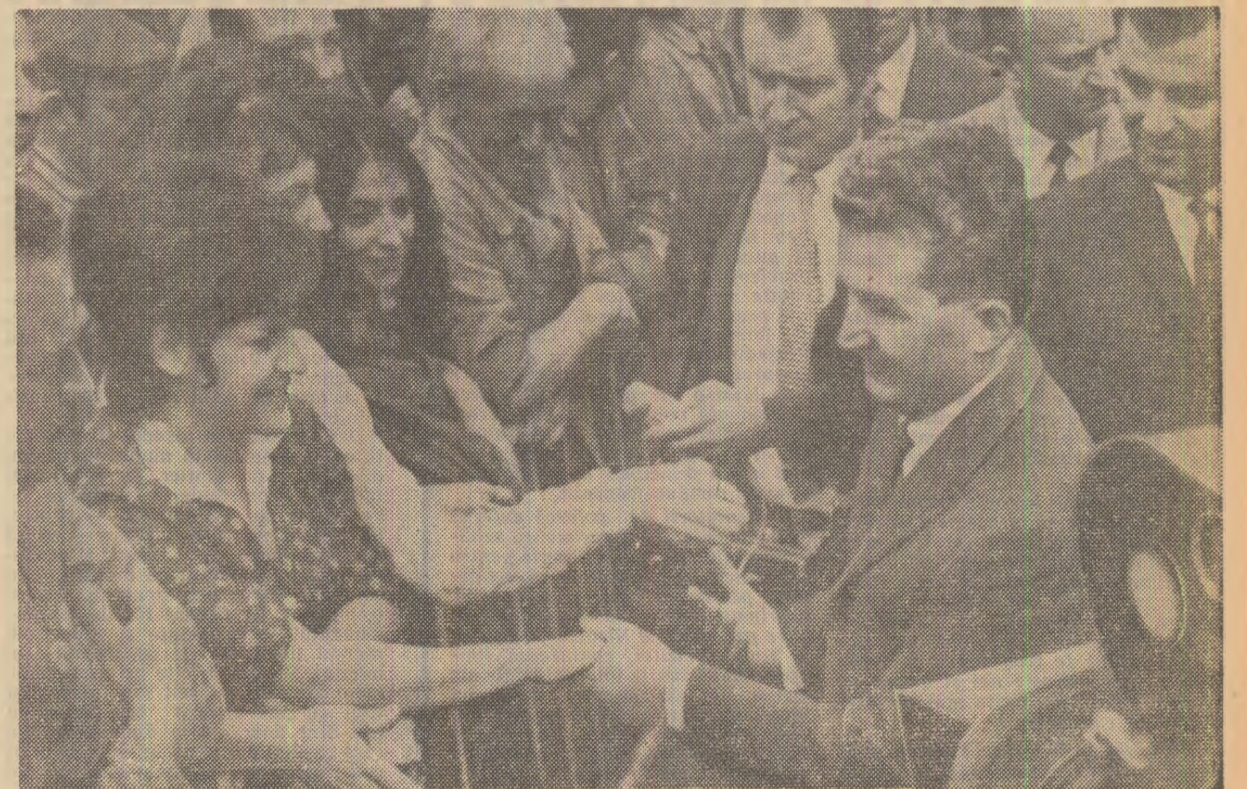
Preturidendi, aceiași manifestări de stîmă și caldă simpatie