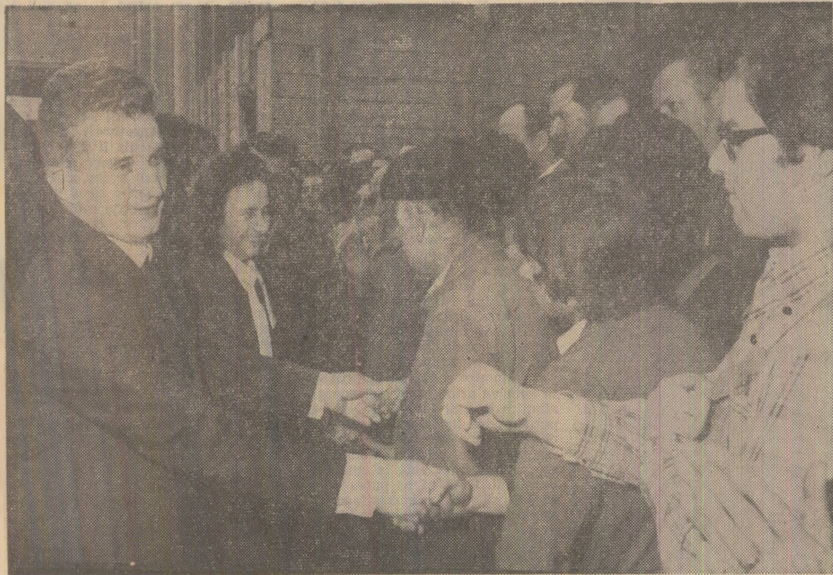
Lyon: Sute de stringeri de mîndă prietenești de-a lungul unui culoar viu