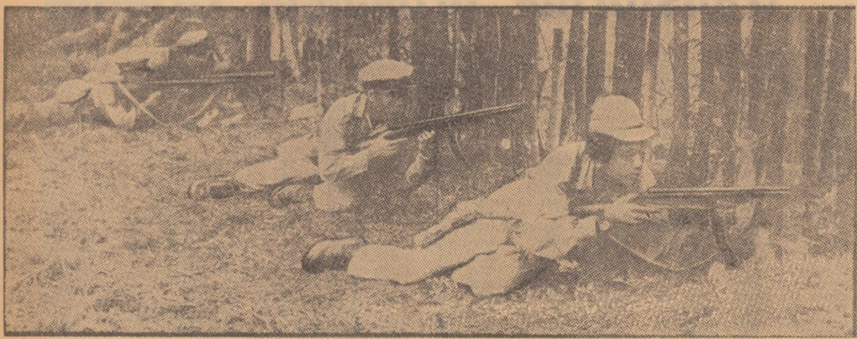
LAOS. Luptători din rîndul forțelor patriotice Pathet Lao în timpul unei acțiuni militare