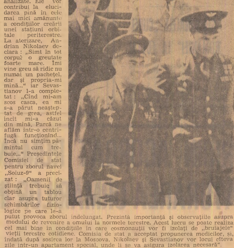
În fotografie: echipajul navei cosmice „Soiuz-9” în momentul sosirii la Moscova. Andrian Nikolaev și Vitali Sevastianov sînt însoții de cosmonauții Vladimir Șatalov și Alexei Eliseev.