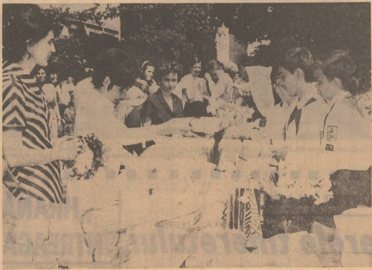
Cununi și premii pentru cei moi buni

Obiectivul fotografic nu se oprește programatic asupra unor secvențe spectaculoase; eroismul se află conținut în gesturile cele mai simple, în dimensiunea cotidiană a faptelor, acelor urme de fapt, luptă și eroism au devenit o condiție firească a existenței. Impresionanță în realizarea acestor fotografii economia mijloacelor folosite. Totul este surprins pe viu, viața însăși instituită în aceste imagini o realitate coplesitoare prin autenticitatea sa. Sunt imagini-document, izvorite din pulsul