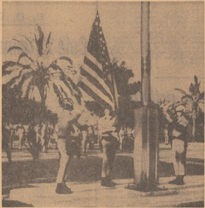
La baza Wheelus Field este coborât drapelul american și îndalț cel libian. Solemnitatea marchează încheierea evacuării trupelor străine din Libia.

MADRID 21 (Agerpres) — După cum anunță agenția Reuters, un grup de 65 cetățeni spanioli au adresat Ambasadei Statelor Unite din Madrid o petiție prin care cer lichidarea bazelor militare americane de pe teritoriul Spaniei. Printre semnatarii petiției se numără juriști, medici, ingineri și alți oameni de diferite profesii din Madrid și Asturia. Această acțiune atrage cu atât mai mult atenția cu cât ea are loc în momentul în care la Madrid se află ministrul apărării al S.U.A., Melvin Laird.