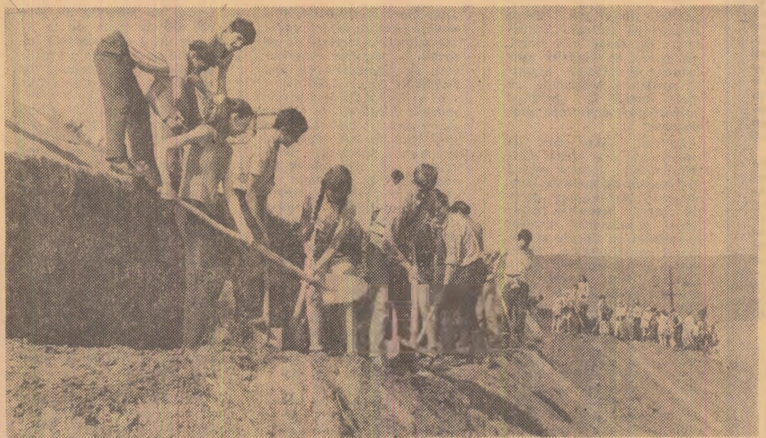
Elevii de licee din Sighișoara lucrînd la terasarea terenului afectat de inundații.

În urma unor acțiuni complexe, vînzînd mai buna organizare a producției și a muncii, cele 10 unități ale industriei ușoare din județul Prahova și-au sporit capacitatea anuală de producție cu 18 la sută. Astfel, printr-o mai bună amplasare a utilajelor, la întreprinderea de pielărie „Poporul” din Ploiești s-a creat posibilitatea montării în plus a unor instalații de tăbăcit și vopsit. Studiu vînzînd folosirea chibuzului a spațiilor existente au fost realizate, de asemenea, la fabricile de țesături din Azuga, Păulești și Ploiești, „Sticla” Prahova și Fabrica de ciorapi din Cîmpina, al căror efect s-a concretizat în creșterea volumului producției realizate. Ca urmare, întreprinderile industriei ușoare din județul Prahova au înregistrat, de la începutul anului, peste planul la zi, un spor de producție cu 4,7 la sută mai mare decît cel prevăzut, urmind ca pînă la sfîrșitul acestui an beneficiile suplimentare să depășească suma de 12.000.000 lei. (Agerpres)