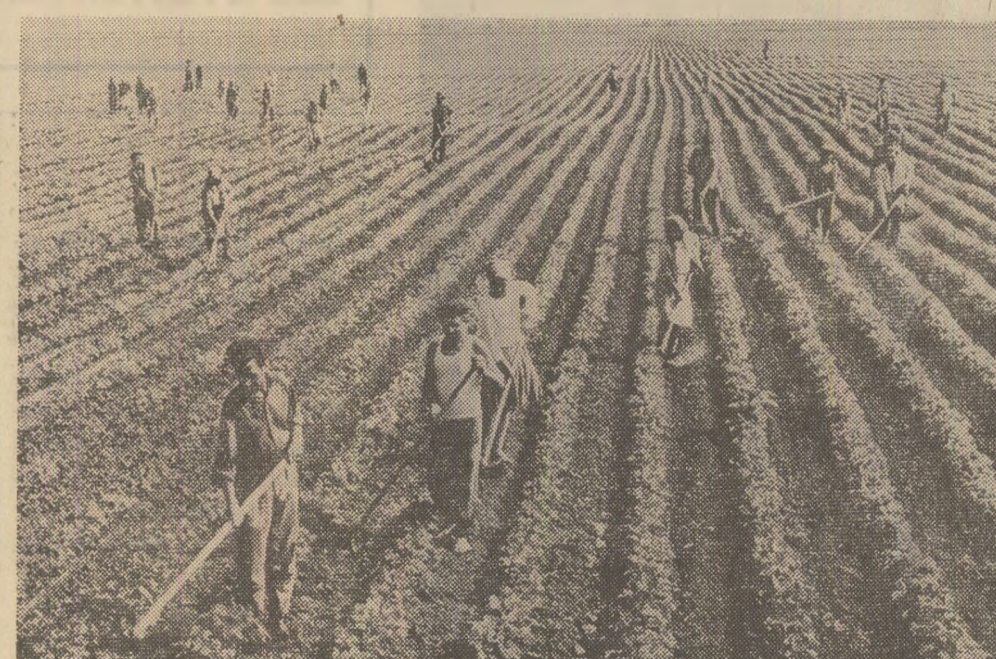
Întreținerea culturilor la I.A.S. Ograda, județul Ialomița