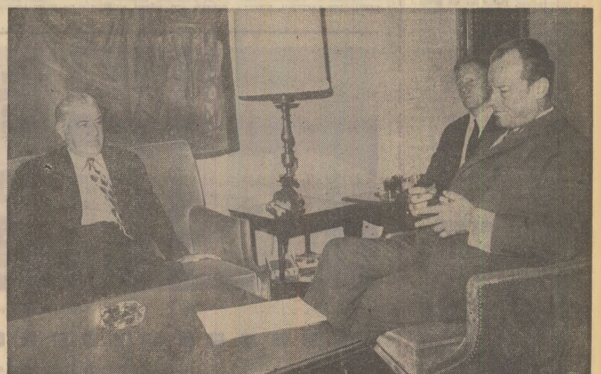
În timpul convorbirilor