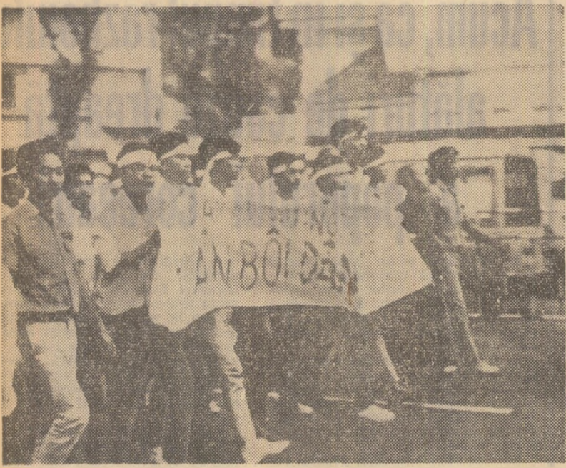
Vietnamul de sud. La Saigon a avut loc o puternică demonstrație împotriva continuării războiului