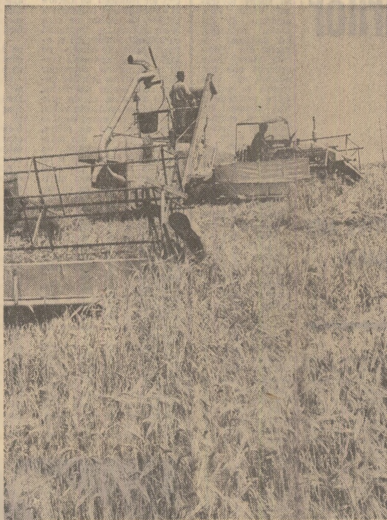
Primele suprafețe cu orz au început să fie recoltate la cooperativa agricolă din Zimnicea, județul Teleorman.