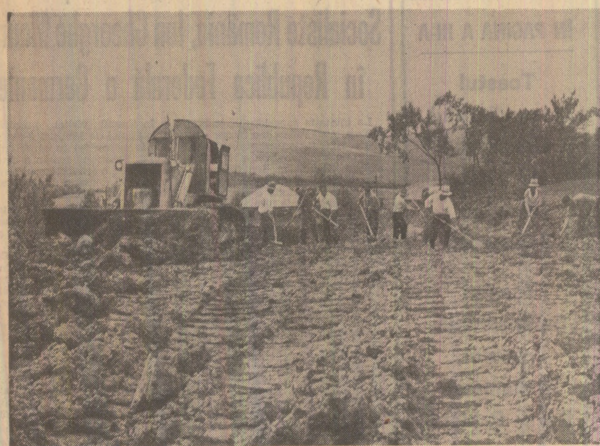
O stradă fără nume începe să-și scrie istoria