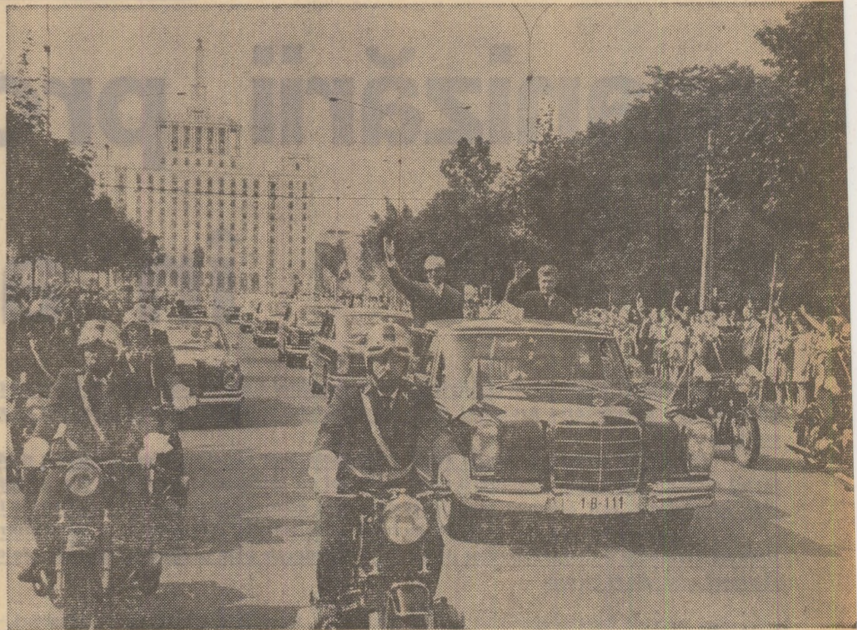
În aclamațiile călduroase ale mulțimii, venite în întîmpinare

Noi salutăm în persoana dv., domnule președinte al Consiliului de Stat, un om care s-a consacrat destinului țării sale, pentru viitorul fericit și prosperitatea României și poporului său. Propun de aceea distincțiilor oaspeți, tuturor celor care iau parte la acest dîneu, să ridice paharele în sănătatea domnului președinte al Consiliului de Stat și a doamnei Ceaușescu; — pentru prosperitatea și fericirea poporului român; — pentru prietenia și colaborarea dintre cele două popoare ale noastre; — pentru pacea mondială!