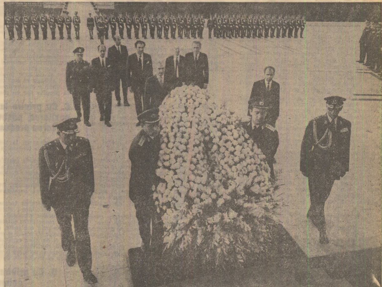
La Monumentul eroilor luptei pentru libertatea poporului și a patriei, pentru socialism