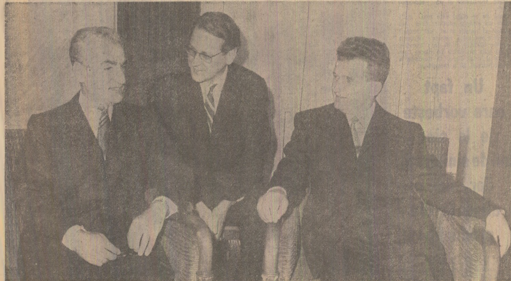
În timpul vizitei protocolare

Dineul s-a desfășurat într-o atmosferă de cordialitate. (Agerpres)