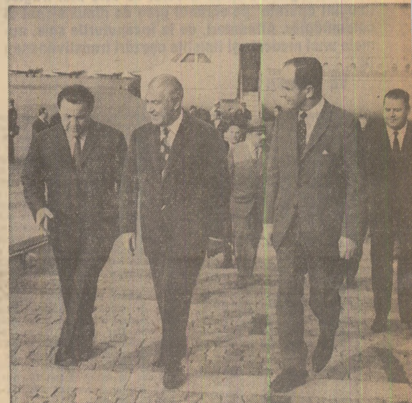
La sosire, pe aeroportul Băneasa