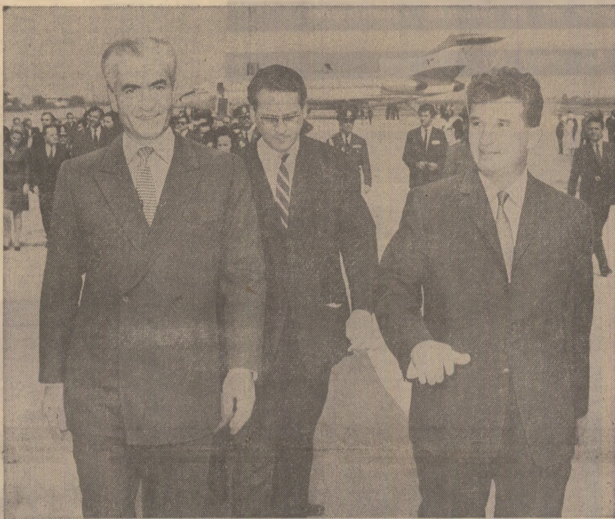
Pe aeroportul internațional București-Otopeni, la sosirea înălților oaspeți iranieni