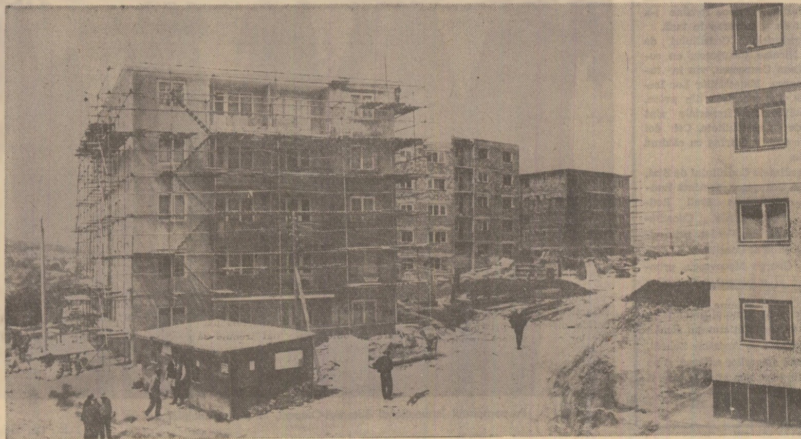
Pe Dealul Florilor, lumina fericirii zimbește din nou