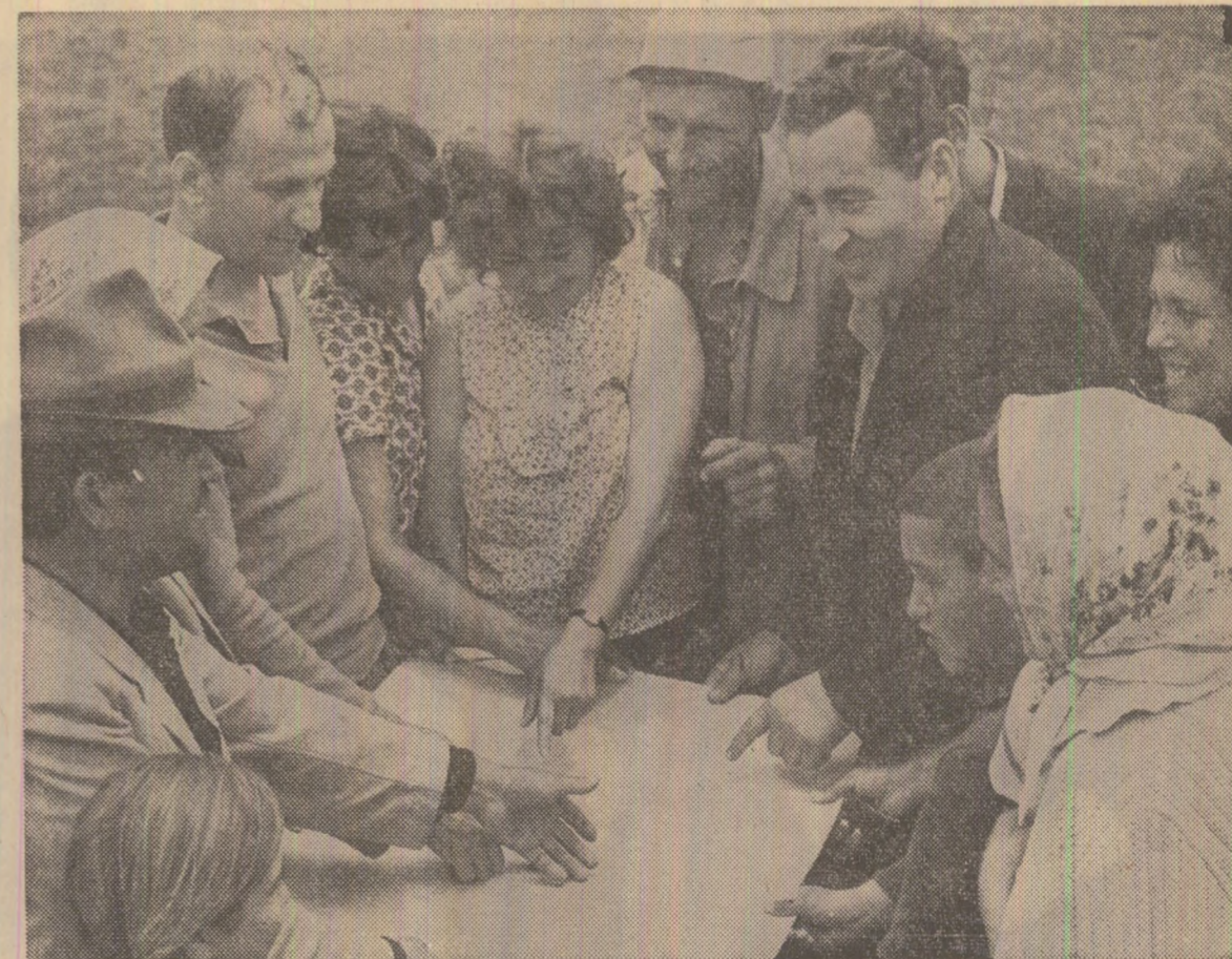
„Aici va fi casa noastră” — arată miinile acestor cetățeni

Victor VANTU Consolințin PRIESCU Viorel SALAGEAN Alexandru MUREȘAN