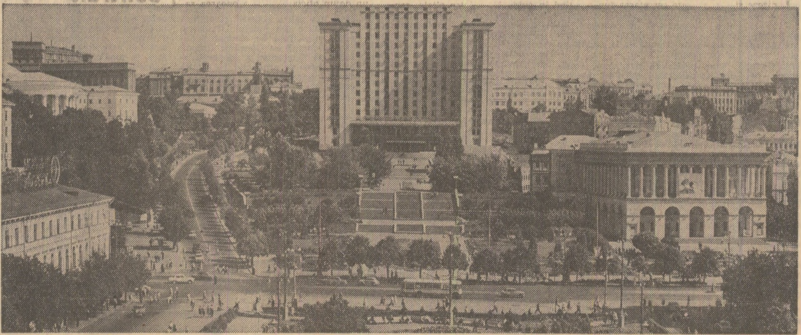
Kievul contemporan, oraș în plină dezvoltare, citadelă a științei sovietice