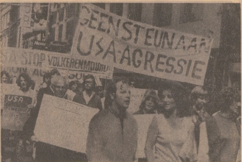
Demonstrație de protest la Haarlem (Olanda) împotriva războiului din Indochina

În primele șase luni ale acestui an, — se arată într-o declarație a Comisiei pentru cercetarea crimelor comise de americani în Vietnam — avioanele S.U.A. au efectuat 11 100 de zboruri de recunoaștere deasupra teritoriului R. D. Vietnam și a zonei demilitarizate, au bombardat și mitraliat 134 de localități situate între paralelele 17 și 20, lansând zeci de mii de bombe de diferite tipuri și peste o mie de rachete. Vietnam, Cambodgia, Laos... Pământuri măcinate de bombe, prifolite de flăcările agresivității imperialiste, nimicind munca și viața unor popoare care își apără dreptul de a trăi libere, punând în primejdie pacea și securitatea tuturor popoarelor lumii. Lată de ce ecoul fiecărei explozii pe pământul Indochinei răsună parcă, amplificat printr-o miraculoasă reverberație, pe toate continentele globului, contopindu-se în marea explozie a protestelor mișcărilor de oameni împotriva războiului.