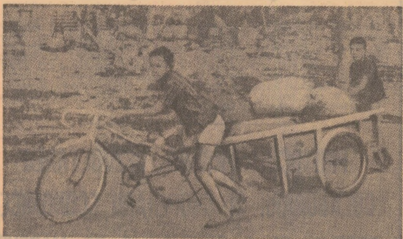
O imagine a dramei populației civile din Cambodgia. La Kompong Speu, doi tineri locuitori căutând adăpost, încearcă să salveze puținul ce le-a mai rămas din casa distrusă de bombe