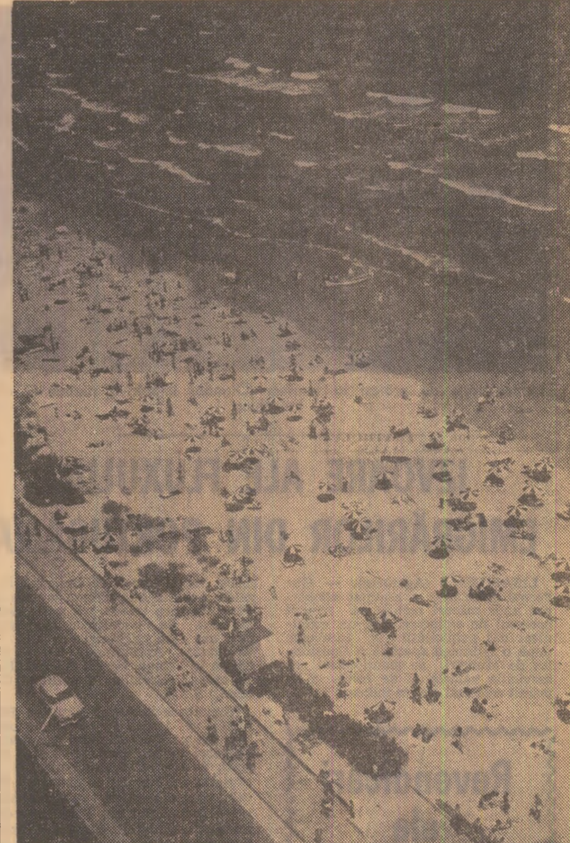
În aceste zile, pe plaja de la Mamaia

Protocolul a fost semnat din partea română de Janos Fazekas, vicepreședinte al Consiliului de Miniștri, președintele părții române în Comisia guvernamentală româno-polonă de colaborare economică, iar din partea polonă de Eugeniusz Szyr, vicepreședinte al Consiliului de Miniștri, președintele părții polone în această comisie.