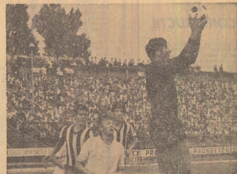
Un singur atacant dinamovist și trei apărători guleșteni, o imagine care exprimă maniera de joc a celor două echipe

Este prima oară când oștile publice li sînt înfățișate oștile de aprecieri extremiste (acum laudative, altă dată ultranegativiste), care n-au în nici un caz larul să ne conducă pe drumul progresului. Pe această linie se înscriu, după părerea noastră, unele opinii transmise de la fața locului, în deosebi cele de la televiziune, ca și acelea care au apărut, în unele întreprinderi și declarații publicate în timpul desfășurării competiției și după reîntoarcerea acasă. Exprimînd rezerve la bilanțul general al comportării în Mexic nu înseamnă a turna o linguriță de păcură într-o puțină cu smințină, ci a