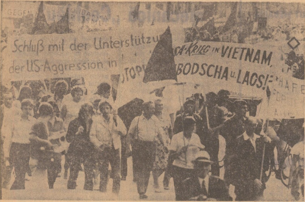
R.F.G. — Peste 5000 de persoane au manifestat la Hamburg împotriva intervenției militare americane în Indochina