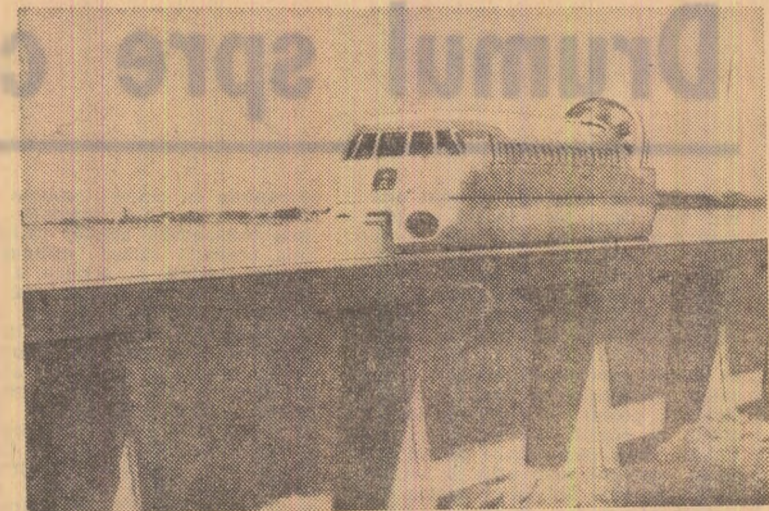
Zilele trecute, presa a fost invitată să asiste la o cursă de probă a „aerotreului” francez, în apropiere de Orléans. Aerotreul dezvoltă o viteză de 300 kilometri pe oră și poate transporta 80 de pasageri.

La Londra, un purtător de cuvînt al Ministerului Apărării a anunțat că alți 600 de militari britanici aflați în R. F. a Germaniei vor fi tranștrați în curînd în Irlanda de Nord. Cu aceasta, totalul militarilor englezi dislocați în Ulster se va ridica la peste 12 000.