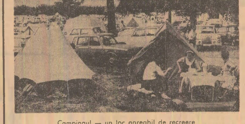
Campingul — un loc agreabil de recreere