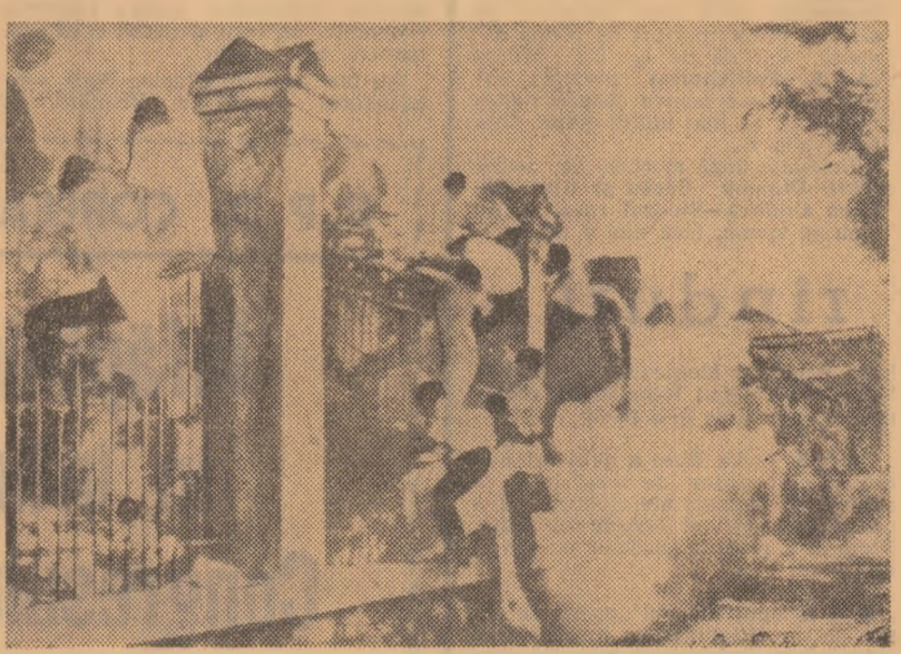
Vietnamul de sud: demonstrația a studenților la Saigon împotriva războiului și a poliției administrației Thieu-Ky, împresărită cu gaze lacrimogene de către poliția sud-vietnameză

Alexei Șitikov a fost ales președinte al Sovietului Uniunii, iar Iadgar Nasridinova — președinte al Sovietului Naționalităților. De asemenea, au fost alese comisiile permanente ale Sovietului Suprem. În cursul acestei sesiuni urmează, de asemenea, să fie ales Președintele Sovietului Suprem și să fie format guvernul U.R.S.S.