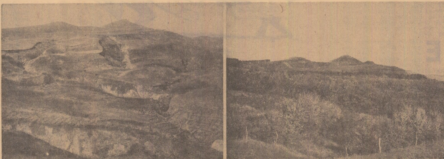
Terenuri degradate prin eroziune în bazinul Rimnicu-Sărat (Putreda) înainte de începerea lucrărilor de împădurire (sfînga) și același bogat (dreapta) după 18 ani de la executarea lucrărilor de împădurire și corectare a torențurilor

secretar general al Academiei de Științe Agricole și Silvice