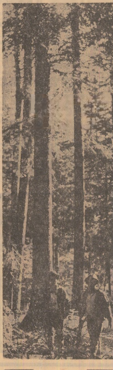
Incepe o nouă zi de muncă în parcelele forestiere

MG. MUREȘ (corespondenții „Scintei”). Pe lângă ospetii veniți pentru odihnă și tratament, într-un număr de peste 3000 în fiecare serie de vară, stațiunea balneo-climaterică Tușnad mai găzduiește zilnic sute de turiști din țară și străinătate. În vederea primirii lor bune s-au amenajat căsuțe și corturi, un camping cu locuri de parcare într-un loc pitoresc pe malul Oltului, dotat cu instalație de apă, canal, lumină electrică. Tot aici s-a pus la dispoziția turiștilor un buget, precum și locuri de pregătire a mincărurilor. Pe malul lacului Ciucaș se amenajează un microrestaurant cu terase, care va deservii atît pe cei veniți în camping cît și pe ceilalți turiști aflați în trecere prin această frumoasă stațiune. O unitate de alimentație publică recent deschisă și barul de zi stau, de asemenea, la dispoziția vizitatorilor. Ca mijloace de agrement se numără bărcile de pe lacul Ciucaș, strandul de pe acest lac și de la băile mezo-termale, precum și jocul mecanic.