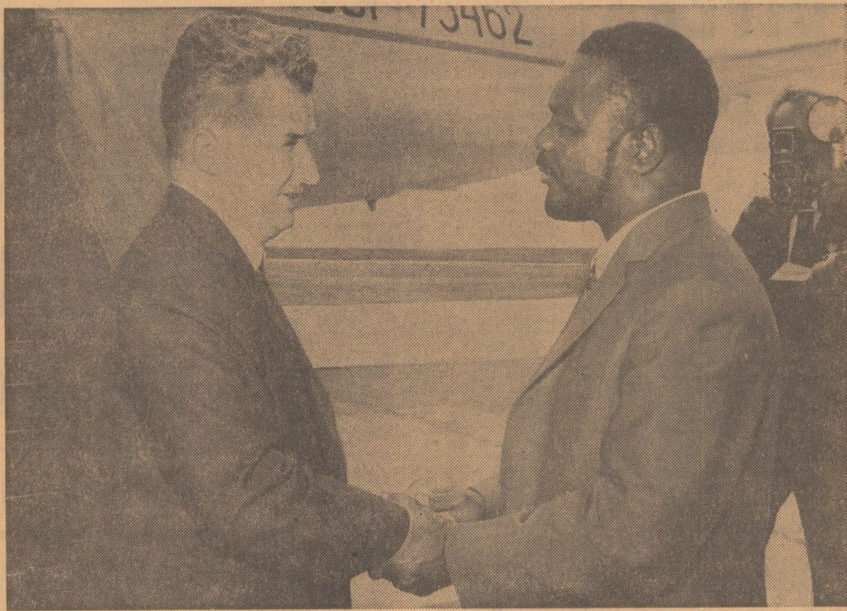
Un călduros rămas bun pe aeroportul internațional „București—Otopeni”