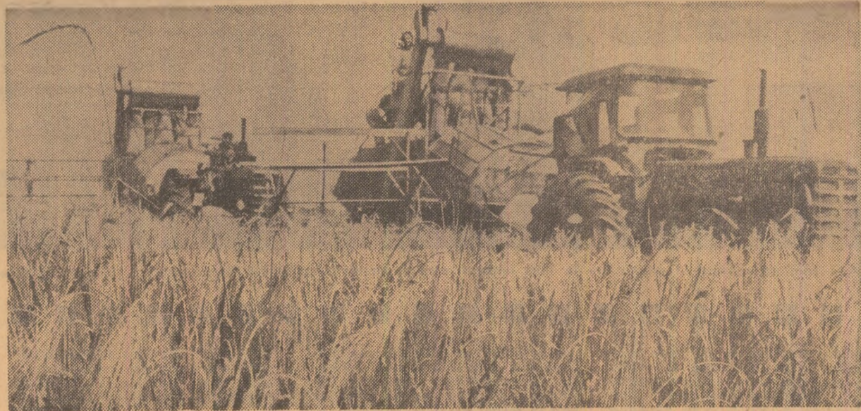
Combinele mînuite cu pricepere nu încetează nici o clipă înaintarea în lanuri

N-am întîlnit nici unul din cei 1.000 de oameni. Aie gantiere i-au chemat urgent. Miinle lor durează acum noi hale sau case, noi șosele sau poduri. Aici, însă, pe platforma chimiei brăilene, loc unde se realizează mai mult de o treime din producția industrială a județului, cei 1.000 de constructori și montori au edificat un nou obiectiv al anului 1970: Fabrica de celofibră — elapa a II-a — din cadrul Combinatului de fibre artificiale. La cele 35.000 tone de celofibră, cît produce anual combinatul, meșina adaugă contribuția proprie: 15.000 tone într-un an. Fie pentru mi și milioane de metri pătrați de teșături — cămăși, halne, pînă de mobilă, scutece pentru nou născuții etc. Fie cerute așteptate de țesăturile din Iași, București, Galați, Timișoara, Căsnăide. Așadar, constructorii și montorii au plecat. Au predat stafeta altora — mult mai statornici, oameni care nu cunosc elinele unice de migrație de la un san-