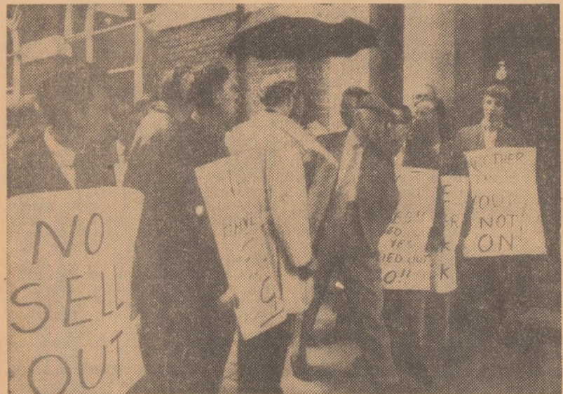
LONDRA. Docheri aflați în grevă demonstrînd în sprijinul revendicărilor lor economice

Corneliu Bogdan, a fost primit de către guvernatorul general al Canadei, Roland Michener, în legătură cu plecarea sa definitivă din această țară. Ambasadorul român a mai fost primit, de asemenea, de către ministrul afacerilor externe, Mitchell Sharp. Ministrul afacerilor externe canadian a oferit un dejun în cinstea ambasadorului român. La 15 iulie, ambasadorul României a oferit un cotelet de rîmăș bun la care au participat ministrul industriei și comerțului, Jean Luc-Pepin, funcționari superiori din Ministerul de Externe canadian, șefii ai unor misiuni diplomatice.