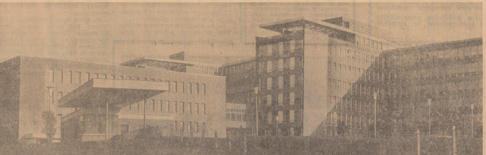
Printre numeroasele instituții sanitare apărute în ultimii ani în țara noastră este și modernul spital din Huneoara.

Constantin COTOȘPAN corespondentul „Scinteia”