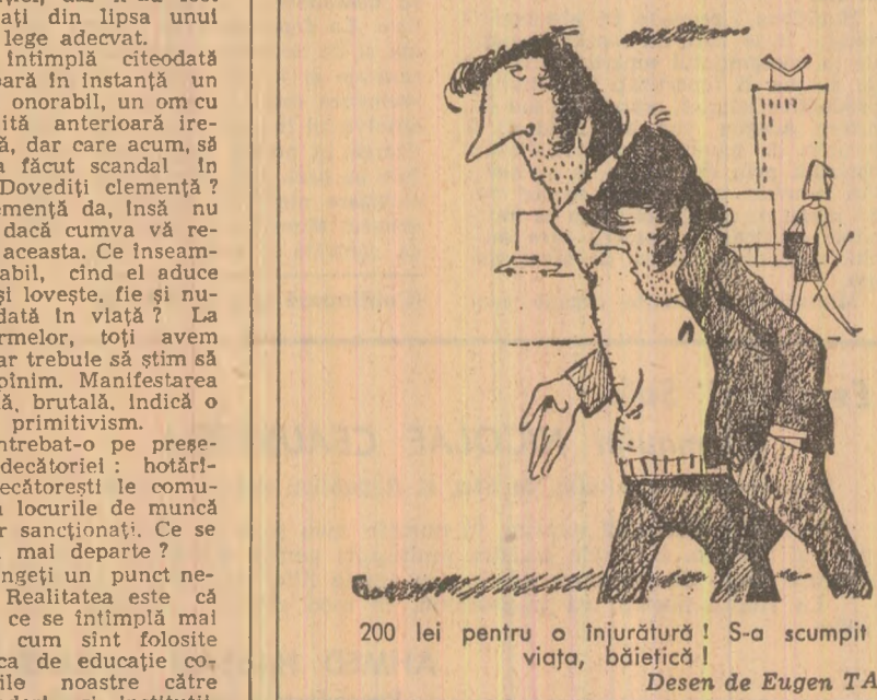
200 lei pentru o injurătură! S-a scumpit viața, băieții! Desen de Eugen TARU

Un fapt este cert: Decretul pentru stabilirea și sancționarea unor contravenții privind regulile de conviețuire socială, ordinea și liniștea publică, n-a fost conceput de legiuitor numai pentru pedepsirea și îndreptarea vinovaților de azi; sfera lui de acțiune este mult mai vastă, cu sensuri morale mult mai a-ndînc, întinzîndu-se în timp rolul preventiv educativ. Din aceasta derivă răspunderea, cit și îndatoririle noastre, individuale și sociale.