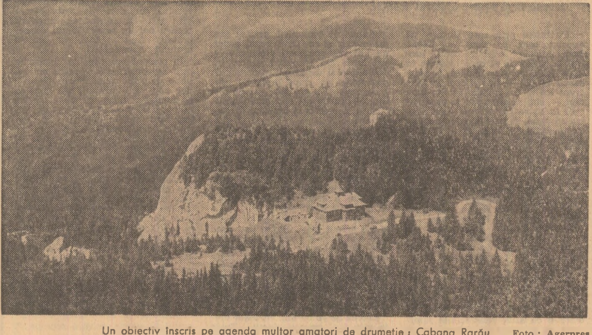
Un obiectiv înscris pe agenda multor amatori de drumeție: Cabana Rarău