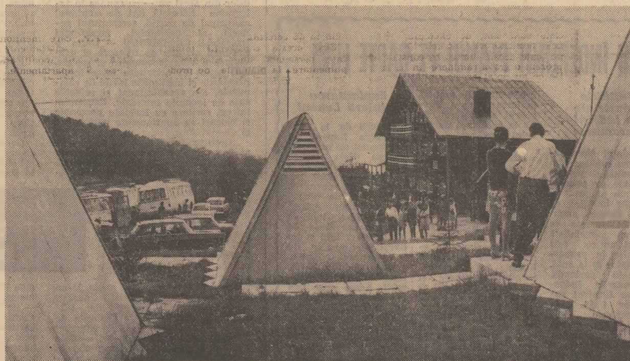
Cabana „Muntele Roșu” oferă turiștilor un reconfortant popos