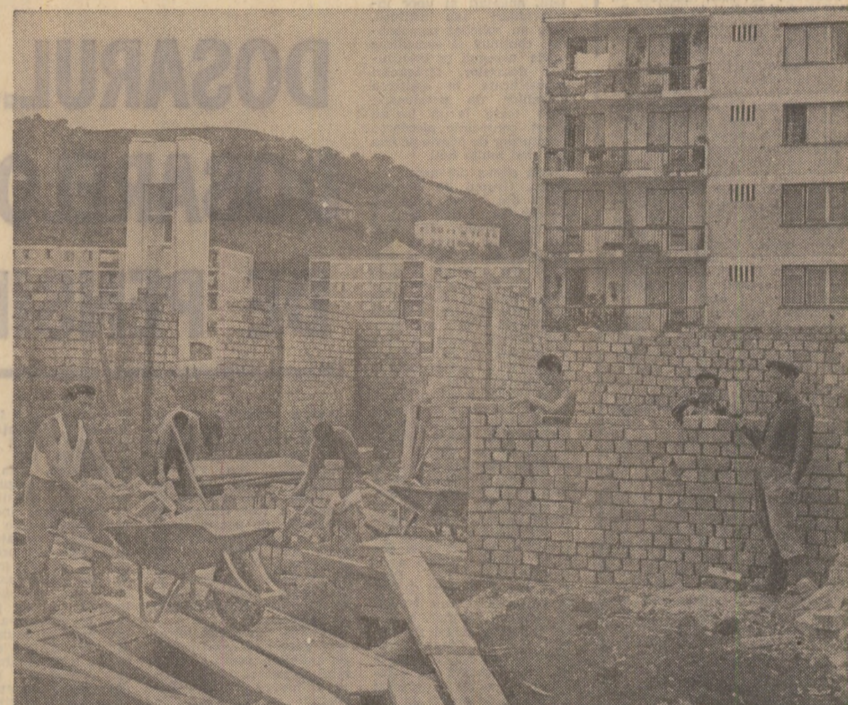
Medias — unul din orașele grav afectate de inundații. „Pulsul” orol de reconstrucție se simte și aici. Pe șantiierul celor „7 blocuri pentru sinistrați”, în care vor fi adăpostite peste 300 de familii, se lucrează după programul de „zi-lumină”. Multiplicativ imaginea scoțind fiecare din localitățile lovite de inundații și veți obține o probă concretă a eforturilor constructive!

● O vastă acțiune de reconstrucție ● Ajutoare de la stat de milioane și mari cantități de materiale de construcție pentru populația sinistrată ● Se prefigurează viitoarele cartiere: 360 de apartamente plus 220 de apartamente, plus... ● „N-aș fi crezut că va fi cu puțință să primim un asemenea ajutor”