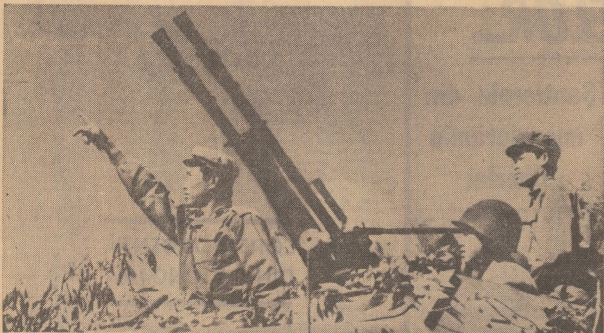
Ostași ai Frontului de Eliberare Națională din Laos la postul de luptă împotriva atacurilor aviației americane