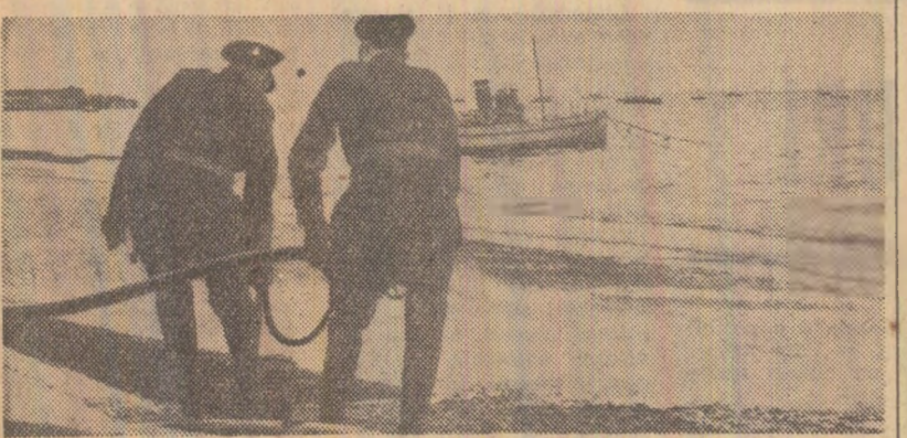
Pompierii și marinarii estuarului Tamisa au fost angajați luni, timp de peste 20 de ore, într-o bătălie dramatică împotriva focului și a poluării. În urma eșecului corgului spaniol „Monte Ulia” de un chei al rafinării de petrol din portul britanic Corydon, 500 tone de petrol s-au revărsat în apele Tamisei. În câteva secunde, petrolul s-a aprins. Peste 100 de pompieri, angajați într-o luptă dură cu focul, au reușit să limiteze incendiul și să evite pagube materiale, dar pentru numeroase plaje de pe Tamisa a apărut primele de poluări. Au fost lansate la apă numeroase ambarcațiuni, de pe care s-au pulverizat mari cantități de detergenți. Astfel a fost înlăturat și cel de-al doilea pericol. În fotografie: pompierii în timpul acțiunii

Știri privind hotărârile conferinței delegațiilor docherilor a fost primită cu satisfacție de cercurile patronale, ale căror lideri de la începutul grevei se cifrează la vreo 450 milioane lire sterline. O serie de nave care au la bord mărfuri perisabile și, ca atare, părăsiseră porturile britanice pentru a se îndrepta spre alte țări au primit ordin să se inapoieze în porturile britanice.