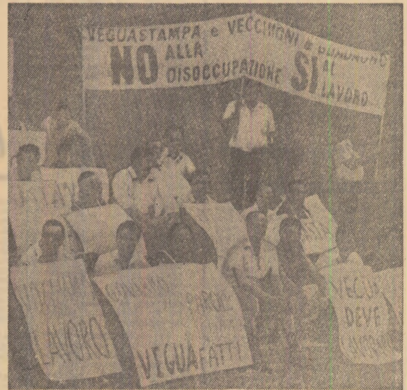
Demonstrație la Roma împotriva șomajului, pentru crearea de noi locuri de muncă

Înundațiile și alunecările de teren care s-au produs în ultimele zile în Nepal au provocat moartea a peste 500 de persoane, anunță agenția France Presse. Regiunile care au avut cel mai mult de suferit de pe urma calamităților naturale sînt cele din estul și vestul țării.