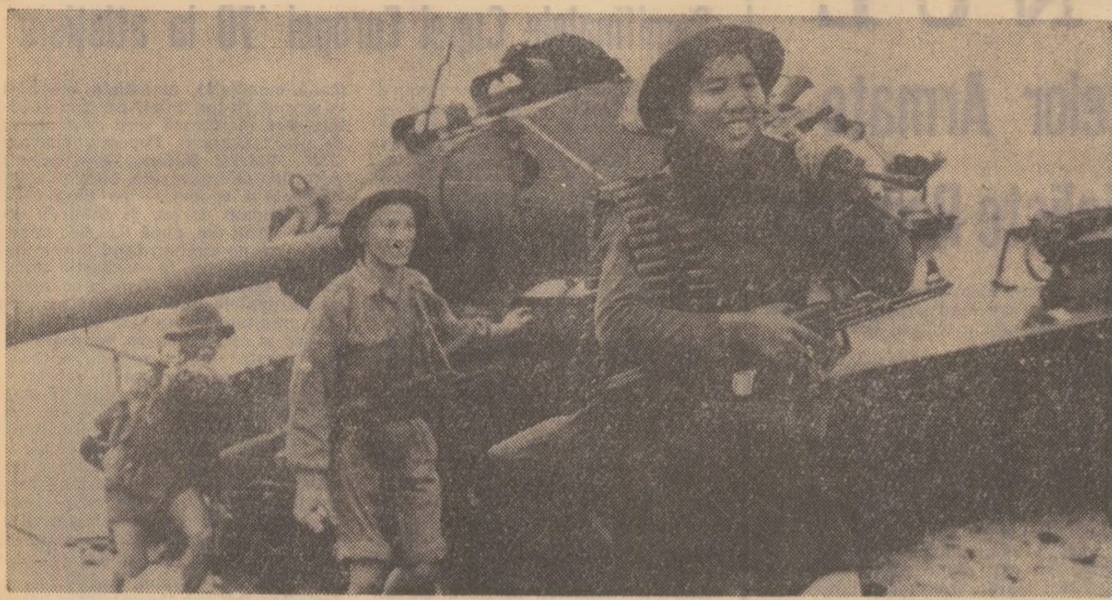
Arme capturate de forțele patriotice sud-vietnameze în urma unui atac împotriva unităților americano-saigo-neze în provincia Quang Tri