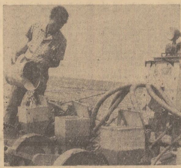
Campania de însămînțare a porumbului în cultură dublă nu conține nici o clipă la cooperativa agricolă din Afumați, județul Ilfov.

(Citii în pagina a III-a raidul-anchetă organizat în județele Sălaj, Ialomița și Iași).