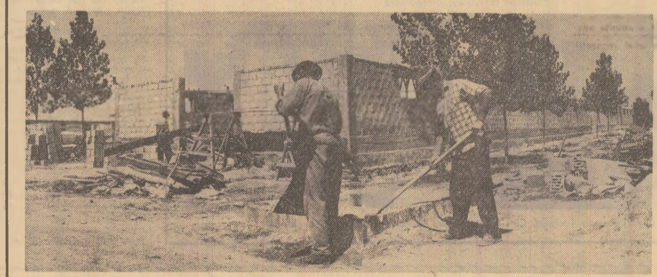
Noi construcţii zootehnice la cooperativa agricolă „Someşul” din apropierea oraşului Satu-Mare, în locul celor distruse de furia apelor.

— Acela a fost nivelul apelor. In interior, însă, grajdurile arată cum erau înainte — explică brigadierul. Au fost curăţate, s-au efectuat re-