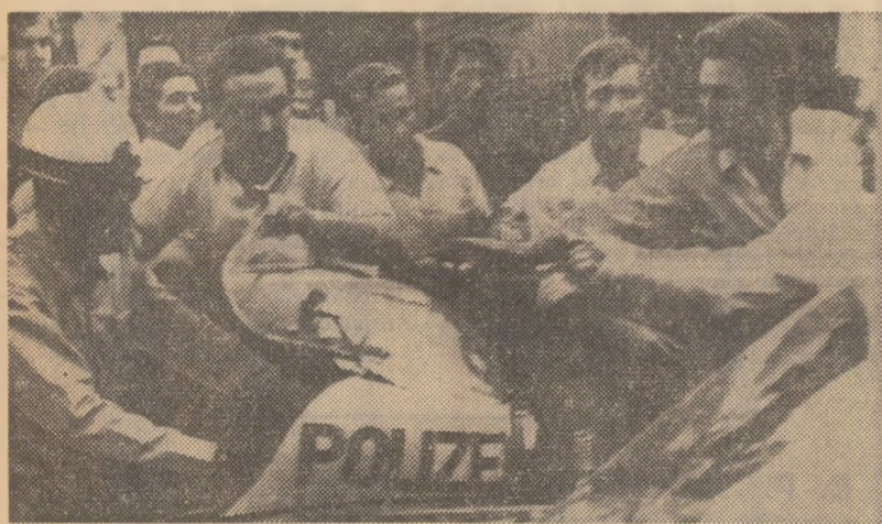
În semn de solidaritate cu lupta revendicativă a muncitorilor spanioli, la Frankfurt pe Main a avut loc o demonstrație la care au participat peste 600 de muncitori vest-germani

Ziua de luni a fost decretată zi de doliu național. Toate instituțiile publice, bancare și comerciale au primit ordin să-și suspende activitatea. De asemenea, au fost suspendate cursurile tuturor școlilor din țară.