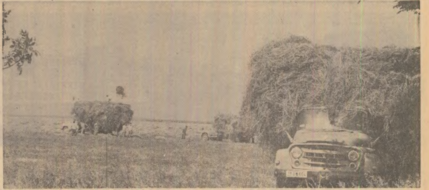
Recoltarea și transportul furajelor la I.A.S. Popești-Leordeni, județul Ilfov

BACĂU (correspondentul „Scintei”) — Colectivele de muncă din 7 întreprinderi industriale din județul Bacău au raportat îndeplinirea înainte de termen a sarcinilor ce le reveneau pentru actualul cincinal. Printre acestea se numără Fabrica de postav din Buhuși, Fabrica de confecții din Bacău, întreprinderea „Salina” din Tg. Ocna. Calculele estimative arată că, pînă la sfîșitul anului, în aceste unități se va realiza o producție suplimentară în valoare de 810 milioane lei. La marea sărbătoare de la 23 August, colectivele a noi întreprinderi industriale din județ, printre care fabrica de hîrtie și celuloză „Letea” din Bacău și unitatea de exploatare și industrializare a lemnului din Agăș, se vor prezenta cu sarcinile planului cincinal îndeplinite.