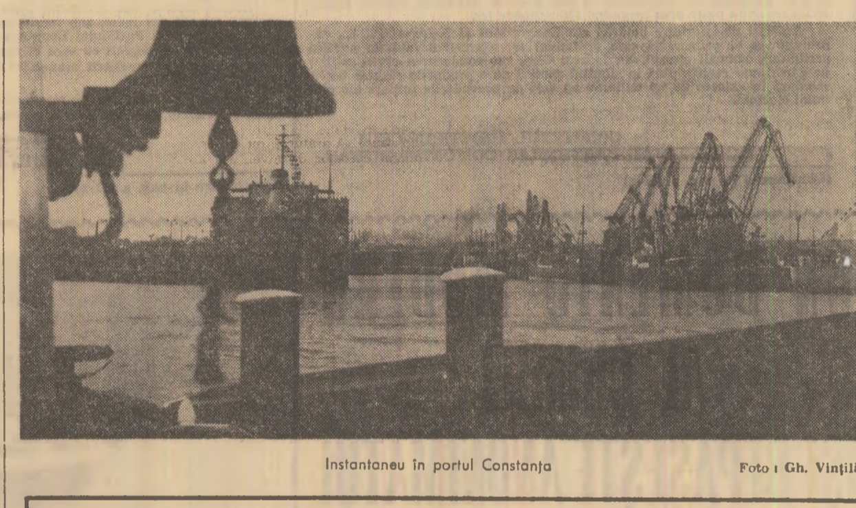
Instantaneu în portul Constanța