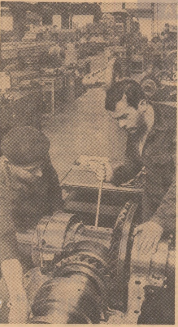
In secția de locomotive a uzinelor „23 August” din Capitală

Cu aproape un an în urmă, din inițiativa organelor de partid și de stat, a fost întocmit și aprobat un amplu studiu privind îmbunătățirea activității în portul Constanța. Măsurile stabilite vizau, în esență, în cadrul activității portuare, într-o formă organizatorică judicioasă, care să permită coordonarea și conducerea directă a procesului de producție de către Direcția navigației maritime NAVROM — Constanța. Astfel, activitatea de expediții internaționale de mărfuri și de agențiară a navelor a trecut de la Ministerul Comerțului Exterior la Ministerul Transporturilor; în locul secțiilor de manipulare a mărfurilor — cu toți felii de servicii ce se suprapuneau — s-au înființat trei secții de exploatare portuară. Urmările pozitive ale ansamblului de măsuri preconizate sunt deosebite. De pildă, prin redistribuirea, la noile capacități portuare puse în funcțiune, a peste 120 cadre tehnice și economice, s-au economisit, la fondul de salarii, câteva milioane de lei. Sarcinile de plan se îndeplinesc ritmic, în mai bune condiții. Până la 1 august, s-a realizat peste prevederi, un tonaj de aproape 200 000 tone mărfuri și aproape 19,5 milioane lei beneficii. În angrenajul complex al portului Constanța, în multiple domenii, se simte vigoarea unei activități raționale, mai bine organizată și condusă de către factorii de răspundere local și ai ministerului de resort.