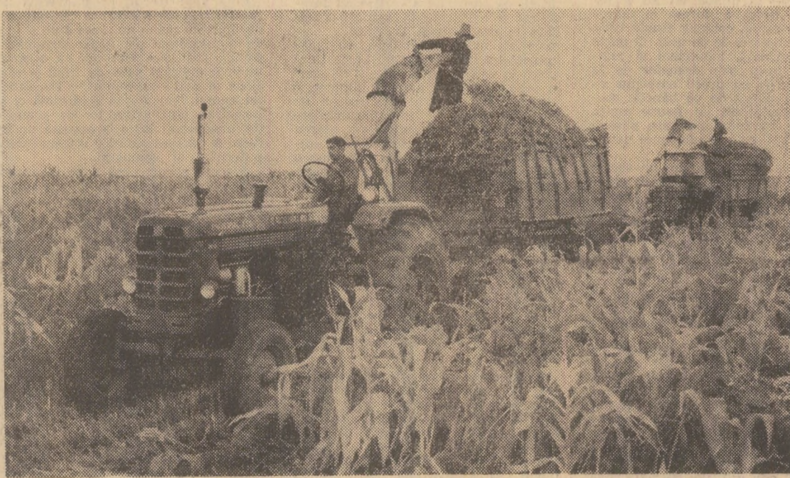
La I.A.S. Ciorogirla, județul Ilfov, se recoltează porumbul pentru siloz — una din principalele lucrări de sezon.

de secția nr. 11 erau planificate venituri în valoare de 21.000 lei. Cum au fost realizate? Pentru tractorul cu stăru nr. 7 pe trimesele I și veniturile zero lei, cheltuielile reparării 674 lei, pe trimestrul II veniturile zero lei, cheltuielile reparării 106 lei, la tractorul nr. 106 situația se repetă (365 lei cheltuieli și nimic venituri) în schimb la nr. 76 apare în luna martie un venit de 26 lei iar cheltuielile se ridică la 1421 lei. La acestea trebuie adăugate cele de amortisment și alte cheltuieli. Adică tractoarele stau, nu produc nimic, dar înghit bani. Ciudată a fost. Ce ar trebui să facă cei care au încredințat tractoarele sau conducătorii întreprinderii pentru mecanizarea agriculturii?