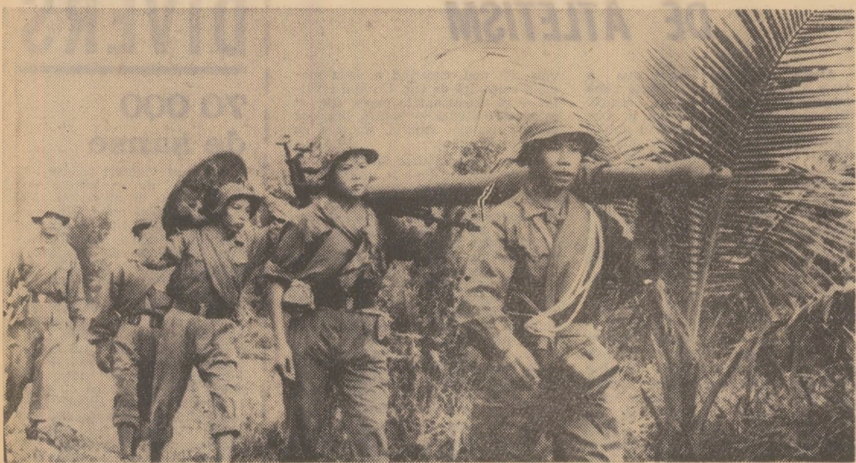
Vietnamul de sud. O unitate de artilerie a forțelor patriotice în marș spre o nouă poziție