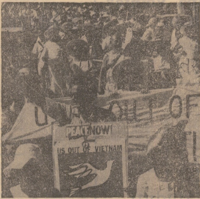
TOKIO — Numeroși locuitori ai capitalei japoneze, printre care și delegații la cel de-al 16-lea Congres mondial împotriva bombelor atomice și cu hidrogen, participind la un marș pentru pace în Vietnam și întreaga lume.

Adversar al fostului președinte Camille Chamoun și al orientării sale politice de dreapta, Suleiman Frangieh s-a remarcat în cadrul Blocului de centru care are 17 deputați în parlament. El s-a făcut cunoscut ca un sprijinitor al activității forțelor palestiniene de rezistență staționate pe teritoriul Libanului, cu condiția ca acestea să nu afecteze suveranitatea și integritatea țării. În acest sens, el s-a pronunțat pentru respectarea acordurilor de la Cairo.