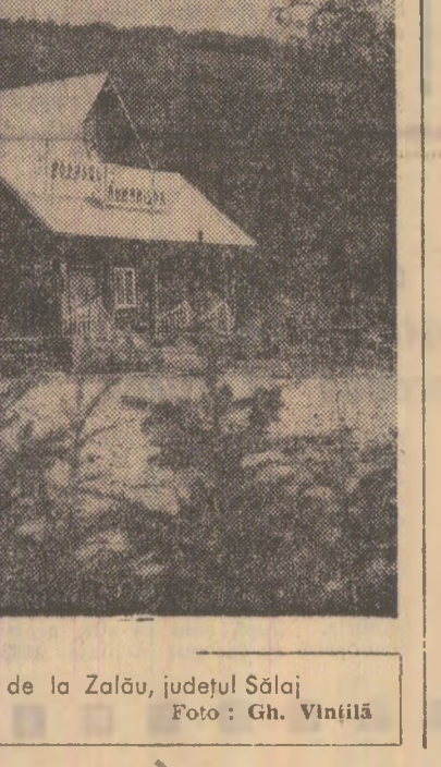
Cabana „Popasului Romanilor” de la Zalău, județul Sălaj.

lerii în țară: Vremea a fost în general frumoasă cu curți variabile. În noaptea mai accentuate s-au produs diminețile în zona Bucegiului și în zona sîc-arpațică a Muntelui, unde a plouat slab, iar după-amiază, în regiunea Munților Bucegi și în Carpații Orientali ploile au avut caracter de averse. Vîntul a suflat în general slab. Temperatura aerului la ora 14 oscila între 16 grade la Joseni și 30 de grade la Băilești.