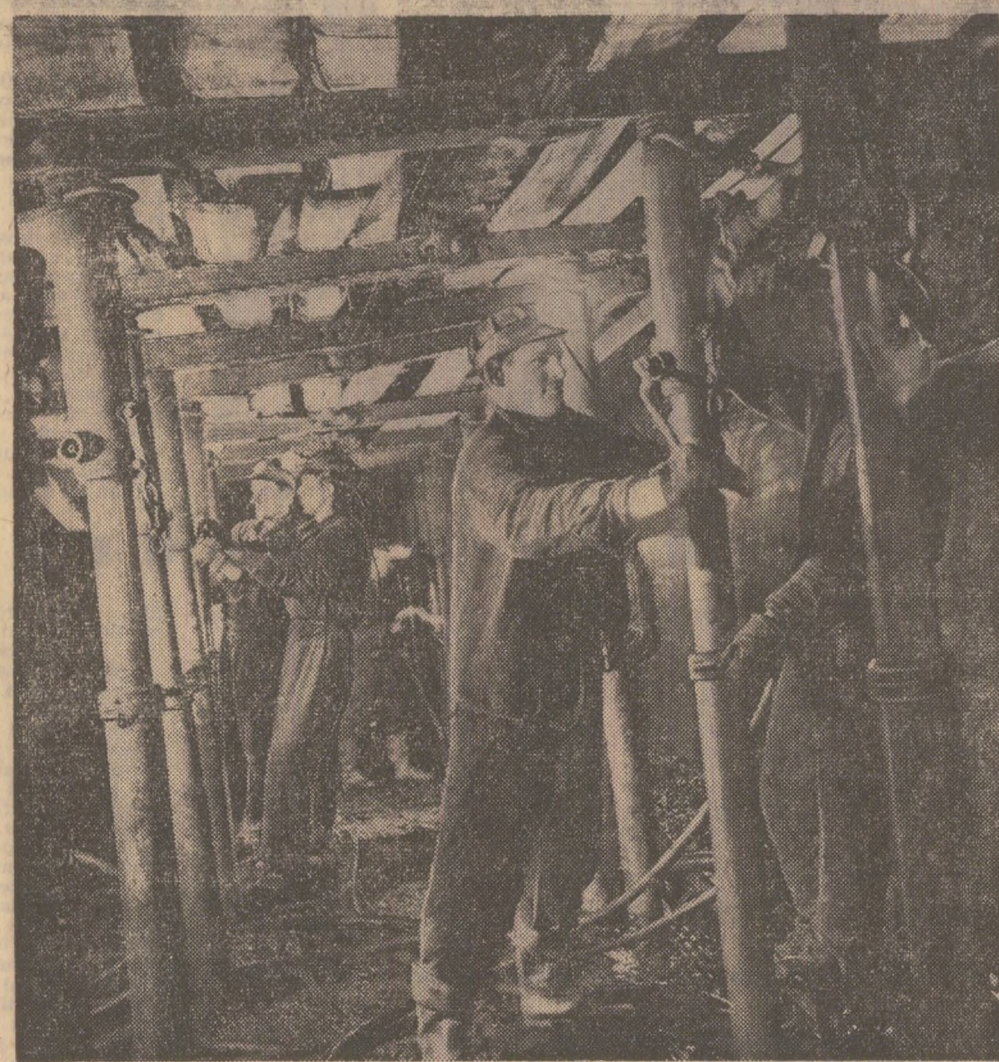
Armarea cu stilpi metalici a unui abotaj cu front lung la mina Poroseni din Valea Jiu-ului

— Să vă spun drept — mi se destăinuia primarul mai puternic decît puțina de a răspunde sincer și cinstit față de propria ta constituția la o întrebare de rîscruce pentru fiecare om: cu ce vis te culci, cu ce gînd te scoli? Dacă visul și gîndul îți sînt închinare obștei, dacă fapta îți-e pătrunsă de interesele ei, apoi poți socoti că trecerea ta prin lumea-n-a fost în zadar... Victor BIRLADEANU