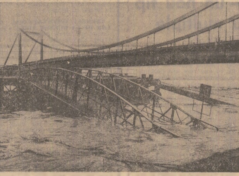
VIENA — Pod pentru pietoni disurs de apele involburate ale Dunării, al cărei debit a crescut brusc în urma recenților ploii ce s-au abătut asupra Austriei