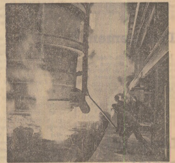
IN PAGINA A III-A

Tăbăcăria minerală. Potrivit datelor estimate, unitățile industriale din municipiul Timișoara vor realiza, peste prevederile inițiale ale cincinalului, o producție în valoare de 24 miliarde lei. Acest spor are la bază creșterea continuă a productivității muncii, care va fi în acest an mai mare cu 46.368 lei pe un salariat, față de nivelul anului 1965.