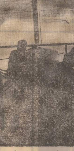
Turnul de comandă al aeroportului internațional Olopeni din Capitală.

Comunistul își manifestă în practică înalta calitate de membru al partidului nostru, prin activitatea concretă la locul său de muncă, prin aplicarea deplină, precipe și dăruire la îndeplinirea sarcinilor stabilite — cu atît mai mult cînd ocupă o funcție de conducere — dar nu numai prin toate acestea; și la fel de importante sînt prezența sa efectivă pe frontul larg al activității politico-educative, de răspundere a ideilor politice partidului nostru, exemplul personal pe care l-a oferit colectivității din punct de vedere profesional, etic și politic.