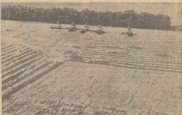
In pagina a III-a