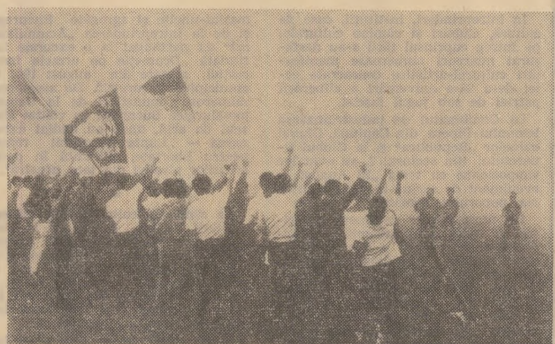
Okinawa — Demonstrație împotriva prezenței militare străine pe insulă. Manifestația din fotografia de mai sus s-a desfășurat în fața unei baze aparținând armatei americane

PNOM PENH 19 (Agerpres). — În noaptea de marți spre miercuri a avut loc în apropiere de localitatea Prek Tameak, situată la numai 15 kilometri nord-est de Pnom Penh, o violentă ciocnire între forțele de rezistență populară cambodgienne și trupele regimului Lon Nol. După cum menționează agențiile de presă, ca urmare a acestei lupte, forțele de rezistență populară cambodgienne au provocat înaintarea în jurul pierderi. De asemenea, forțele patriotice au aruncat în aer un pod în localitatea Osandan, aflată la 75 km de capitală, întrerupând orice comunicație dintre Pnom Penh și Provincia Battambang.