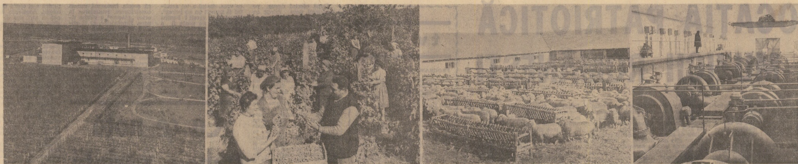
Murfatlar... Ostrov... Falazul Mare... Carasu... Nume străvechi din Dobrogea. Astăzi, stațiuni viticole, fermă I.A.S., C.A.P., sistem de irigații — realități noi din noua istorie a pământurilor dintre Dunăre și Marea...

...Dol oameni — bărbatul și femeia — plantau via de vie, singuri, pe un deal, de mult. Mi s-a spus că asta amintea de un film: nu era nici un film, era o întâmplare obișnuită, pe un deal, într-o amiază de demult. Poate mi s-a întâmplat să văd multe asemenea scene, până când ele s-au adunat într-una singură, definitivă — pe dealurile de la Somova sau pe dealurile de la Niculițelu; poate pe platourile înalte, la Lipnița, la Medgidia, la Ostrov sau în alte zeci de locuri. Pe atunci, toate aceste locuri se puteau confunda între ele, devenind unul singur — un pământ bolit către cer, cenușiu, brăzdat de ripi, populat de striați îngrămădiți de stinți, năpâdit de scaiet, de mărcinișuri, de colibe.