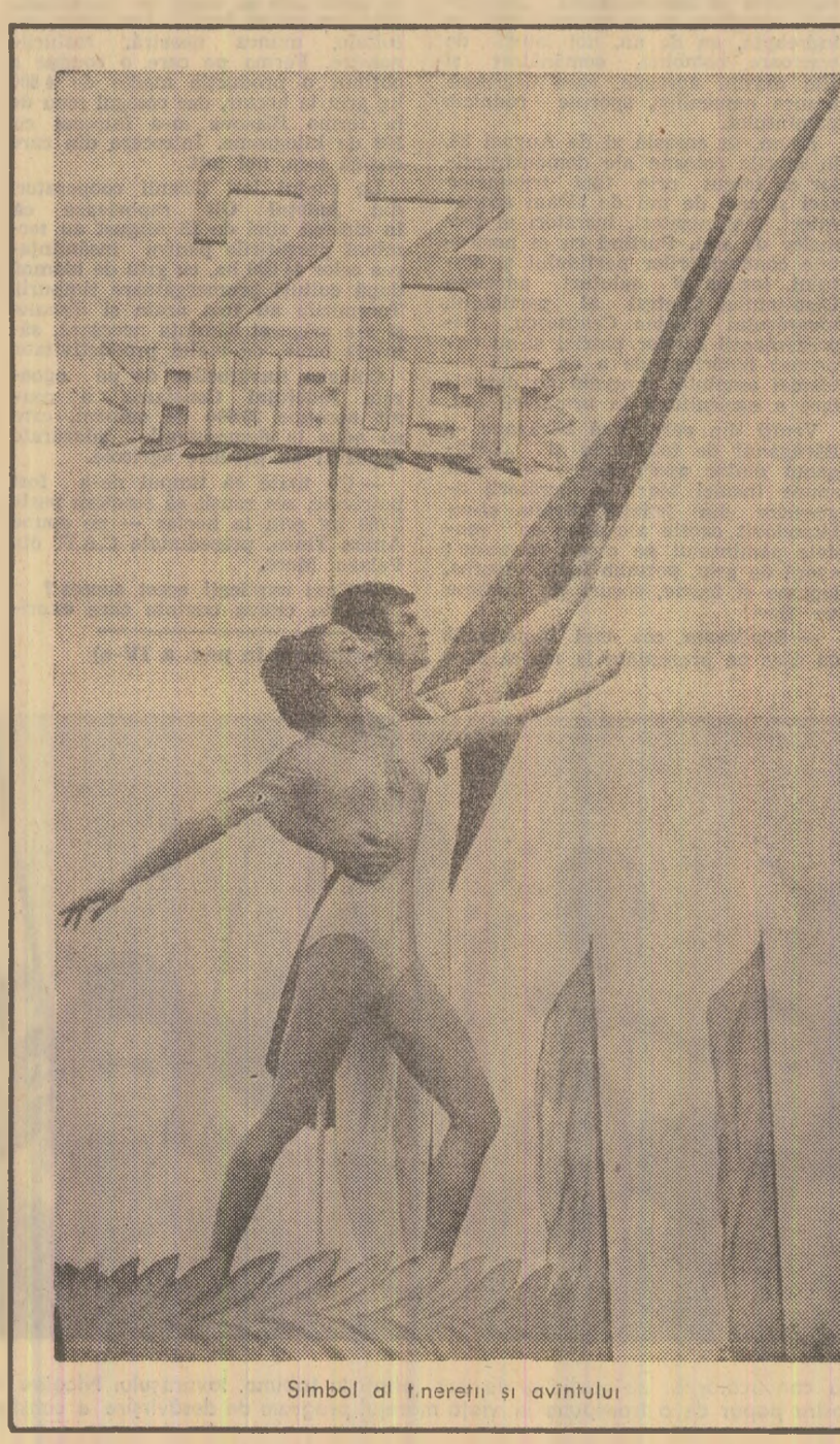
Simbol al înfrăţirii şi avinutului

La Jocurile olimpice, la campionatele mondiale sau continentale, sportivii de la poartele Capitalei şi-au impus talentul şi măiestria lor tehnică în faţa unor adversari reprezentînd ţări cu veche tradiţie în acest domeniu, luptînd cu ardoare pentru gloria culorilor patriei. Aplauze puternice au răsunat pe compo-nenţii echipei naţionale de handball, triplă campionă mondială. Carele alegorice, însemnele de distincţie sau trofeele cucerite, diferitele alte elemente, vorbesc despre victoriile olimpice, mondiale sau continentale ale cluburilor sportive bucureştene între care se impun Steaua, Dinamo, Rapid, Progresul şi altele. Demonstraţia sportivilor, încheiată de un grup masiv de steagari, cu steaguri ale cluburilor şi asociaţiilor bucureştene a ilustrat dezvoltarea mişcării noastre sportive.