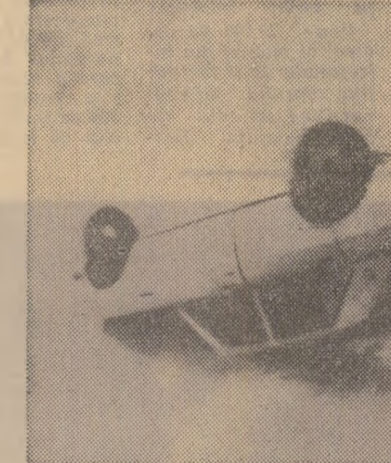
20 de persoane și-au pierdut viața, iar 13 au fost declarate dispărute în timpul taifunului „Anita”, care a bîntuit două zile asupra regiunilor din sudul Japoniei, Totodată, circa 600 de case au fost complet distruse și peste 27.000 inundate.

În Ecuador a fost efectuată o nouă devalorizare a valutei naționale — sucre. Cursul oficial de schimb a fost stabilit la 25 sucre pentru un dolar american. Observatorii de specialitate apreciază că această devalorizare este un rezultat al presiunilor exercitate de Fondul Monetar Internațional.