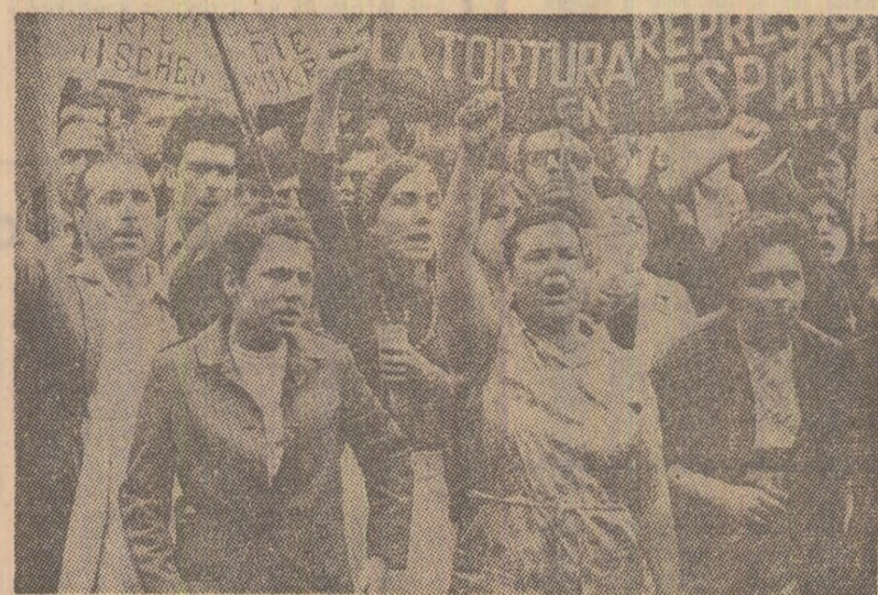
Muncitori spanioli, care lucrează în R. D. Germană, manifestînd la Düsseldorf în semn de solidaritate cu lupta muncitorimii din Spania pentru îmbunătățirea condițiilor de muncă și de viață

CAIRO — Salah Gohar, secretar de stat în Ministerul Afacerilor Externe al R.A.U., l-a convocat pe ambasadorul Irakului la Cairo pentru a