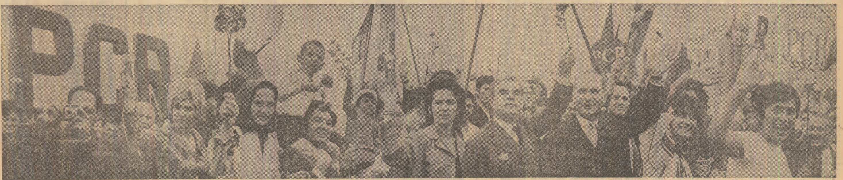
Entuziastă, optimistă plină de însuflețire, populația Bucureștiului adresează conducătorilor de partid și de stat aflați în tribune, tovarășului Nicolae Ceaușescu, urări de sănătate și fericire, cuvinte de înaltă dragoste și prețuire, exprimind totodată hotărârea întregului nostru popor de a transpune în viață mărețul program de desăvârșire a construcției socialiste, elaborat și condus de partid.