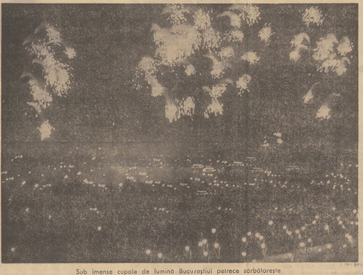
Sub imense cupole de lumina Bucurestii peirca sarbatoarea