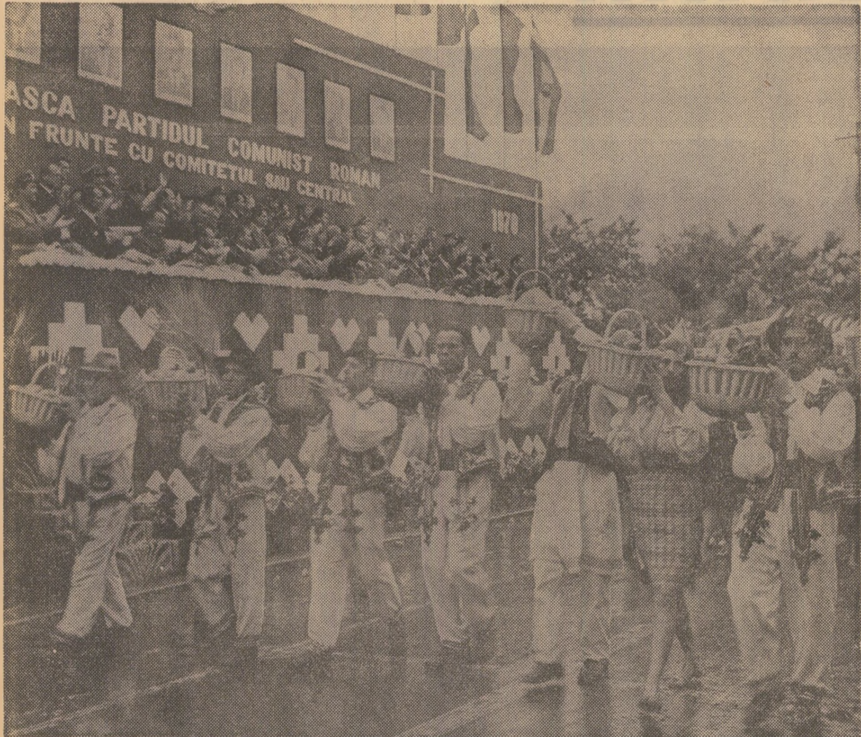
Cu machete, care alegoric şi coşuri virtuozilor ilustrând hărnicia lor şi rodnicia pământului, trec prin faţa tribunelor coloanele celor 5.000 de ţărani cooperatori din Tanacu, Corni, Tîrziu şi altele 30 de sate ale judeţului Vaslui