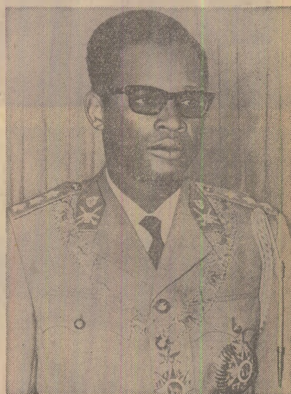
Aici aderă la Mișcarea Națională Congoleză (M.N.C.). În ianuarie 1960 face parte din delegația M.N.C. la

Joseph-Désiré Mobutu s-a născut la 14 octombrie 1930 la Lisala (provincia Ecuatorială). După absolvirea școlii secundare de la Mbanzaka a urmat cursurile școlii de cadre din Luulabourg, apoi cele ale Institutului de studii sociale din Bruxelles. Tot în capitala Belgiei a frecventat cursurile de ziaristică, devenind ulterior colaborator permanent al ziarului „L'Avenir”, iar mai târziu redactor-șef al ziarului „Actualités Africaines” din Leopoldville.