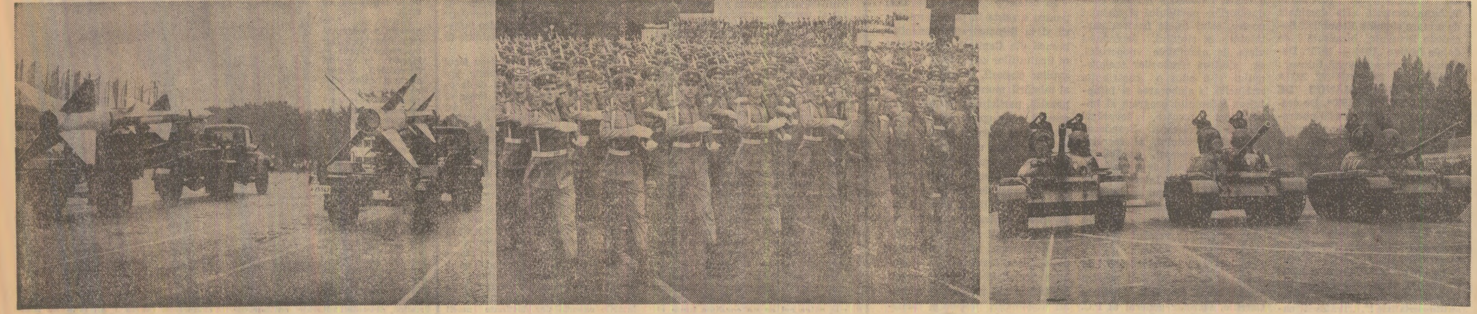
„Servim Republica Socialistă România!”. Sub semnul acestei devise ostășești trec prin fața tribunelor, în șiruri trase cu rigla, fiii patriei noastre îmbrăcați în haina militară, ostași de toate armele, de toate gradele, într-o impresionantă demonstrație de disciplină și măiestrie. În urma lor, pătrînd în Piața Aviatorilor găzrile muncitorești și formațiunile de pregătire premilitară ale tineretului, batalioanele înarmate ale clasei muncitoare, ale întregului popor.