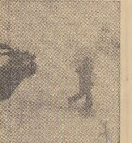
20 de persoane și-au pierdut viața, iar 13 au fost declarate dispărute în timpul taifunului „Anita”, care a bîntuit două zile asupra regiunilor din sudul Japoniei, Totodată, circa 600 de case au fost complet distruse și peste 27.000 inundate.

Guvernul Republicii Africe Centrale a făcut cunoscută hotărîrea sa de a adera la Tratatul privind neproliferarea armelor nucleare. Președintele țării, Jean Bed Bokassa, urmează să ratifice hotărîrea guvernului.