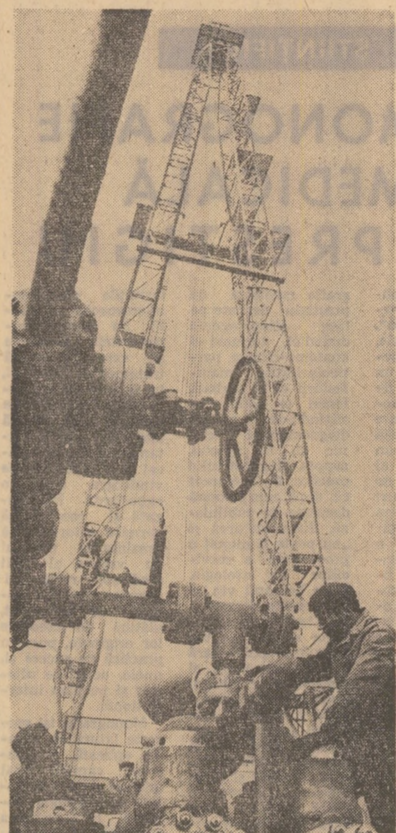
Pe platforma de montaj generală a uzinei „1 Mai”-Ploiești se execută ultimele operații de asamblare a unei instalații de foraj F-200 2DH. Aceasta face parte din cele peste 1.000 instalații românești de foraj, destinate săpării sondelor de dîncimi mici, medii și mari, expediate în actualul cincinal de uzinele constructoare de utilaj petrolifer beneficiarilor din aproximativ 20 de țări ale lumii