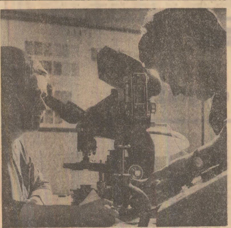
În laboratorul de metalografie al uzinei siderurgice „Oțelul roșu”

Constantin COTOȘPAN corespondentul „Scintei”