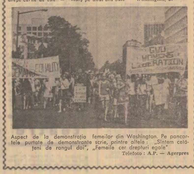
Aspect de la demonstrația femeilor din Washington. Pe pancartele purtate de demonstrante scrie, printre altele: „Sîntem cel dintîi de rangul doi”, „Femeile cer drepturi egale”

Sute de mii de femei americane au marcat miercuri aniversarea unei jumătăți de veac de la ratificarea „amendamentului 19” la Constituția federală — prin care s-a acordat dreptul la vot — organizînd mari demonstrații, mitinguri, marșuri și greve în peste 30 de orașe ale țării. „Scopul primordial al acestor manifestatii, se arată într-o declarație publicată de Organizația națională a femeilor din S.U.A., este de a întări unitatea de acțiune a femeilor și a determina Senatul să ia în dezbateri și să aprobe amendamentul la constituția țării, introdus încă acum 47 de ani, în care se prevede egalitatea deplină a femeii cu bărbatul.” „A sosit timpul ca și despre femei să se scrie în drepturi cu bărbatul. La Syracuse, sute de mame și-au adus copiii în birourile primăriei orașului, în semn de protest împotriva lipsei creșterii și grădinițelor.” La Washington, unde primarul capitalei s-a solidarizat cu cauza lustră a femeilor proclamînd ziua de miercuri ca „zi a femeilor”, a fost organizat un mare marș pe unul din bule-