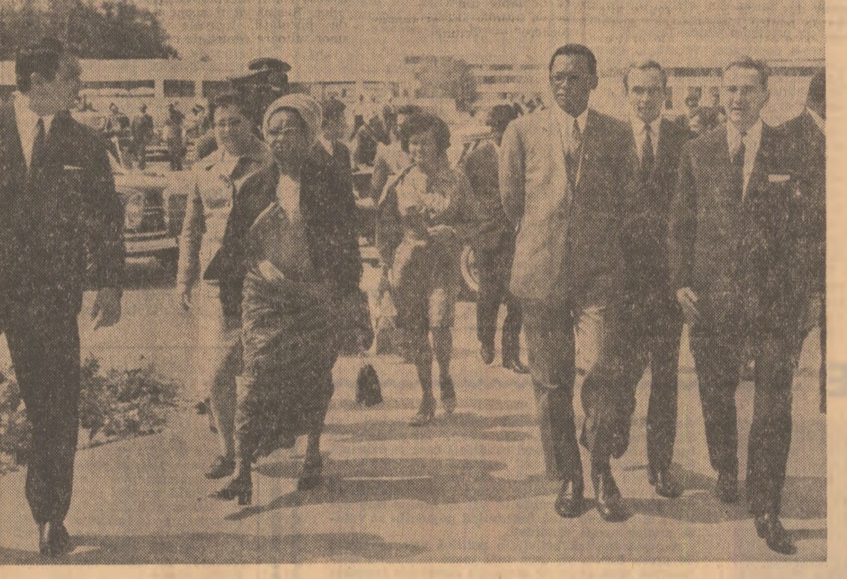
În timpul vizitei pe litoral

Oaspeților congolezi li s-a făcut o primire călduroasă în unitățile vizitate. (Agerpres)