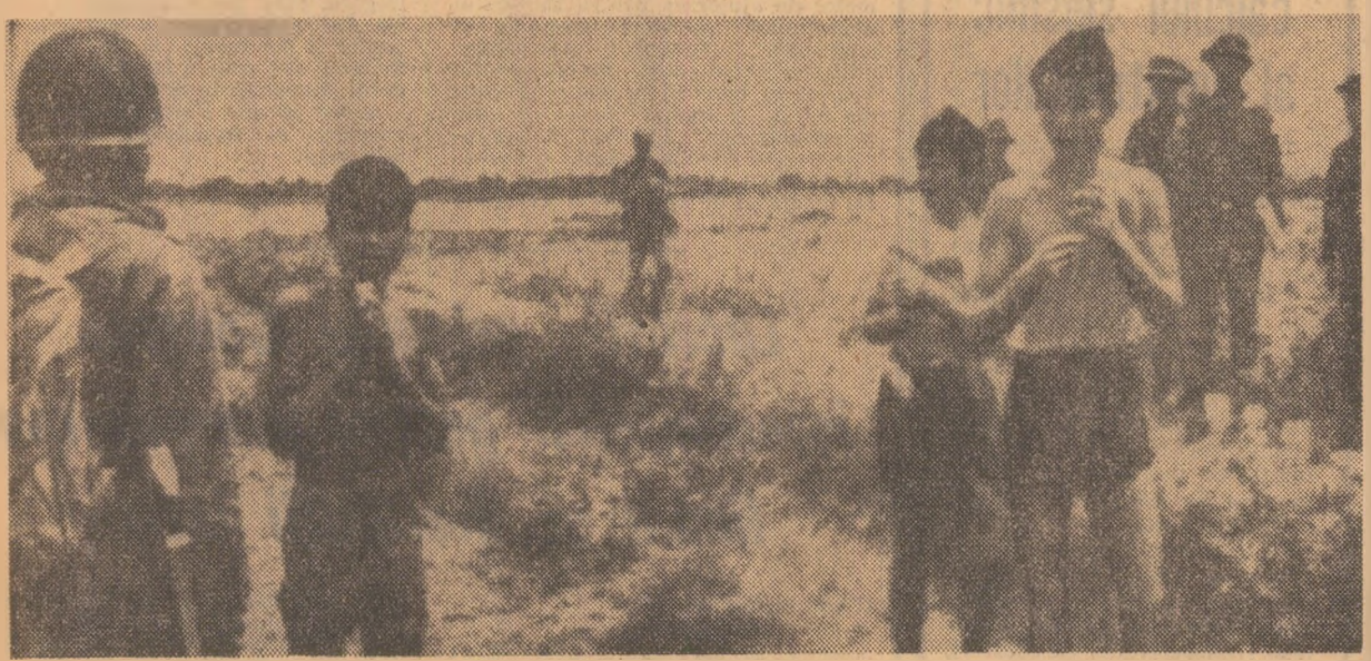
Cambodgia. Țărani suspecți de colaborare cu forțele patriotice, arestați de militari din trupele saigoneze