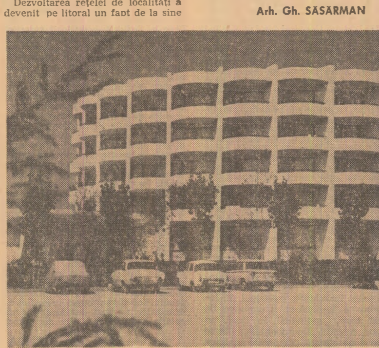
Un fagure de beton și sticlă: hotelul „Raluca” din noua stațiune „Venus”

Revenim la construcțiile pe care le vedeți erau inexistente în panorama de anul trecut a stațiunii Neptun.