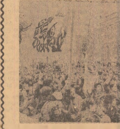
Demonstrație antirăzboinică a studenților americani