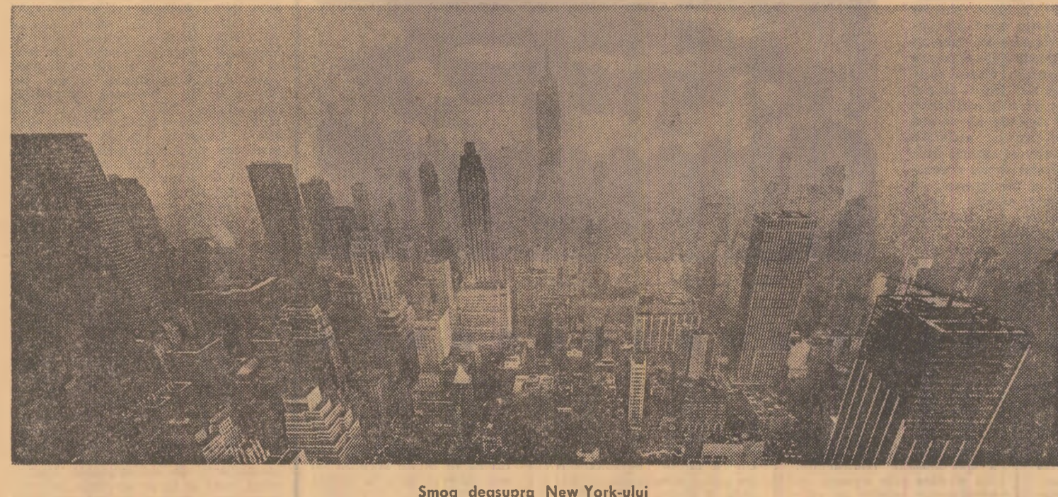
Smog deasupra New York-ului

În fiecare an, Japonia aruncă pe piețele lumii a aproape zece mii de kilograme de perle de cultură. Pe insula Perlelor, ele sînt expuse sub sticla protecțoare — o mare științifică care te imbie să le cumperi. Preturile sînt, oarecum, accesibile. În Japonia poți intra în posesia unei perle nu numai cumpărînd-o, ci și pe calea unui joc de noroc. Am vizitat un magazin unde, într-un raion special amenajat, se ofereau tot felul de obiecte pentru turiști. În mijloc se află un mare ac-