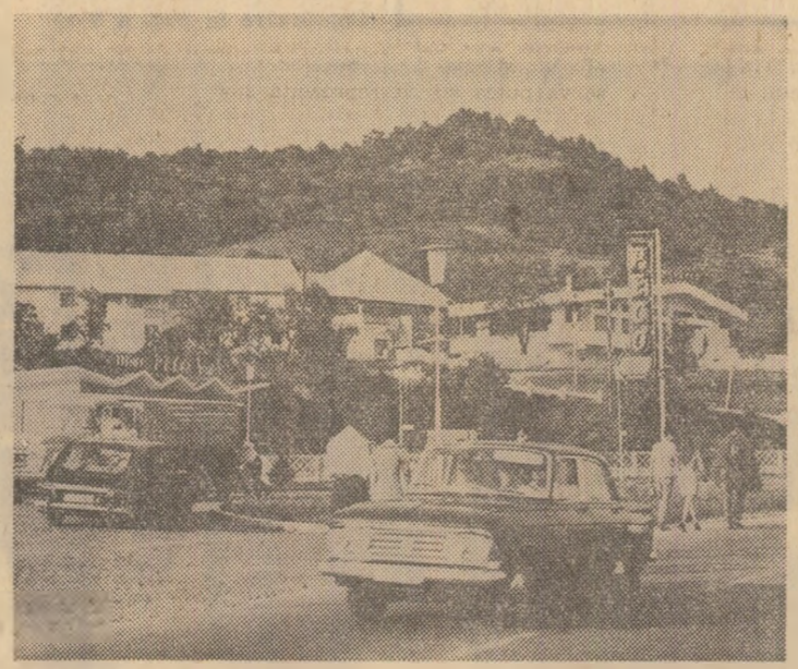
Construind un han în apropiere de ruinele cetății Sarmizegetusa și de rezervația de zîmbri, Centrocop a avut o idee inspirată: aici, la „Bucura”, numeroși turiști din țară și de peste hotare... bucură de un popas plăcut, reconfortant

De cîteva luni de zile, între București și Pitești se află în exploatare prima bandă de asfalt cu două fire de circulație a viitoare autostrăzi. Se lucrează intens, pe diferite porțiuni și la cea de-a doua bandă, la faza despărțitoare, la poduri, podete, acostamente etc. Șinți în curs pregătirii pentru artele de ocire a orașului Pitești, care vor face legătura cu noi autostrăzi, prevăzute a se construi în continuare spre Rim. Vâlcea—Sibiu și spre Slatina—Craiova. De asemenea, se prevede construirea autostrăzii București—Constanța, pe un traseu nou, care va ocire localitățile Bărganului. Iată așadar un amplu program, deschizînd perspective luminoase pentru dezvoltarea traficului rutier, program a cărui îndeplinire a și început să dea road. Să ne întorcem deci la magistrala București—Pitești, nu de