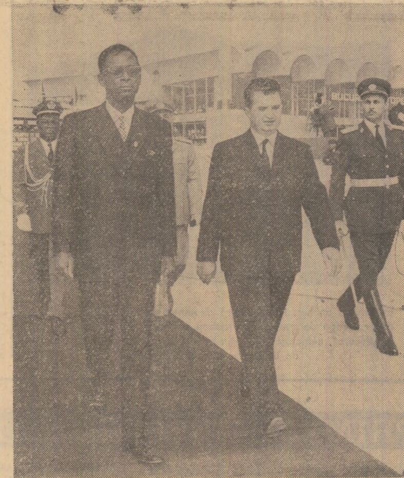
La plecare, pe aeroportul internațional „București-Otopeni“

ARAD (Correspondentul „Științei“). Constructorii de vagoane aradani au realizat cel de-al 60 000-lea vagon fizic. Pe 60 000 de vagoane, care străbat în lung și în lat arterele de oțel ale patriei și ale altor țări, unde sînt exportate, se află o plăcută cu marca „U.V.A.“, o marcă al cărei prestigiu s-a cîștigat prin ai de muncă, hărnicie, spirit novator. Marca „U.V.A.“ este binecunoscută și apreciată azi în U.R.S.S., Ungaria, Polonia, R. D. Germană, Iran, Grecia, Indonezia etc. La Arad se fabrică în prezent circa 90 la sută din vagoanele produse în România. Nomenclatorul de fabricație s-a diversificat continuu, ajungînd la peste 60 de tipuri de vagoane. Printre acestea se află vagonul pe 20 oșii cu o capacitate de 280 tone, destinat transportării agregatelor și instalațiilor grele, vagonul de călători utilizat în componența trenurilor care circulă cu 160 km/h pe magistralele feroviare europene, vagonul marfă de 60 tone, vagonul marfă acoperit de 18 tone etc. — toate avînd caracteristici tehnico-funcționale la nivelul celor mai bune realizări similare din străinătate.