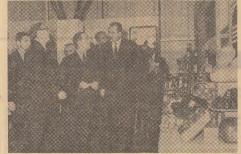
Budapesta — Primul ministru al R.P. Ungare, Jenő Fock, vizitînd pavilionul românesc la Expoziția agroalimentară din capitala ungară

printre participanții veniți la al 3-lea festival de muzică pop, care se desfășoară pe Insula Wight. Nouă persoane au fost arestate pentru folosirea de stupefiante și una pentru furt într-un magazin. În total, pină în prezent, au fost operate 73 de arestări.