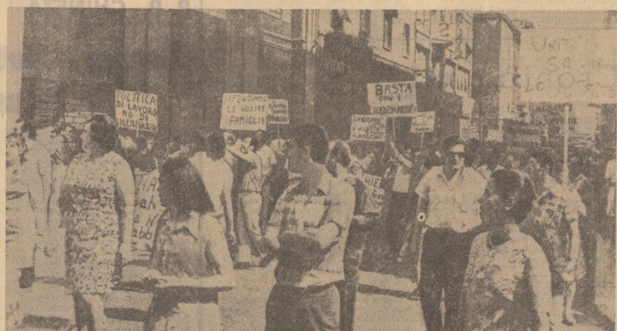
Italia — Manifestație a oamenilor muncii la Treni pentru condiții mai bune de viață și de muncă

Fulgerul din cer senin a fost provocat de deputatul de Nancy, secretarul general al Partidului radical, fostul director al revistei pariziene „L'Express”, Jean-Jacques Servan-Schreiber, care a văzut în desfășurarea campaniei electorale de la Bordeaux un excelent pretext politic pentru a chestiona modul cum premierul Franței și guvernul său își exercită mandatul. Totodată, el a întrezărit posibilitatea creării unei „treia forțe” în Franța, prin realizarea unui bloc al stângii noncomuniste, care să propună în alegerile de la Bordeaux un candidat unic, opus lui Chaban-Delmas și candidatului comunist. Manevra este menită unui dublu scop: pe de o parte de a-l pune pe actualul premier în balotaj, iar pe de altă parte de a împiedica și de astă dată o posibilă