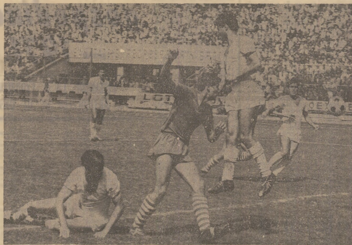
A început campionatul diviziei A! Meciu inaugural de la care prezentăm această imagine l-au disputat echipele Progresul și C.F.R. Cluj, a căror evoluție nu s-a ridicat, însă, la înălțimea momentului

Alte știri și rezultate din țară și de peste hotare în pagina a III-a.