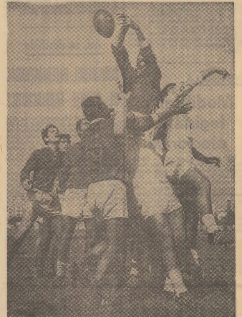
Piramida erortului (Fază din meciul Grivița goșea din Rulmentul Birlad, 28-6, disputat ieri pe stadionul Grivița din Capitală)