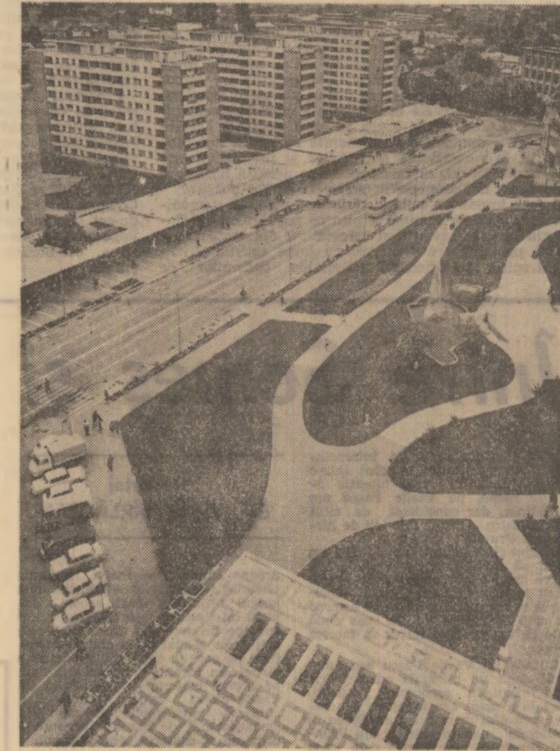
La Piatra Neamț