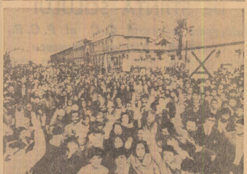
Miting electoral la Santiago de Chile. Multimea acclamă pe senatorul Salvador Allende, candidat al forțelor de stnga.

MOSCOVA 2 (Agerpres). — După cum anunță agenția TASS, locțiitorul ministrului sănătății al U.R.S.S., Avetik Burnazian, a declarat unii corespondent al ziarului „Pravda” că în regiunea Astrahan sînt focare de holeră care au fost localizate. El a arătat că tratamentul celor bolnavi s-a încheiat și se poate afirma că situația în prezent este stabilizată. Tot așa slau lucrurile la Kerel și Odesa, unde a pînă în infestia. „Noi dispunem de toate mijloacele necesare în vederea eradicării infecțiilor. Tratatamentul început la timp garantează vindecarea totală”, a declarat locțiitorul ministrului sănătății. Ziarul relevă faptul că au fost luate măsuri ca toate persoanele care părăsesc teritoriul U.R.S.S. să fie vaccinate contra holerei.