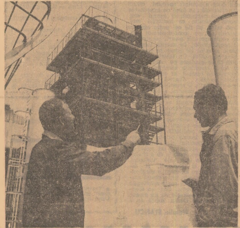
Uzina „Vulcan” din Capitală este binecunoscută prin gama largă a cazanelor de mare capacitate pe care le fabrică pentru echiparea termocentralelor. Fotografia înfățișează ultimele operații de montaj la un cazan de 25 G/cal pe oră

Proiectantul — Institutul de proiectări pentru industria materialelor de construcții din București — poartă o mare răspundere pentru stadiul intruzat al acestei lucrări. Șeful de proiect a fost schimbat de trei ori. Nimeni din partea institutului nu a stat mult timp pe șantier să rezolve problemele, fapt ce a făcut imposibilă începerea unor lucrări, continuarea altora. Beneficiarul are și el partea sa de răspundere. O seamă de utilități, care ar fi trebuit să fie de mult