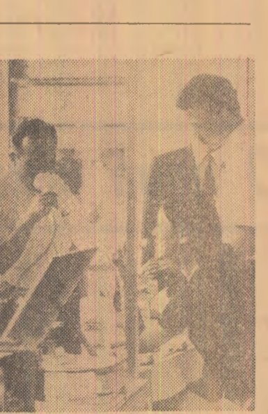
Japonia. Ca urmare a poluării tot mai intense a aerului din capitala japoneză, la Tokio au fost instalate generatoare de oxigen, unde trecătorii, contra unei taxe, pot respira aer proaspăt

VENETIA 2 (Agerpres). — La Venetia a luat sfârșit marți seara cel de-al 31-lea Festival internațional al filmului, Directorul ediției din acest an a festivalului, Ernesto Laura, a anunțat că lui Orson Welles i-a fost acordat un premiu pentru prodigioasa sa activitate de cineast în cursul anului 1970.