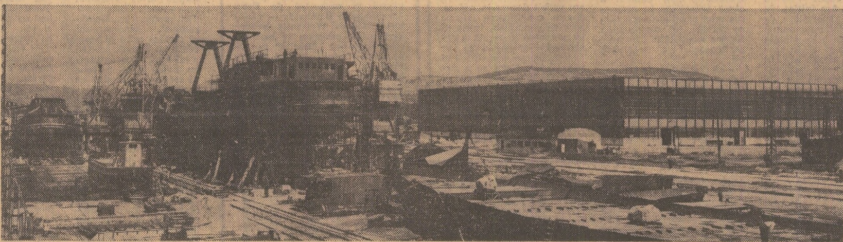
La Șantierul naval din Turnu Severin se produc cargouri frigorifice de 2000 tone, șleperi de 1000 tone, șalande de 500 mc