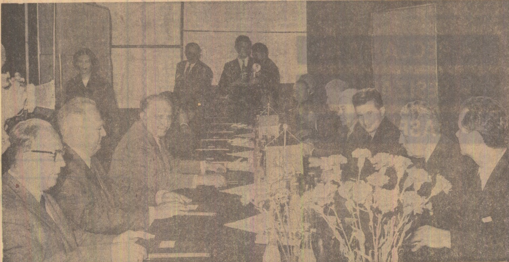
Întîlnire caldă, prietenească

Au participat, de asemenea, consilieri și experți. În cadrul convorbirilor, care s-au desfășurat într-o atmosferă tovarășească, cordială, au fost abordate probleme privind construirea în colaborare a complexului hidroenergetic de pe Dunăre Islaz-Somovit și s-a făcut un schimb de păreri privind relațiile bilaterale.