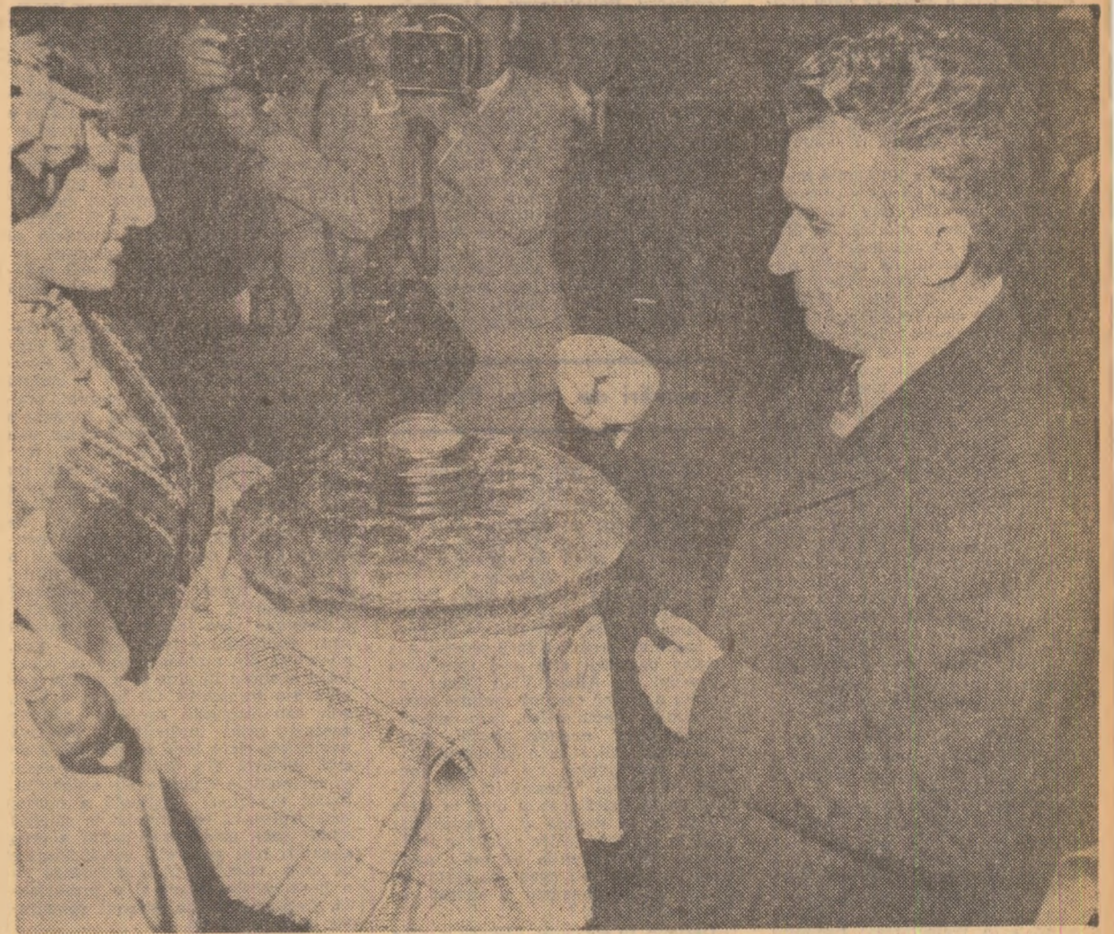
Oaspeții sînt întâmpinați cu piine și sare de către cooperatorii din Straklevo

Seara, la înapoierea în orașul Ruse, cetățenii salută cu căldură, cu sentimente prietenești, delegația de partid și guvernamentală română condusă de tovarășul Nicolae Ceaușescu.