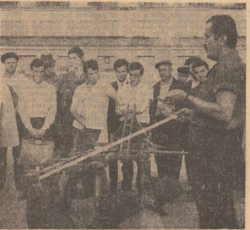
Lecciónile practice privind tehnologia grîului sînt frumose, ca la carte, dar ce se întîmplă în cîmp?

Am început aceste considerații plecînd de la instructorul făcut la I.M.A. Cuza Vodă. Așa cum am putut constata pe teren, în cea mai mare parte a unităților se respectă cerințele tehnologiei grîului, dar la aproape toate capitolele, există și abateri, mai mici sau mai pronunțate. Situațiile întîlnite dovedesc că este nevoie de măsuri ferme și un control riguros, pentru ca cerințele agrotehnicii grîului să fie aplicate întocmai în practică. Aceasta ar constitui garanția obținerii unor recolte mari în 1971.