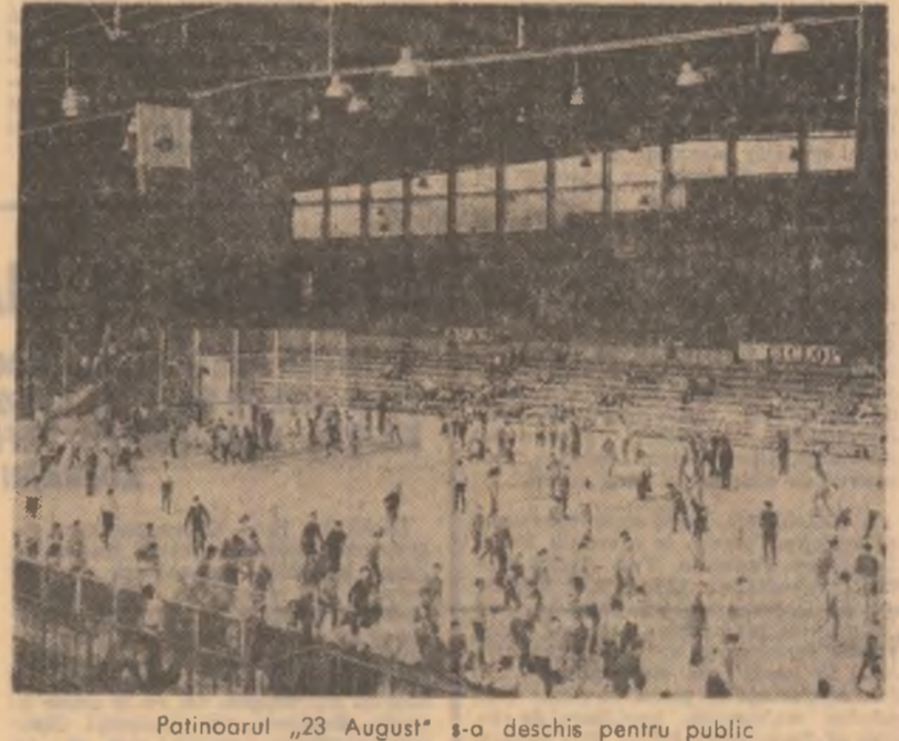
Patinoarul „23 August” s-a deschis pentru public.

edificare a societății socialiste multilaterale dezvoltate, fundamentat de Congresul al X-lea al P.C.R. Acordîndu-i în vînt o atenție primordială activității economice, analizînd prin mijloace publicistice adecvate, atât experiența pozitivă cât și neajunsurile existente încă, ziarul își va spori aportul la înfăptuirea politicii partidului de asigurare a progresului economic, social și cultural pe întreg teritoriul țării. Cu prilejul acestui jubileu, transmitem colegilor din Baza Mare un salut călduros și le urăm noi și însemnate succese în activitatea rodnică pe care o desfășoară. Cu prilejul acestui jubileu, transmitem colegilor din Baza Mare un salut călduros și le urăm noi și însemnate succese în activitatea rodnică pe care o desfășoară.