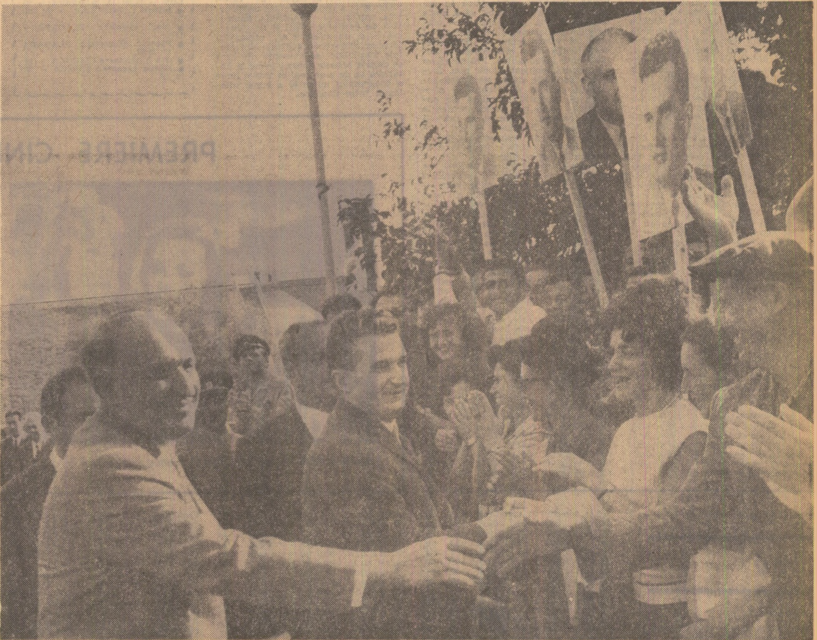
Locuitorii orașului Ruse au făcut o entuziastă primire înalților oaspeți