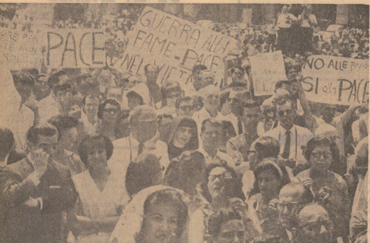
Roma — Demonstrație pentru pace în Vietnam și în întreaga lume