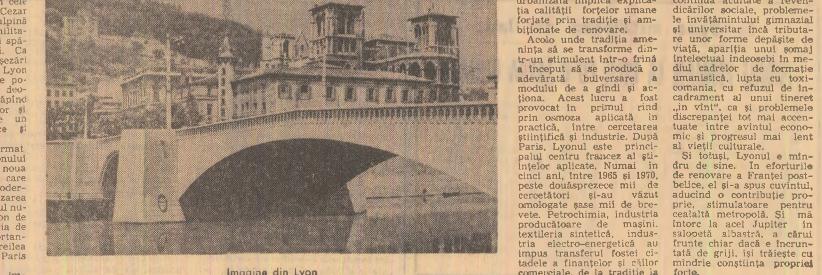
Imagine din Lyon