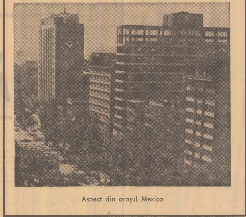
Aspect din orașul Mexico