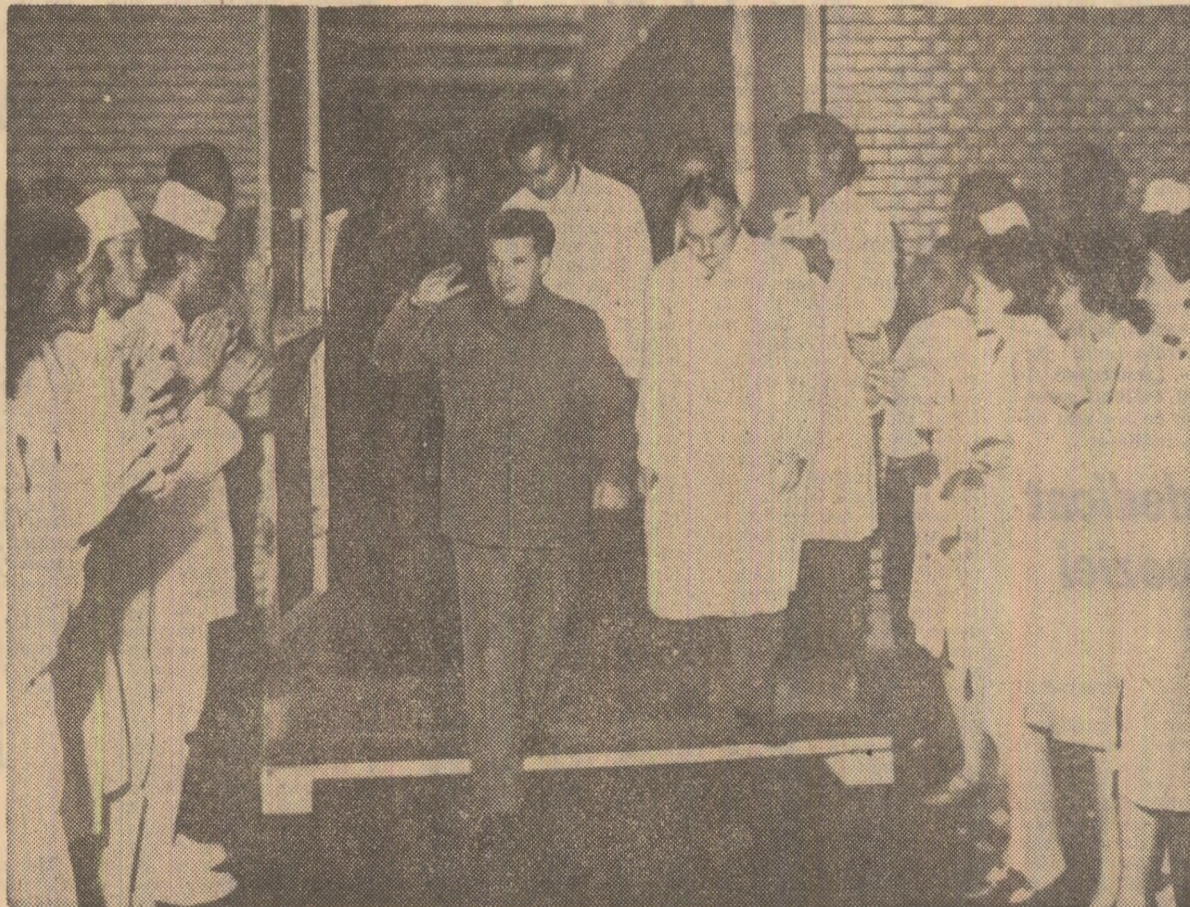
La Fabrica de brinzeturi fermentate din oraşul Bistriţa