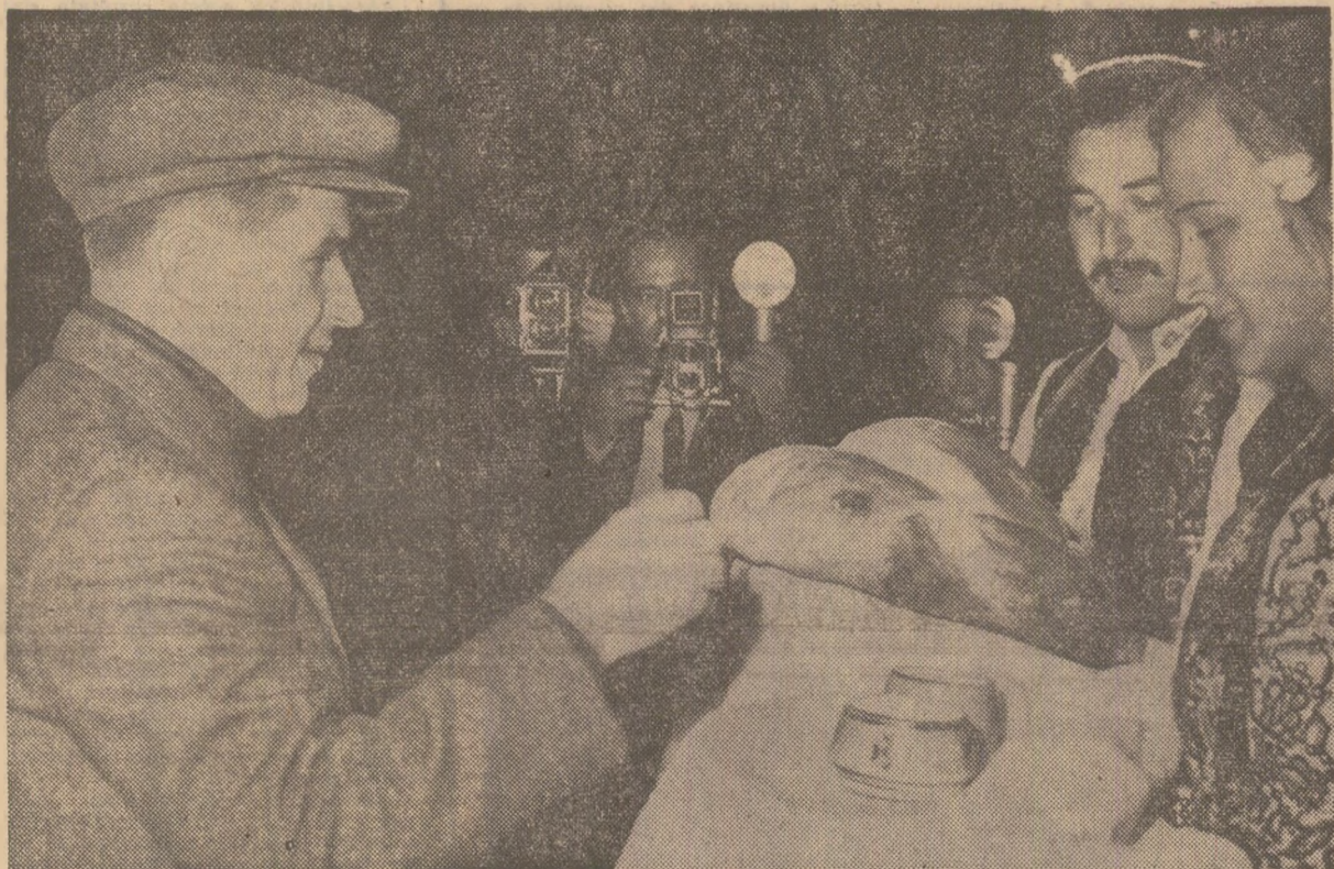
După dafina românească, bistrijenii îl întâmpină pe conducătorul iubit al partidului și statului cu pine și sare

În drum spre obiectivele economice care urmează să fie vizitate, coloana de mașini străbate orașul, vechi de secole, dar care în acești ani s-a integrat armonios și dinamic în procesul general de înflorire și dezvoltare a patriei. Cetățenii sînt mindri de faptul că numai în actualul cincinal s-au construit aici o modernă fabrică de produse lactate, un mare complex de prelucrare și valorificare superioară a fructelor și legumelor. Zona geografică a Bistriței și Năsăudului este vestită ca unul din bazinele pomicele de seamă ale țării. Dar la o veche caracteristică a acestor meleaguri se adaugă noi trăsături. La Bistrița se dezvoltă înalt industria construcțiilor; recent a început construcția unei mari fabrici care va produce pentru prima dată în țară înlocuitori de piele, materiale pentru tapiterii de autovehicule. În oraș se înalță siluetele unor noi și moderne blocuri de locuințe. Toate acestea sînt dovezi edificatoare ale vieții noi de pe aceste locuri, mărturie ale înfăptuirii politicii realiste a partidului de dezvoltare armonioasă, multilaterală a tuturor județelor țării. Dinamizarea vieții economice și sociale pe care o cunoaște această parte a țării în ultimii ani confirmă justetea măsurilor inițiate de partid, rațiunile superioare, mul-