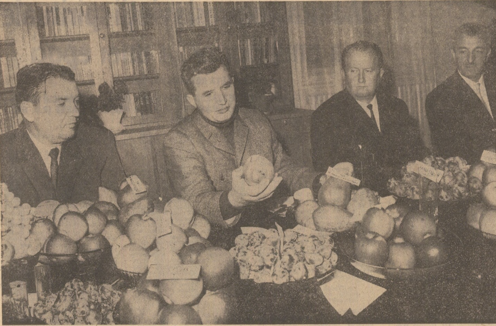
În timpul vizitei la Staţiunea experimentală pomicolă Bistriţa