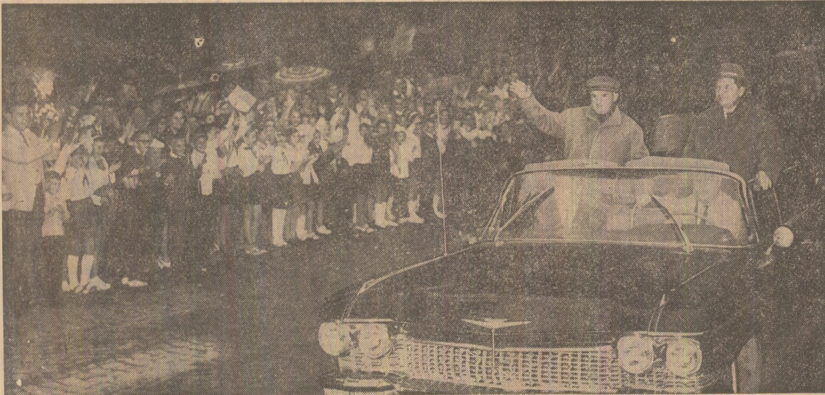
Populația îi salută cu deosebită căldură pe oaspeții dragi

Primul ministru al guvernului Republicii Democratice Vietnam