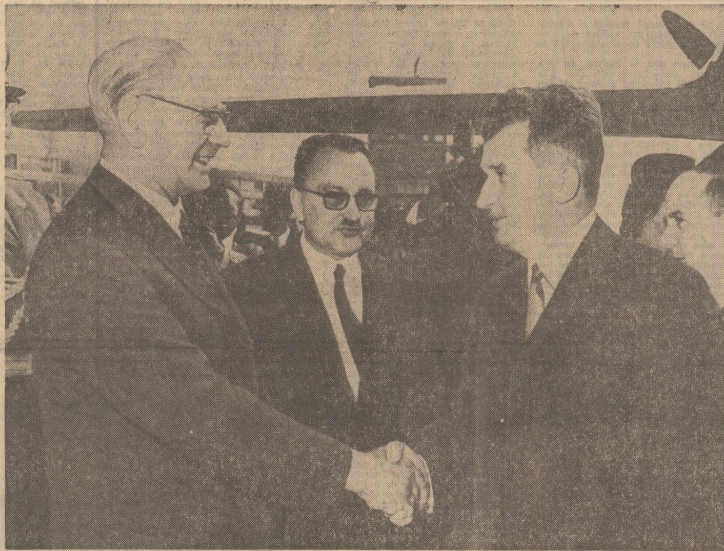
La sosirea pe aeroportul Schwechat din Viena

Avionul oficial cu care călătoresc președintele Nicolae Ceaușescu și celelalte personalități române decolează la ora 10.