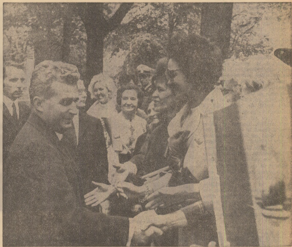
Cu aclamații, aplauze, calde stringeri de mînd — așa a întâmpinat populația Vienei pe șeful statului român

— pentru prosperitatea și fericirea poporului austriac; — pentru prietenia și colaborarea dintre România și Austria; — în sănătatea dumneavoastră, domnule președinte, și a stimatei doamne Jonas; — în sănătatea tuturor celor de față!