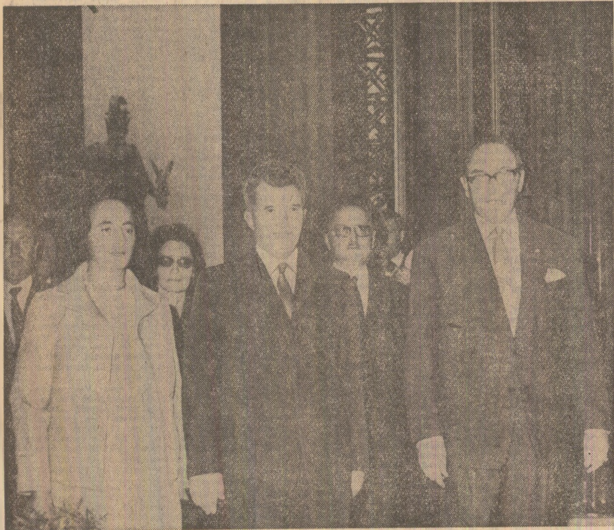
Vizita la Parlament