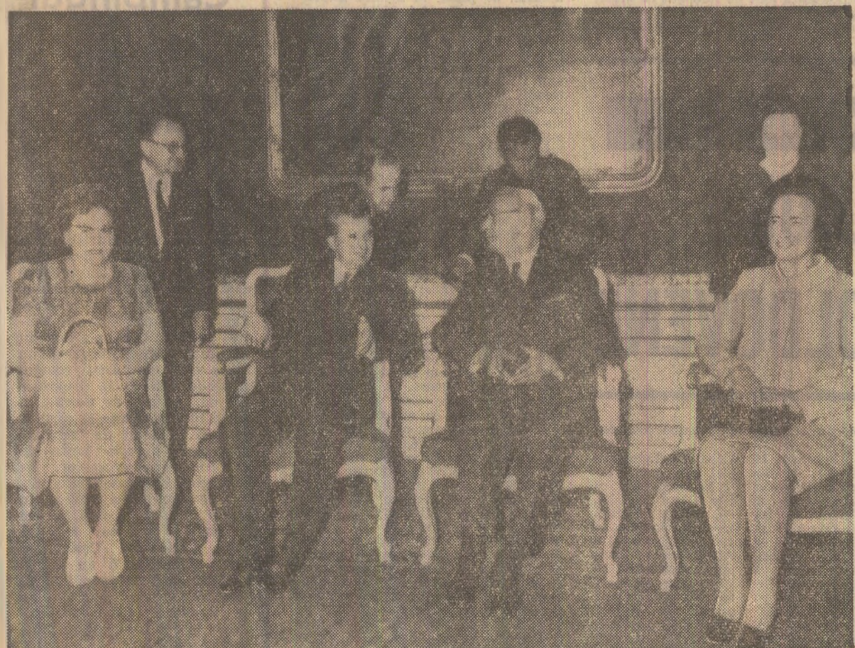
În timpul vizitei protocolare la Palatul Hofburg

Toastul președintelui FRANZ JONAS Toastul președintelui NICOLAE CEAUȘESCU