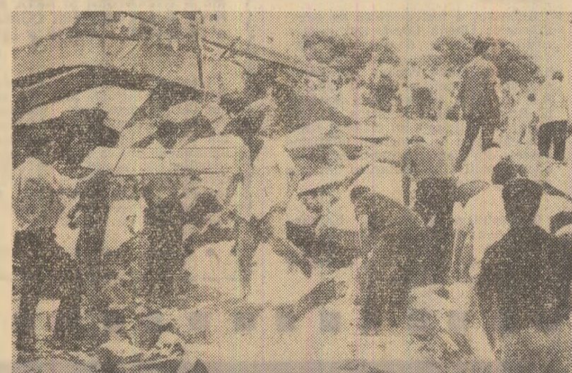
Un bloc cu 9 etaje, în curs de construcție în orașul spaniol Almeira, s-a prăbușit, îngropînd peste 30 de muncitori. Pînă în prezent au fost scoși de sub dărîmături 3 morți și 18 răniți. În fotografie: în timpul operațiunilor de degajare a victimelor accidentului