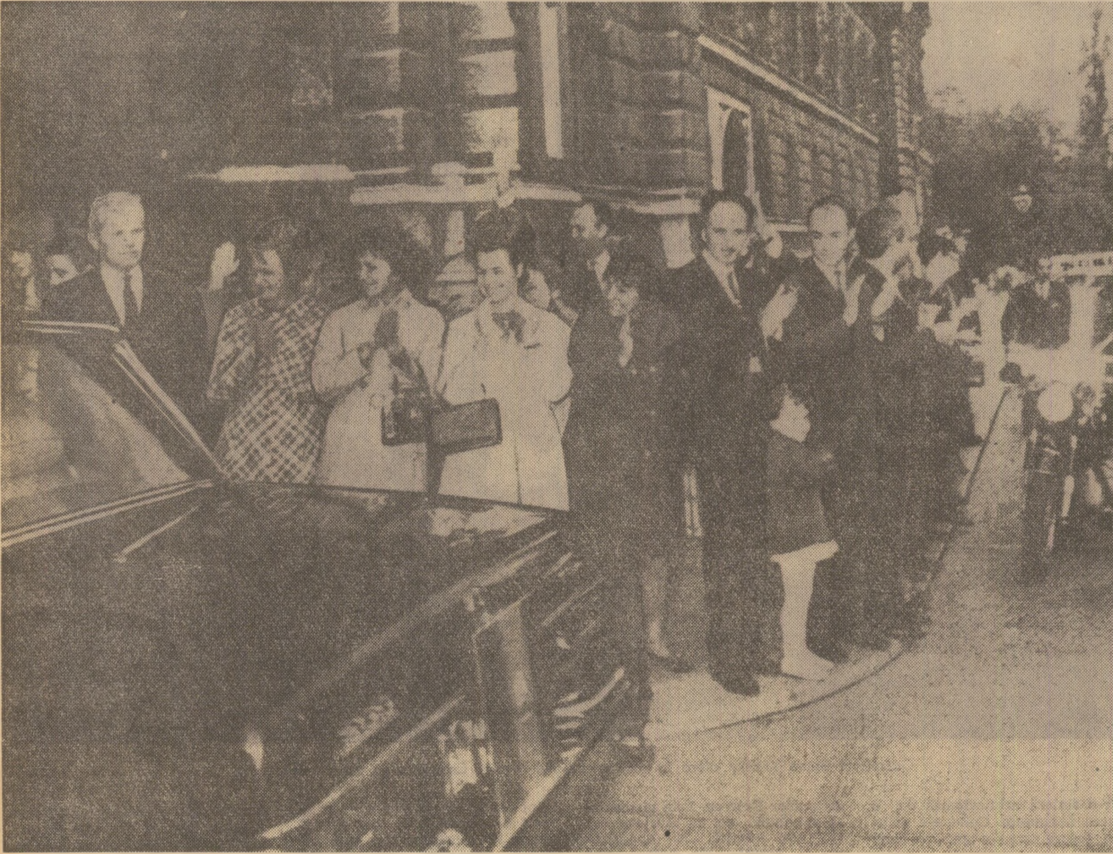
Pretutendenți, în Viena, înalții oaspeți sint salutați cu cordialitate

(Urmare din pag. a III-a) ria artelor, oaspeții români se întorc la reședința de la Hotel