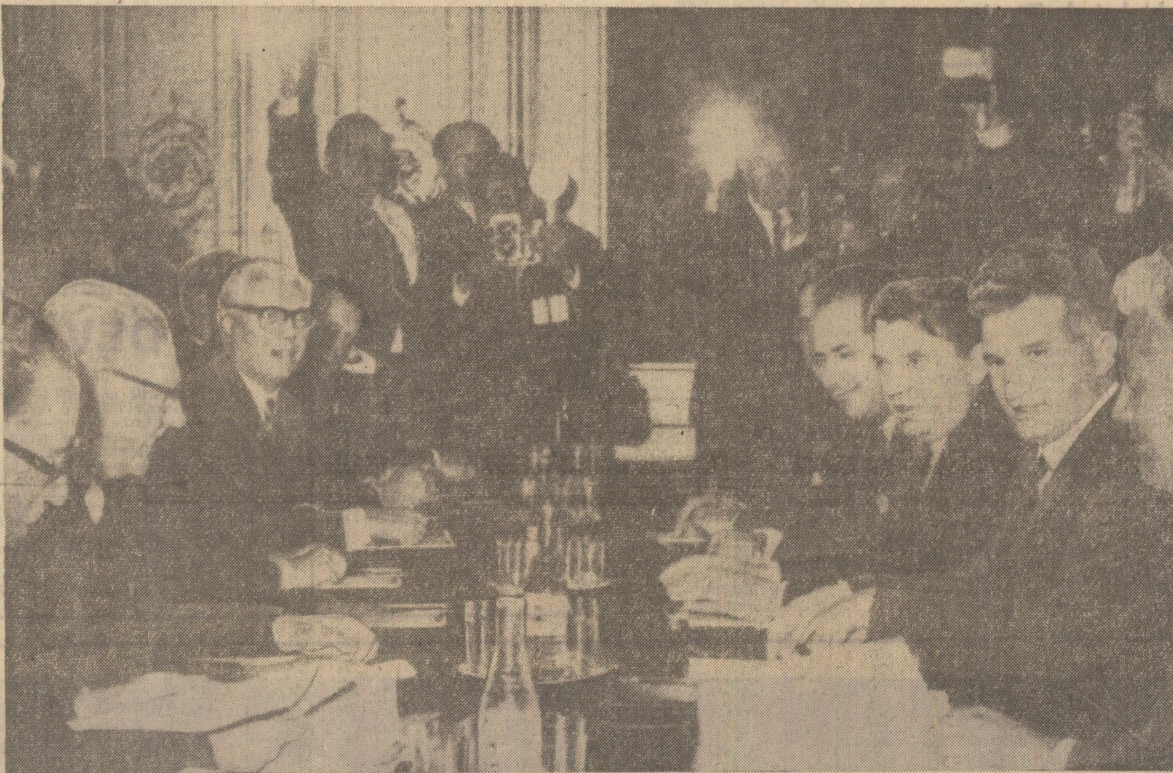
În timpul convorbirilor oficiale, la palatul Hofburg