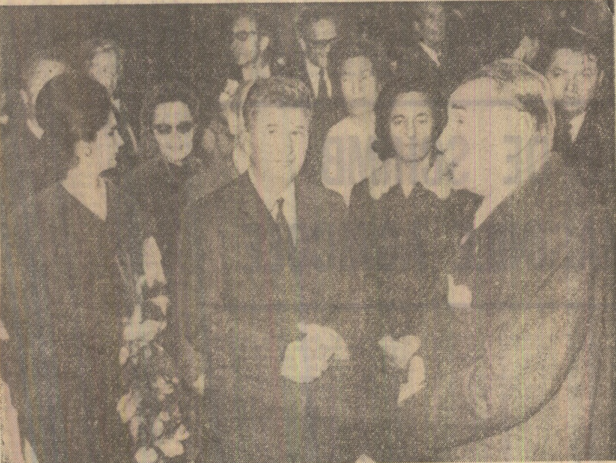
Se vizitează primăria orașului Viena

Președintele Consiliului de Miniștri al Republicii Socialiste România