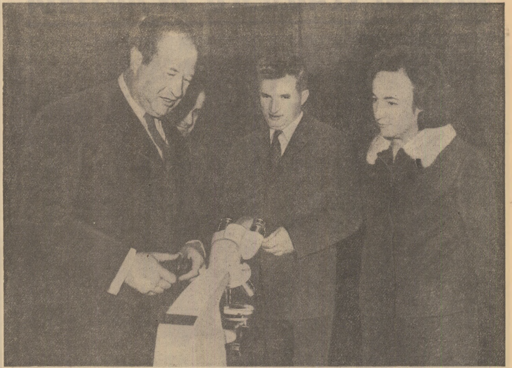
Călin Popescu oferă în dar tovarășului Nicolae Ceaușescu un modern microscop

În încheierea vizitei, președintele Consiliului de Stat al României semnează în Cartea de aur a municipalității.