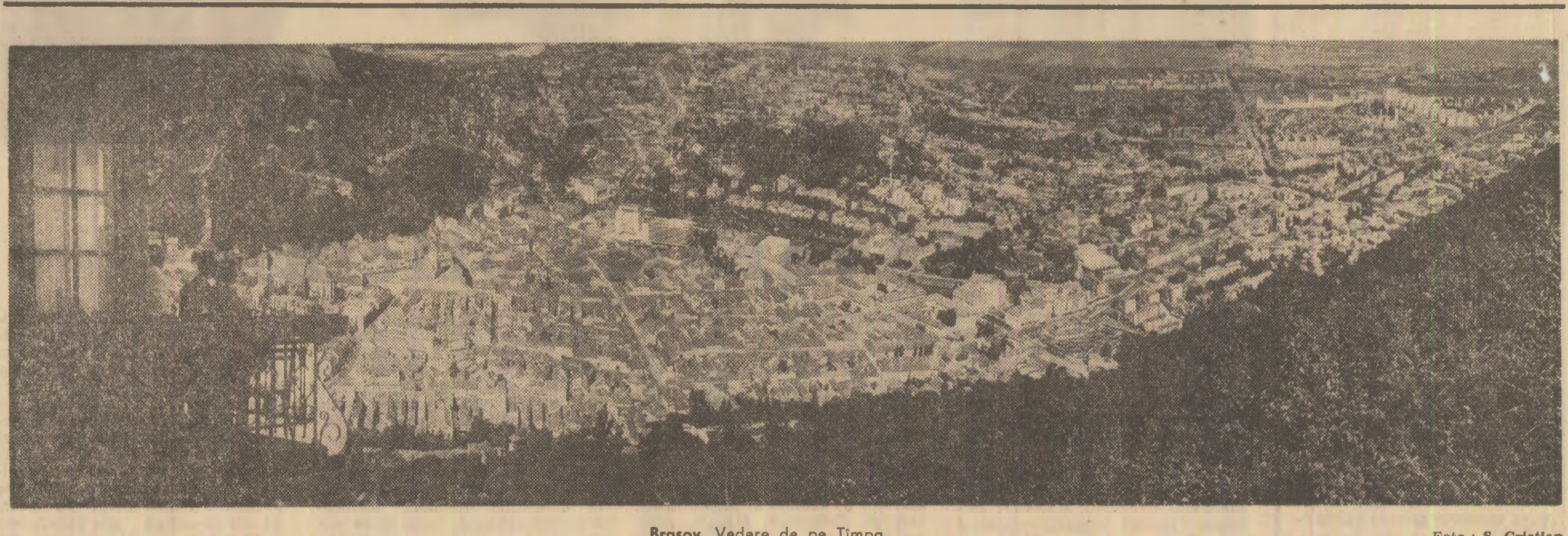
Brașov. Vedere de pe Timpa

„Electromontaj”, care 400 kV. De asemenea, își desfășoară activitatea pe raza a 10 județe, execută și alte construcții electrice. În prezent se află în faza de finalizare liniile de înaltă tensiune, Hidrocentrala Porțile de Fier-Slatina și Centrala electrotencică Gecora-Rm. Vilcea. Prevăzute stațiile de transformare aferente. (Agerpres)