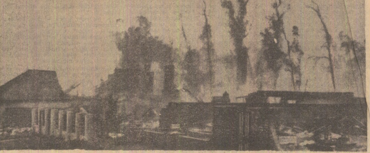
În nordul orașului american Los Angeles s-au declanșat violente incendii care au distrus 60.000 de hectare de pădure și peste 250 de case. S-au semnalat și victime omenești. Două orașe, cu câteva mii de locuitori, amenințate de înaintarea flăcărilor, au fost evacuate. În fotografie: distrugeri provocate de incendii

GENEVA — Comitetul Internațional al Crucii Roșii a anunțat marți seara că ultimii șase ostași deținuți de comandanții Frontului Popular pentru Eliberarea Palestinei în Iordania au fost eliberați și se află în siguranță. Comunicatul prezicează că această știre a fost primită de membrii delegației Crucii Roșii Internaționale aflați la Amman.