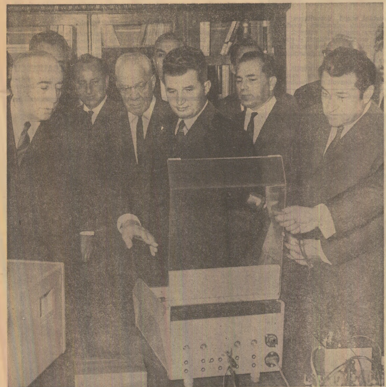
Într-unul din laboratoarele Institutului de construcții

La încheierea vizitei în clinică, tovarășul Nicolae Ceaușescu și ceilalți conducători de partid și de stat înmînează mgrafii reflectînd activitatea desfășurată de Institutul de medicină și facie din București în cei 100 de ani de existență, precum și un pement omagial, care studenții cadrele didactice ale institutului exprimă în noștința pentruțria deosebită care secretarul general al partidului poartă învățămîntului.