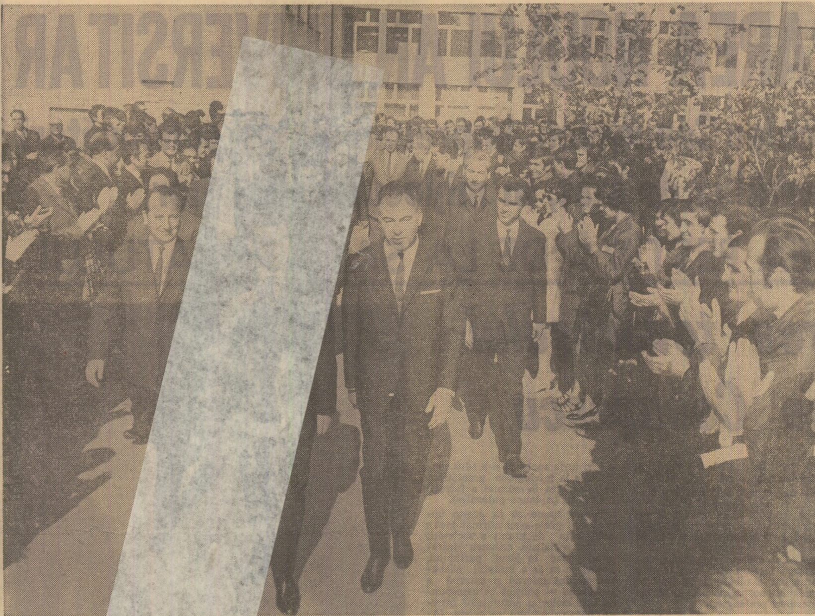
Pretutindeni, în instituțiile de învățămînt superior vizitate, profesorii și studenții fac o caldă și entuziastă primire tovarășului Nicolae Ceaușescu

Tineretul studios, corpul profesional vîd în prezența conducătorilor partidului și statului nu numai o cinstire ce se aduce școlii superioare, dar și o dovadă elocventă a prețurii pe care o acordă partidul, întregul popor, rolului ei în opera de făurire a societății socialiste multilaterale dezvoltate. Răspunsul studențimii, al profesorilor la această încredere s-a materializat, ieri, în călduroasa primire pe care au făcut-o pretutindeni tovarășului Nicolae Ceaușescu, celorlalți conducători de partid și de stat, expresie a devotamentului și atașamentului profund față de politica marxist-leninistă a partidului nostru, a încrederii în viitorul patriei, în angajamentele însușite pe care și le-au luat de a asigura țării noi generații de cadre cu înaltă calificare, caabile să aducă o contribuție sporită la edificarea socialismului pe pămîntul României.