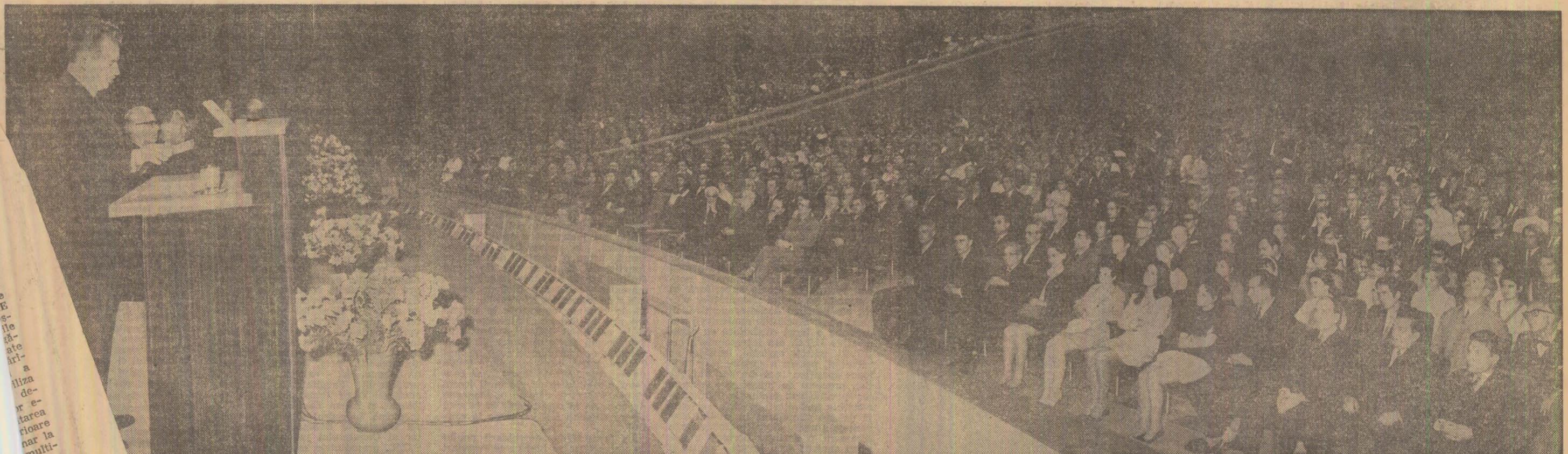
Cu o vie atenție și un profund interes, profesorii și studenții ascultă cuvîntarea secretarului general al partidului

Vă urez spor la muncă și la învățatură, sănătate și multă fericire la toți, tovarăși. (Aplauze puternice, prelungite; urale îndelung repetate; întreaga asistență, în picioare, ovacionează puternic pentru Partidul Comunist Român, pentru Comitetul Central, pentru secretul general al partidului, tovarășul Nicolae Ceaușescu).