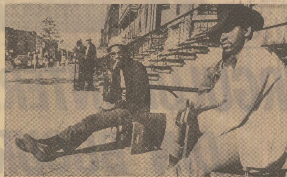
Șomeri pe o stradă din Harlem