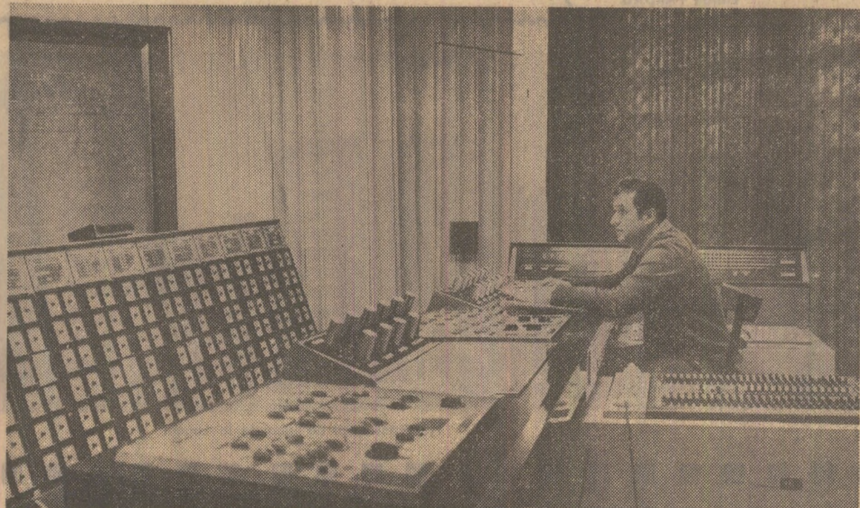
Întreprindere de centrale hidroelectrice Bistrița din municipiul Piatra-Neamț; dispecerul energetic „con-lucează” stîrns cu calculatorul electronic