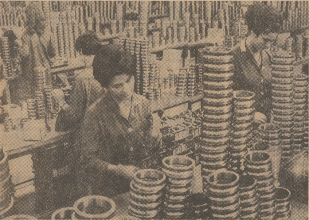
Uzina de rulmenți din Brașov: În secția de asamblare a rulmenților.

Ca o panglică nestîrșită se întinde, între București și Pitești, noua autostradă. Cu toate că asfaltul nu-i prea neted, cum s-ar cere la o autostradă (și bucată nouă) mașinile circulă în siguranță și nu au sparg pasivetele de beton ale poțetelor. De ce? Au fost amplasate prea aproape de firul asfaltului și de aceea trebuie fărîmate bucată cu bucată. În locul lor se toarnă altele la o