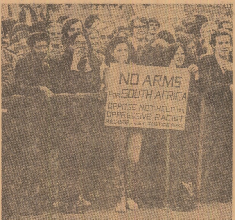
Demonstrație în Trafalgar Square din Londra împotriva planurilor guvernului britanic de a relua livrările de armament către Republica Sud Africană.

Fostul prim-ministru francez, Couve de Murville, a sosit marți la Pekin pentru o vizită în China la invitația guvernului chinez, informează agenția China Nouă. La aeroport, el a fost salutat de reprezentanți de frunte ai unor ministere și departamente. Au fost prezenți, de asemenea, membri ai Ambasadei franceze.