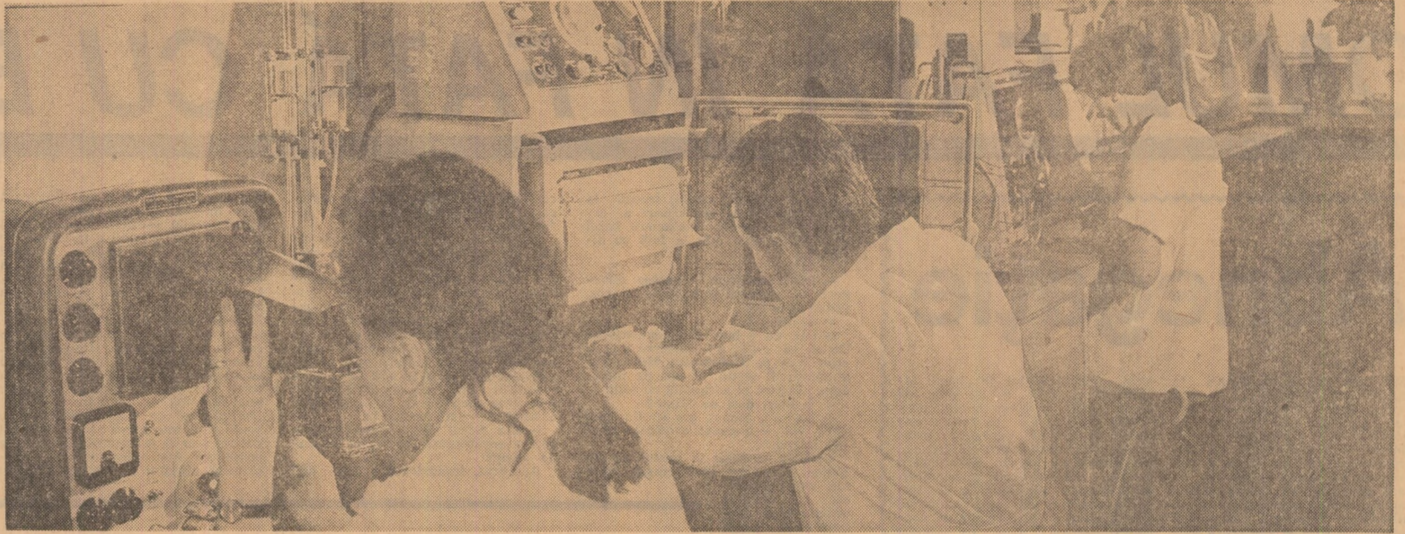
Aspect din laboratorul de analize polarografice al Institutului de proiectări și cercetări pentru metale neferoase și rare

În legătură cu programul prioritărilor amintit, cu măsurile luate pentru îndeplinirea lui în condiții optime și cu perspectivele care se deschid în acest domeniu, dăm cuvântul specialiștilor: