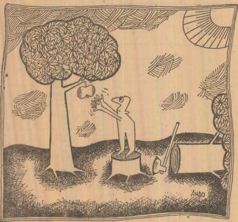
„Scopul scuza mijloacele?” Desen de Octavian ANDRONIC

menșa situații majoritatea celor în cauză nu cer sprijin, este adevărat că, după cum constată o veche zicală, „bine cu sila nu se poate face”. În general, intervențiile în viața intimă a oamenilor nu sint recomandabile, dar în cazul reținat mai sus, cei doi părinți au cerut ei înșiși ajutorul tovarășilor de muncă pentru a înțelege și atitudinea lor, atmosfera creată în propria familie au dus la eșecul educativ. Un caz printre altele, dar radiografia lui dezvăluie necesitatea de a fi merru receptivi la marile sau micile probleme care se lense în ambiana colectivului de muncă, de a încerca întotdeauna să le soluționăm prin mijloace eficiente și nu formale. Este o exigență firească și permanentă impusă de climatul moral în care muncim și trăim. Ion VLAICU