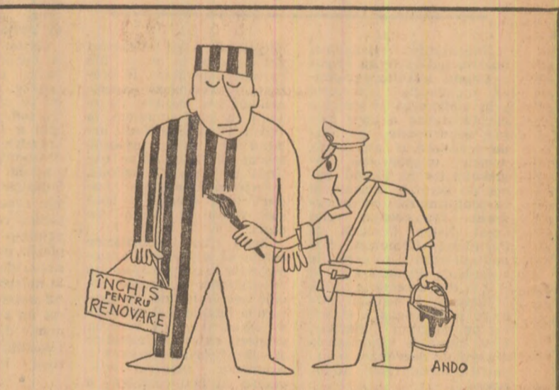
Desen de Octavian ANDRONIC