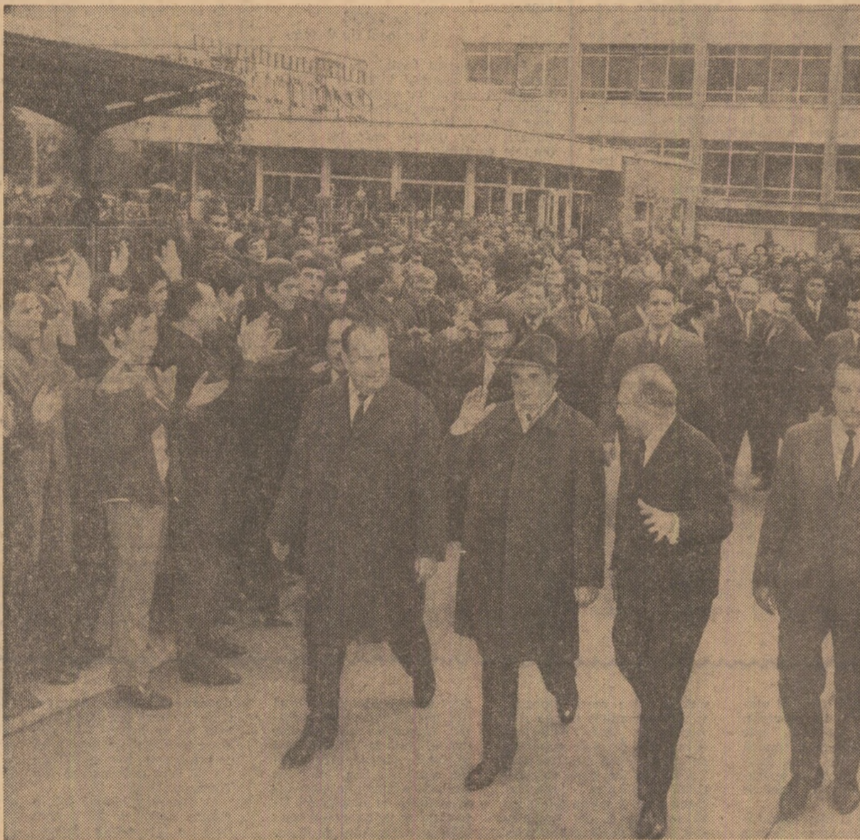
Prețutindeni, în unitățile economice vizitate, secretarul general al P.C.R. a fost salutat cu bucurie și entuziasm

Alături de Fabrica de elemente pentru automatizare, ale cărei realizări sînt bine cunoscute, Uzina de cinescoape — întreprindere dotată cu instalații de mare tehnicitate, la nivelul celor mai recente cuceriri pe plan mondial —