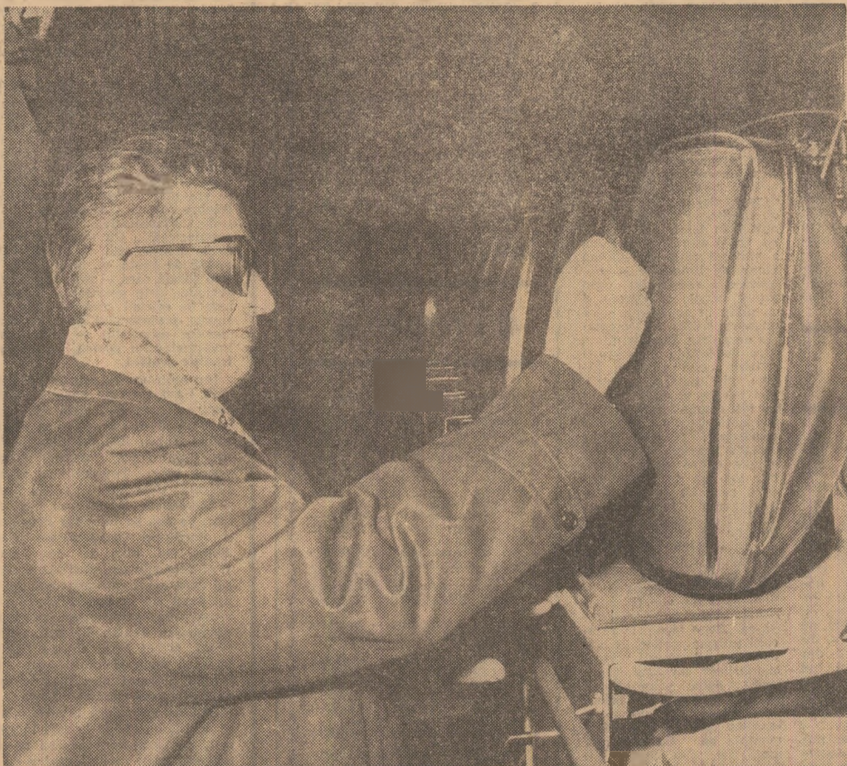
Tovarășul Nicolae Ceaușescu — purtînd ochelari de protecție necesari în condițiile funcționării aparatului electronic — în fața primului cinescop în funcțiune

Pe întregul traseu, pînă la următorul obiectiv al vizitei — Întreprinderea Optică Română — șoseaua Colentina cu noile și modernele ansambluri arhitectonice, șoseaua Mihail Bravu, Bulevardul Muncii, cetățenii Capitalei — tineri și vîrstnici — salută cu căldură pe conducătorul partidului și statului, mărturie vibrată a dragostei pe care întregul nostru popor o nutrește față de tovarășul Nicolae Ceaușescu, față de Partidul Comunist Român.