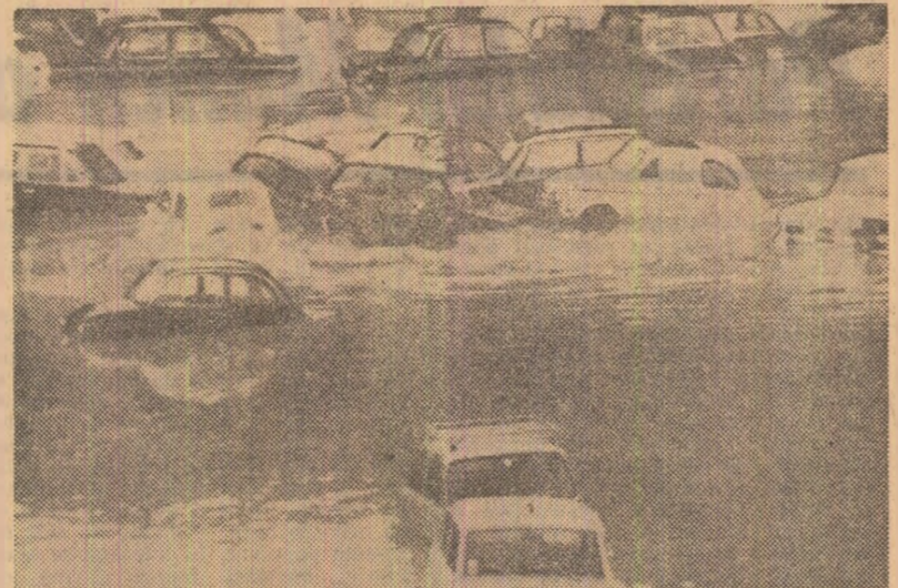
Ploile torențiale care s-au abătut miercuri și joi asupra Genevei și a localităților din împrejurimi au provocat inundații catastrofale. Bilanțul provizoriu publicat vineri este de 36 de morți în regiunea Alexandria, autoritățile intenționează să evacueze două sute amenințate de apele dezlănțuite ale riurilor Isola și Guazzola. În urma alunecărilor de teren, localitățile situate în valea Piemontului sînt izolate de Genova. În fotografie: O piață inundată din Genova

Potrivit observatorilor politici, noua situație creată în rândurile Partidului Liber-Democrat ar fi de natură să creeze unele dificultăți coaliției guvernamentale de la Bonn, care își vede redusă astfel majoritatea în Bundestag cu trei locuri.