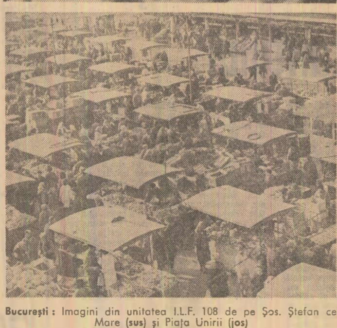
Bucureștii: Imagini din unitatea I.L.F. 108 de pe Șos. Ștefan cel Mare (sus) și Piața Unirii (jos)