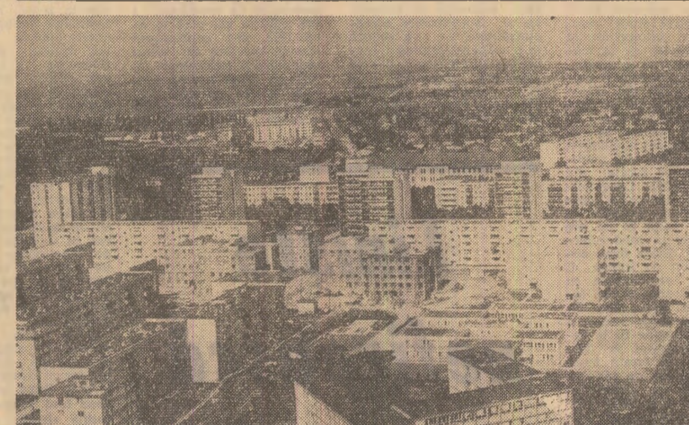
Noi construcții de locuințe la Buzău