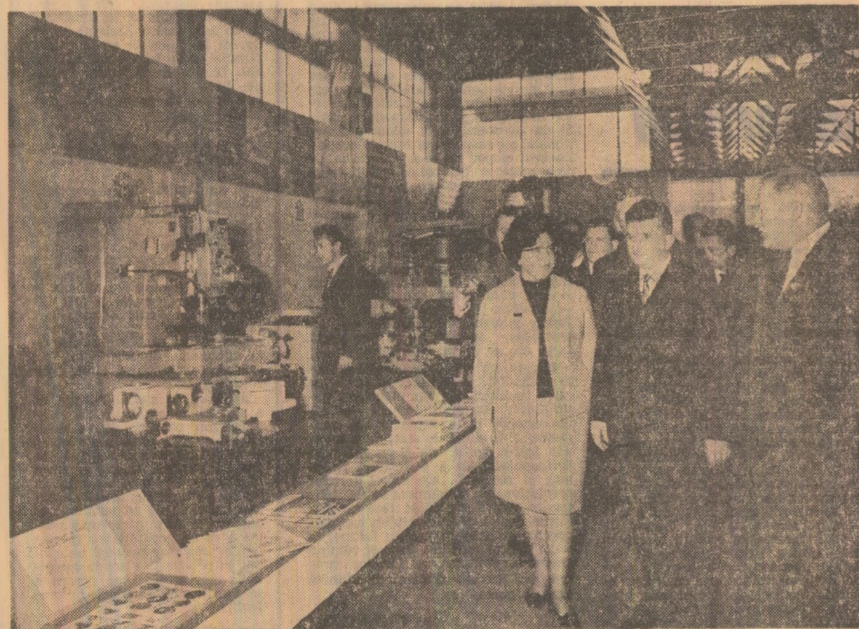
În timpul vizitei la pavilionul Uniunii Sovietice.

Tîrgul internațional București își va deschide porțile pentru specialiștii și public cu începere din ziua de 13 octombrie.