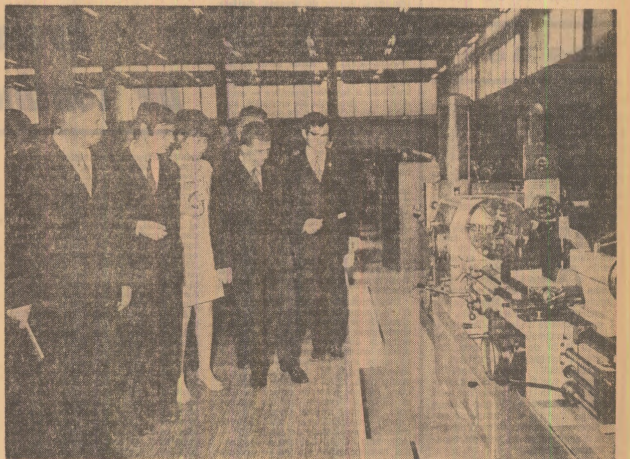
Se vizitează pavilionul Italiei.