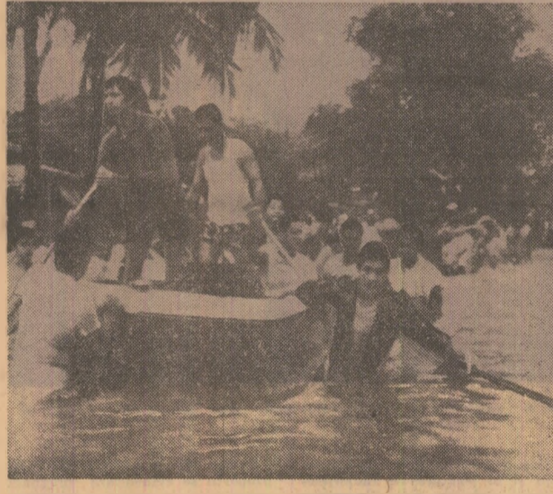
Inundațiile catastrofale care au avut loc recent în Porto Rico au provocat moartea a 153 de persoane și mari pagube materiale. În fotografie: echipe de salvare a sinistraților în acțiune.

După ce a afirmat premierul Iugoslav, actuala vizită a lui Iosip Broz Tito în unele țări europene, precum și vizita pe care președintele H.S.F. Iugoslavia urmează să o facă în decembrie a. c. în Italia sînt de mare importanță. Iugoslavia, a spus el în încheiere, ca țară europeană, trebuie să folosească intensiv climatul de încredere care se creează cu prilejul pregătirii conferinței privind securitatea europeană.