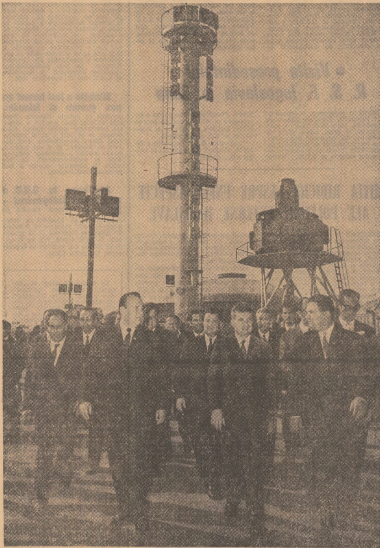
Printre impunătoarele instalații chimice și petrochimice, mărturie elocventă ale progresului economiei românești

„Produsele prezentate, standurile întreprinderilor românești alcătuiesc, în ansamblul lor, o bogată vitrină a economiei naționale. Nemijlocit legat de nivelul nașterii economiei noastre socialiste, de înaltul său ritm de dezvoltare — rod al politicii consecvente a partidului și statului de industrializare socialistă a țării, de modernizare continuă a industriei în pas cu tehnica mondială — Tîrgul internațional București vine să confirme, încă de la prima sa ediție, progresul impetuos al industriei românești, aportul inteligenței tehnice al cadrelor de specialitate, al clasei muncitoare. Cele 128 de firme românești care participă la tîrg își aduc contribuția la lărgirea participării României la diviziunea internațională a muncii, la circuitul mondial de valori materiale, la intensificarea cooperării în domeniul industrial, tehnic și științific.