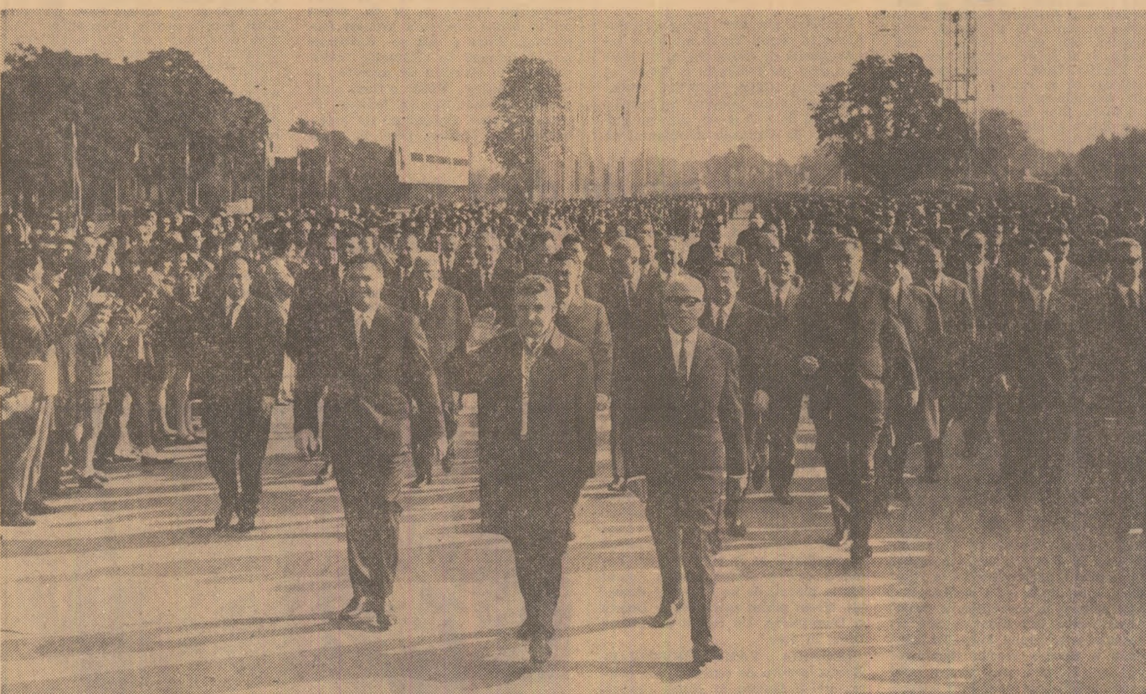
Mii de locuitori ai Capitalei aclamă cu căldură sosirea tovarășului Nicolae Ceaușescu, a celorlalți conducători de partid și de stat, la inaugurarea Tîrgului Internațional din București.

Sînt de față delegații guvernamentale, reprezentanții statelor și firmelor participante la această amplă manifestare economică industrială, specialiști din numeroase țări ale lumii.