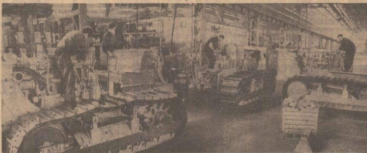
În hala de montaj a noului tip de tractor greu pe șenile S 1500