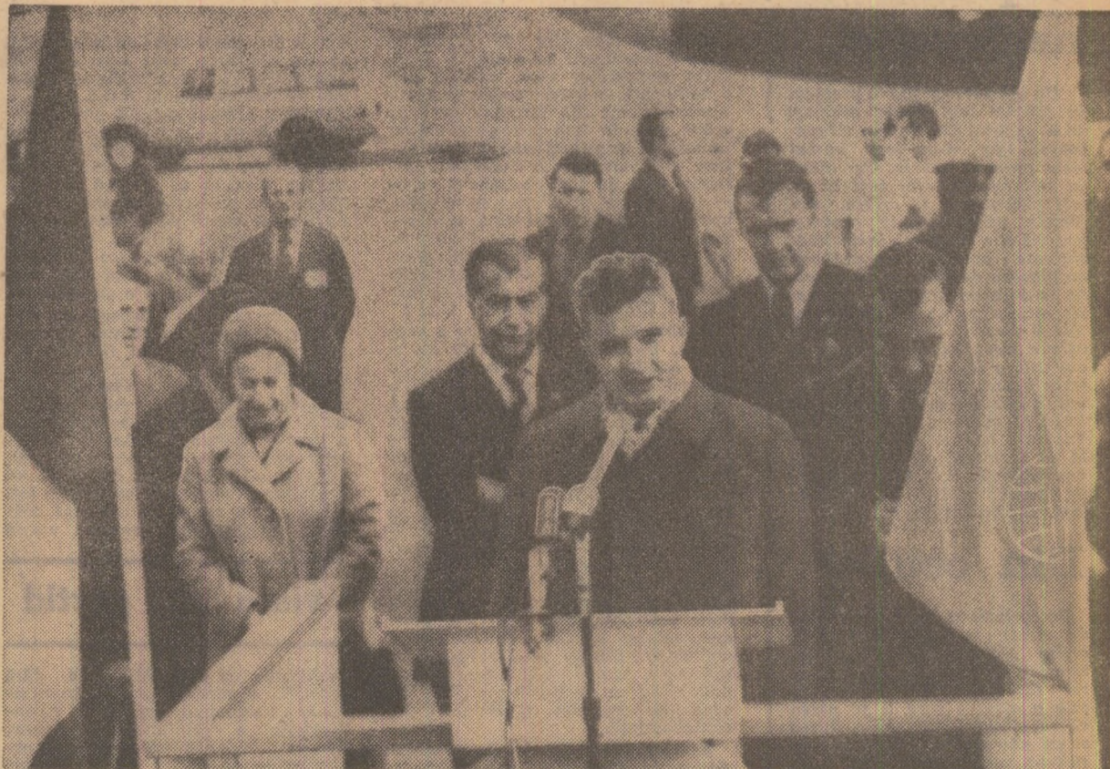
La sosire, pe aeroportul internațional J. F. Kennedy