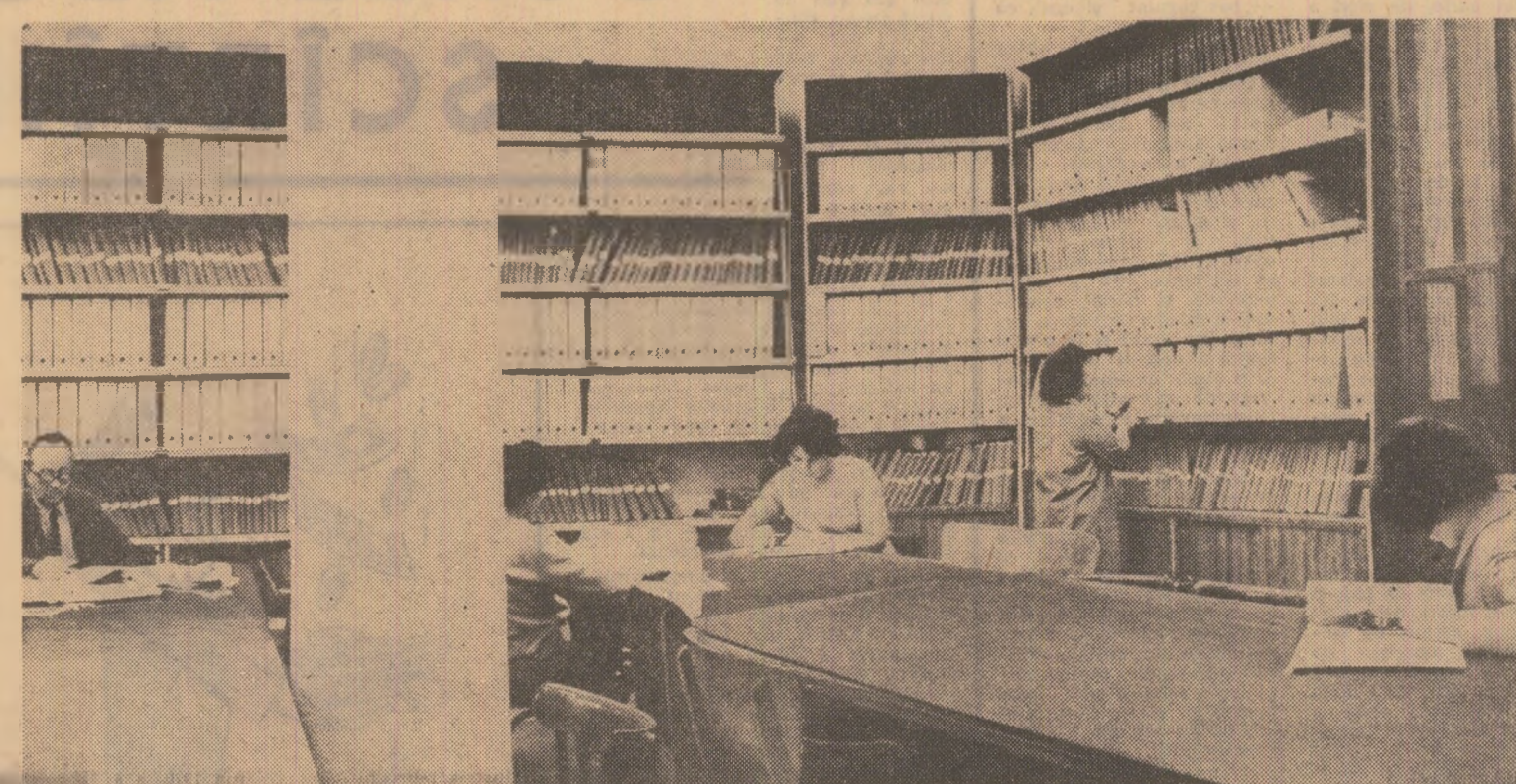
Biblioteca de standarde a I.R.S. În fiecare dosar, „nivelul mondial” al unui produs