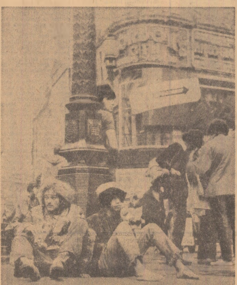
Sumbrelor cohorțe de hippies duc cu ei o boală contagioasă: narcotomania...

...Cea de-a 39-a sesiune a „Interpolului”, desfășurată în octombrie curent la Bruxelles, a pus în fața delegaților veniți din 107 țări membre ale organizației poliției internaționale o problemă cu aspecte care nu puteau fi considerate decît dramatice: În ultimii trei ani, traficul ilicit de stupefiante a crescut în lume de trei ori! Pe lângă celelalte probleme ale sesiunii — delinquența juvenilă, pirateria aeriană și falsificarea bancnotelor — necesitatea desfășurării unei campanii internaționale anti-drog căpăta o acuitate deosebită. Dar măsura propusă nu a apărut decît ca niște paliative: crearea unor centre de instruire a poliției vamale pentru depistarea traficului ilicit; construirea unor clinici de dezințoxicare în țările în care stupefiantele fac ravagii îndobăzite; crearea unor servicii procuratoare de opium și hașiș pentru înlocuirea culturilor condamnate. Dosarul rămîne deschis.