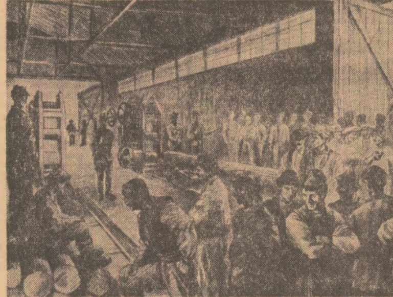
In industria lemnului de pe valea Mureșului, în timpul grevei generale. Desen de Rusu CIOBANU

În seara zilei de 20 octombrie, la apelul pentru încetarea luptei, proletariatul clujean a răspuns ca un singur om. În 21 octombrie, toate fabricile și uzinele din Cluj și-au încetat activitatea.