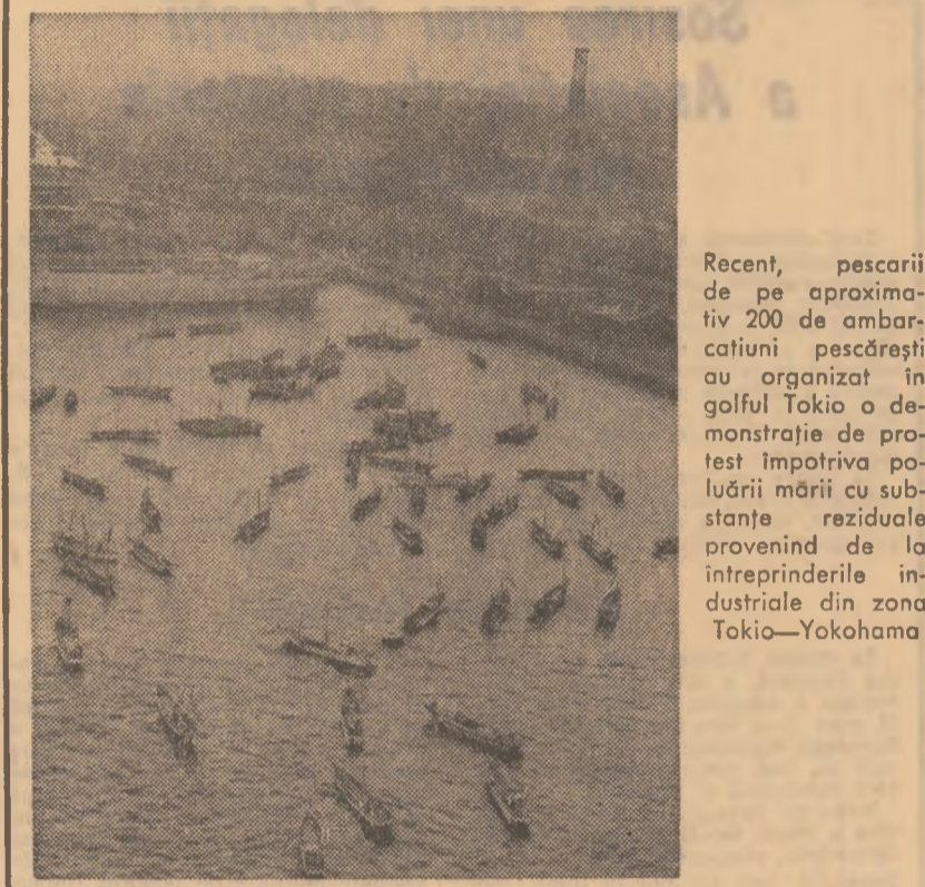
Recent, pescarii de pe aproximativ 200 de embarcațiuni pescărești au organizat în golful Tokio o demonstrație de protest împotriva poluării mării cu substanțe reziduale provenind de la întreprinderile industriale din zona Tokio-Yokohama

SANTIAGO DE CHILE 2 (Agerpres). — Sub președinția lui Salvador Allende, la Santiago de Chile a avut loc prima ședință a noului guvern chilian. Reuniunea a fost consacrată unui schimb de vederi asupra obiectivelor considerate de către cabinet ca primordiale în etapa actuală. O parte dintre miniștrii au răspuns apoi întrebărilor ziariștilor. Ministrul industriei miniere, Orlando Cantuarias, a declarat că țelul principal al departamentului său îl constituie naționalizarea minelor de cupru și fier ale țării. La rîndul său, ministrul agriculturii, Jacques Chonchol, și-a exprimat hotărîrea de a traduce în fapt programul reformei agrare, conform dorințelor și intereselor poporului.