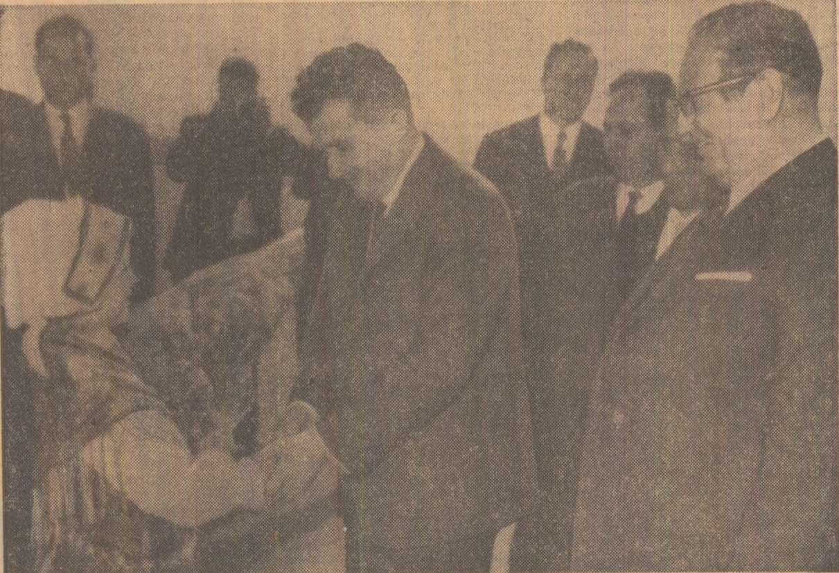
Tovarășul Nicolae Ceaușescu este întâmpinat cu căldură și dragoste pe pământul Iugoslaviei prietene

Președintele Iosip Broz Tito și președintele Nicolae Ceaușescu au rostit toasturi.