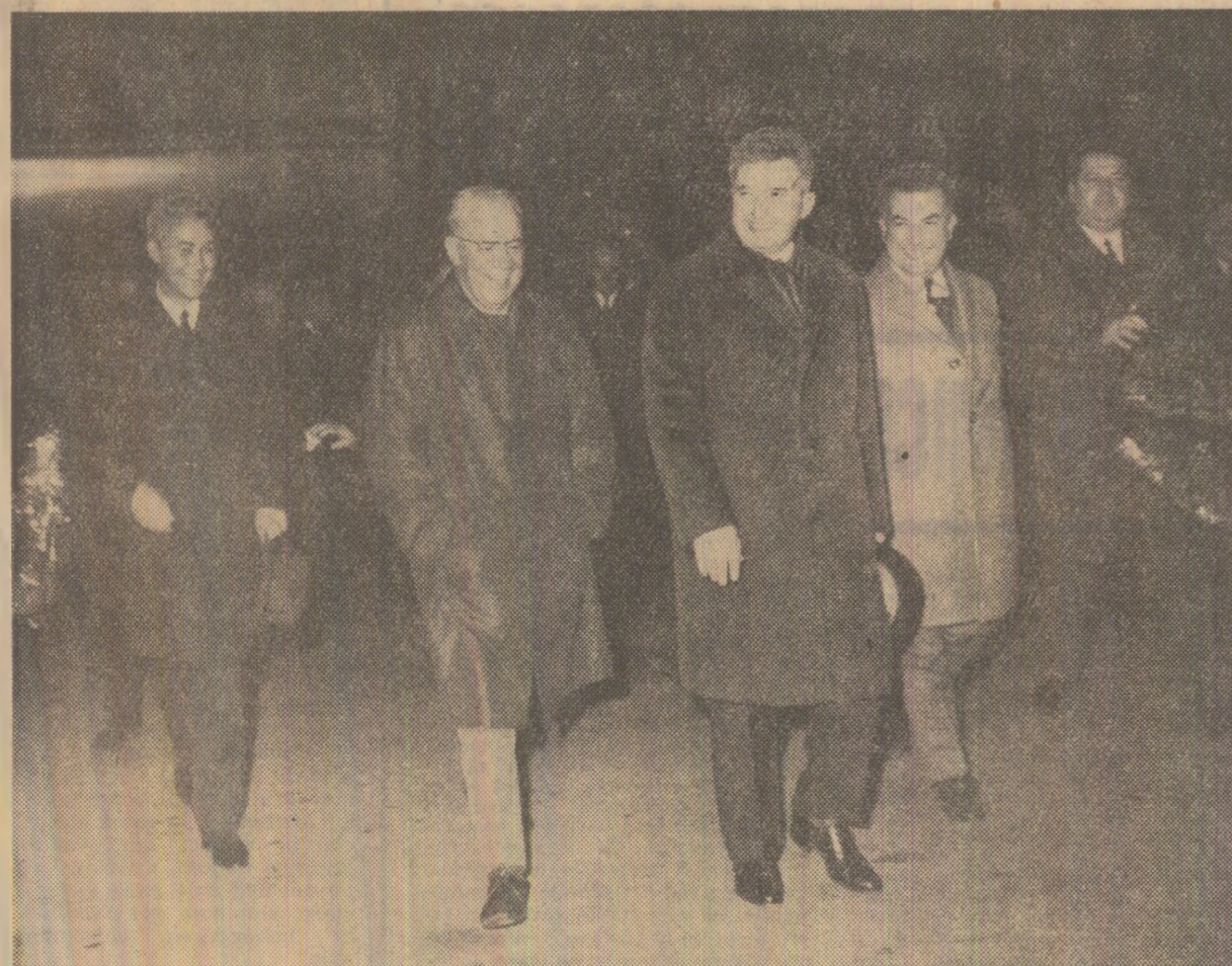
La sosire, pe aeroportul Băneasa