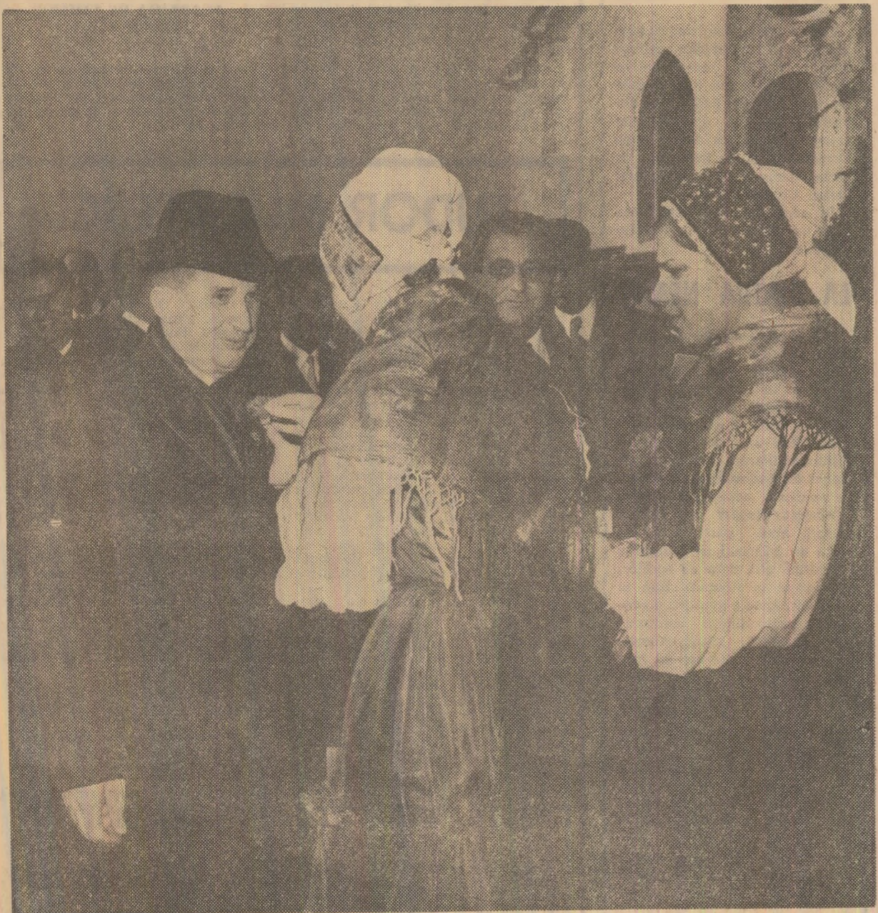
Locuitorii orașului Bled întîmpină cu căldură și simpatie pe înalții oaspeți