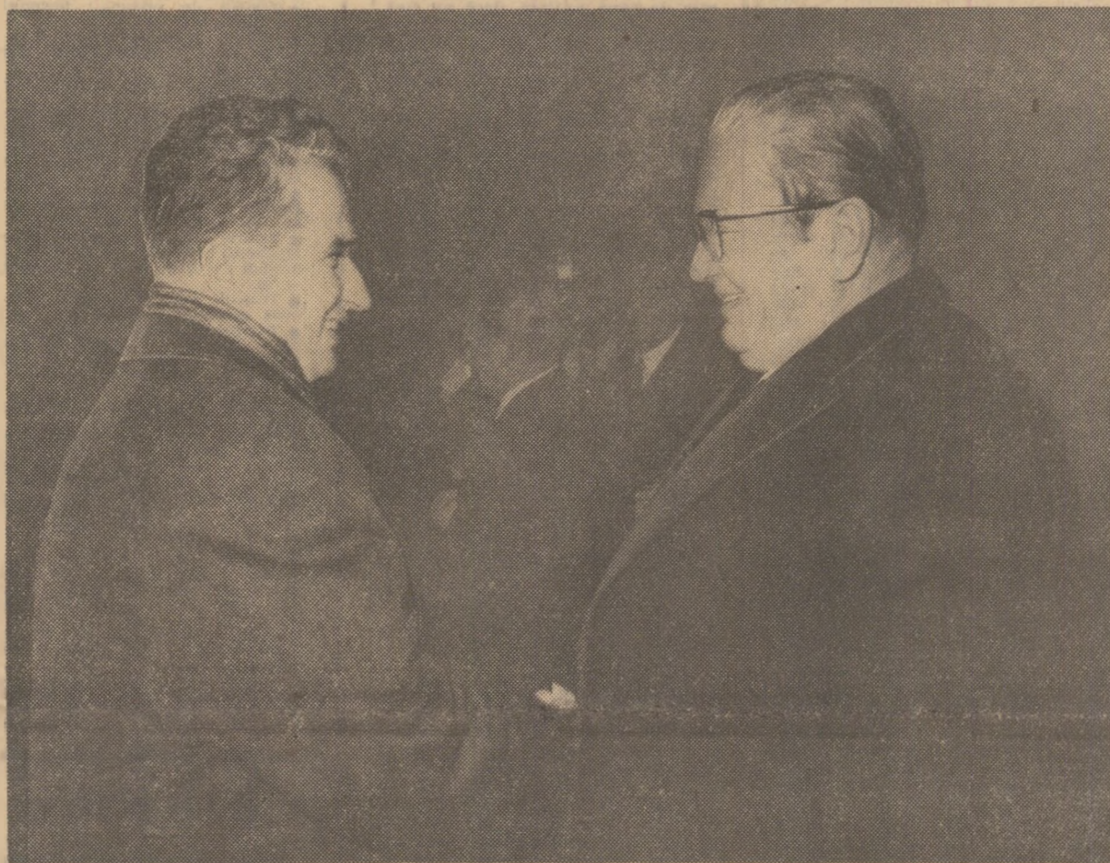
La plecare, pe aeroportul Brniki