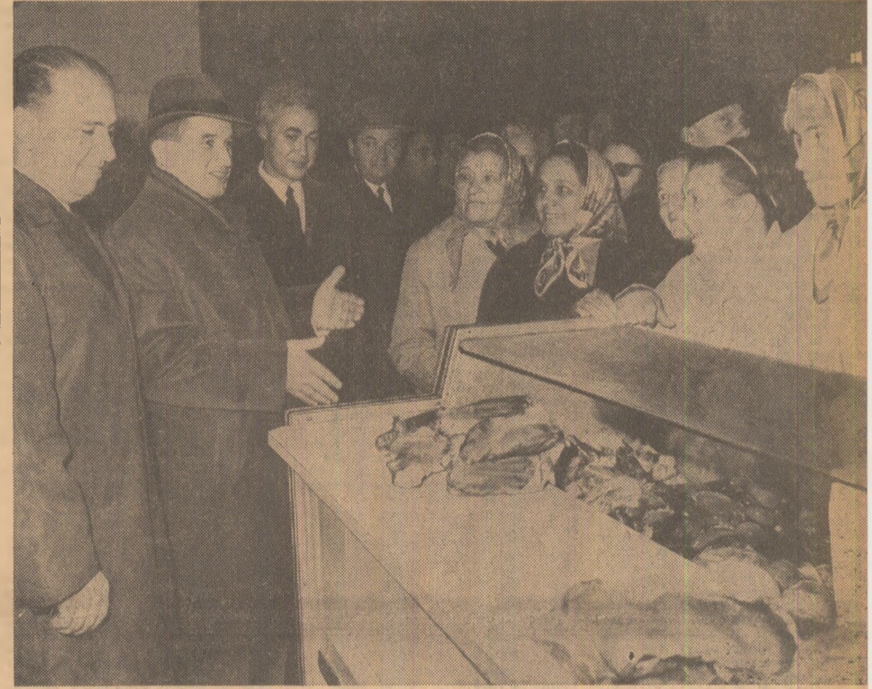
Piața „7 Noiembrie”. Tovarășul Nicolae Ceaușescu stă de vorbă cu cumpărătorii, care relevă cu deplîndă satisfacție îmbunătățirea aprovizionării în urma năsurilor stabilite joi de secretarul general al partidului.

Pe tot parcursul vizitei, în piețele „Dorobanți”, „7 Noiembrie”, „Obor”, „Gheorghe Cosbuc”, Rahova și „13 Septembrie”, secretarul general al partidului este înțîmpinat cu caldă simpatie și dragoste de către cetățeni. Răsună aplauze. „Să trăiești, tovarășe Ceaușescu, vă mulțumim pentru că veniți aici de des în mijlocul nostru”, sînt cuvînte izvorite din inimă, prin care oamenii își exprî-