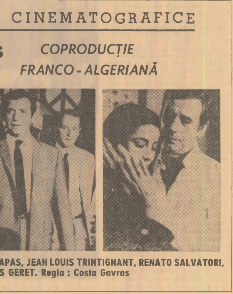
Cu: YVES MONTAND, IRENE PAPAS, JEAN LOUIS TRINTIGNANT, RENATO SALVATORI, GEORGES GERET. Regia: Costa Gavras