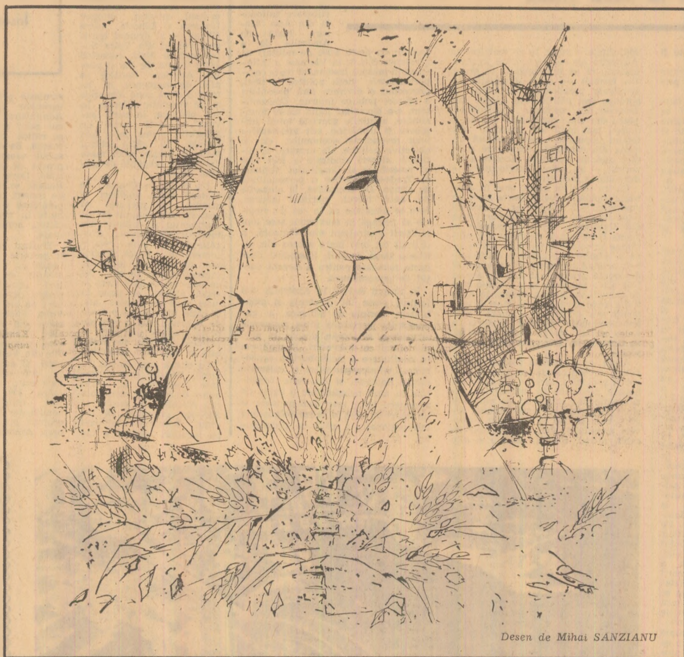
Desen de Mihai SANZIANU

artistică. Sînt incredinciat că prielul sărbătorilor din armin-denii va adăuga noi nestemate în diadema pretioasă a poeziei românești. Mihai BENIUC