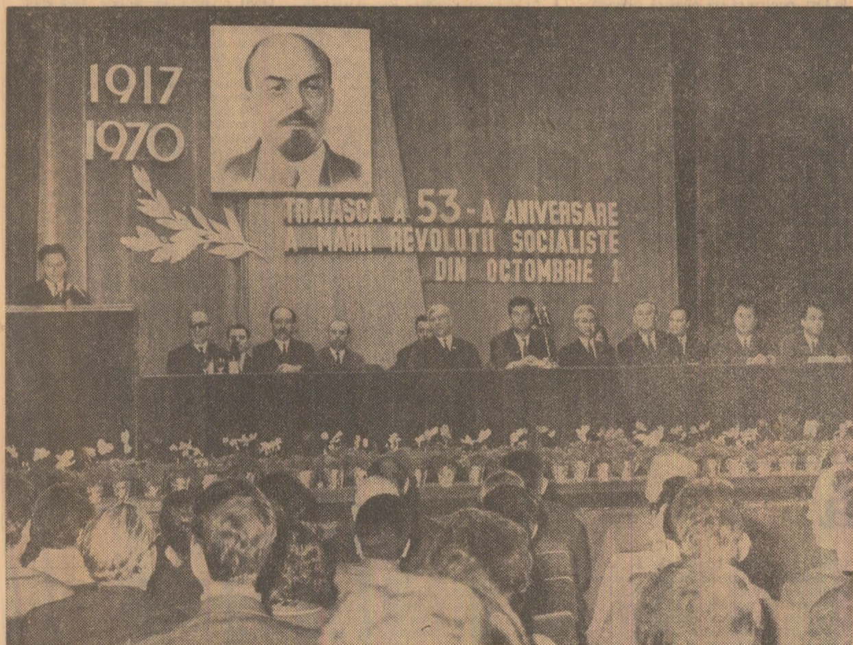
In timpul adunării festive din Capitală