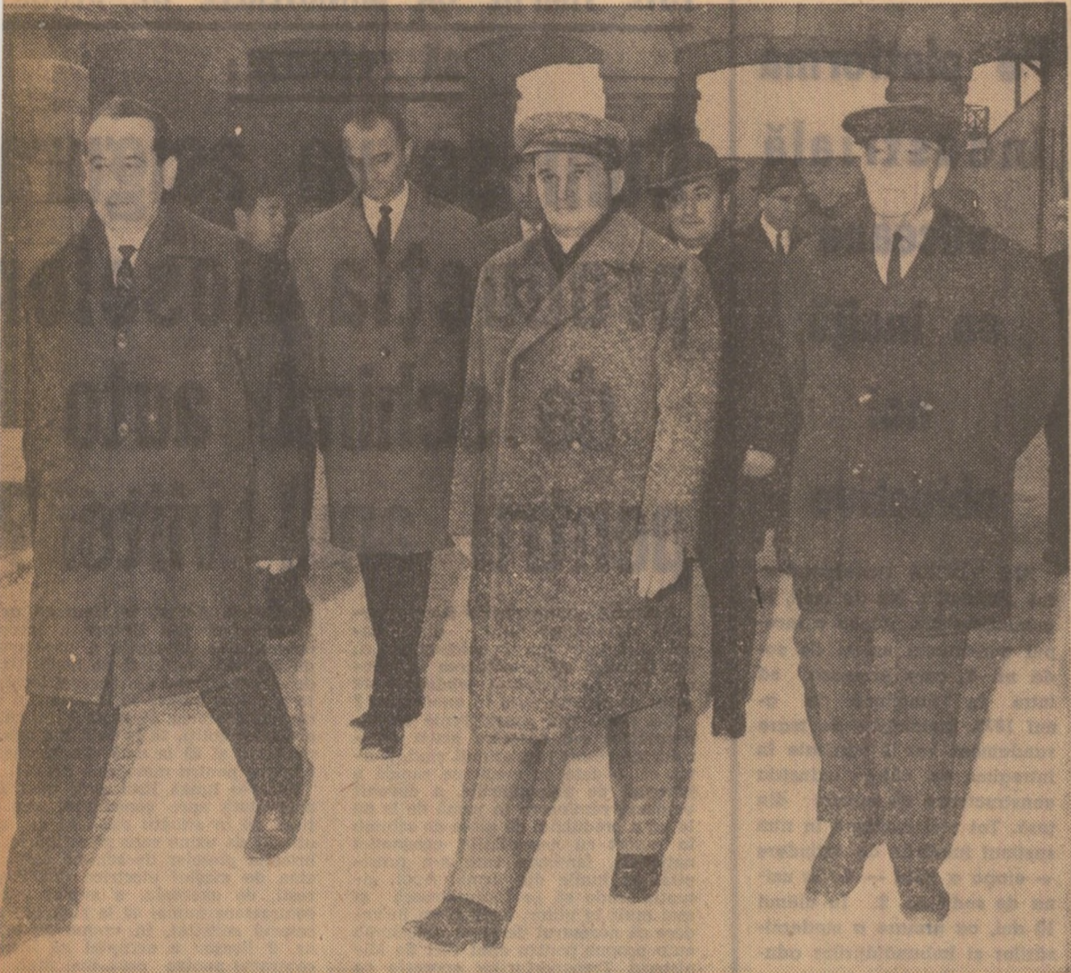
Imagine din timpul vizitării de către tovarășul Nicolae Ceaușescu și ceilalți conducători de partid și de stat a muzeului Doftana