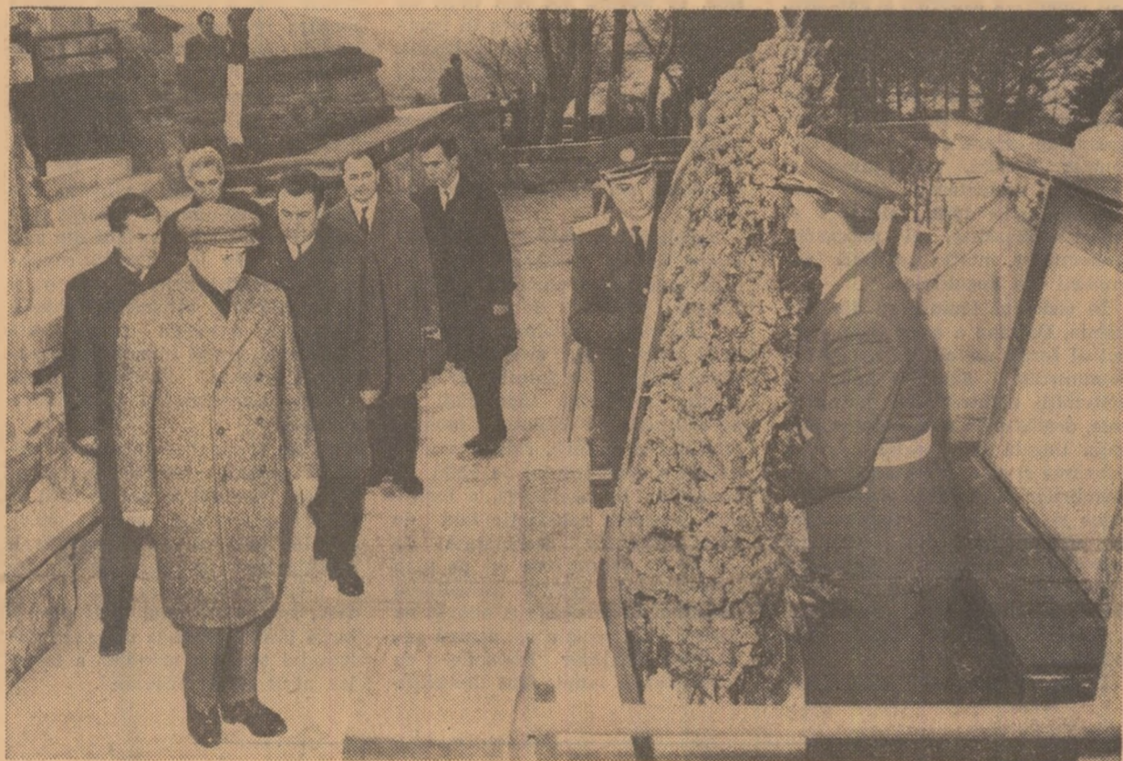
Moment solemn. Se depune o coroană de flori în memoria celor căzuți în lupta pentru libertate și dreptate, pentru victoria ideilor socialismului

Conducătorii partidului și statului pășesc apoi pe aleea ce coboară în „Mîntulur”, „Trei pruni”, unde se află mormintele