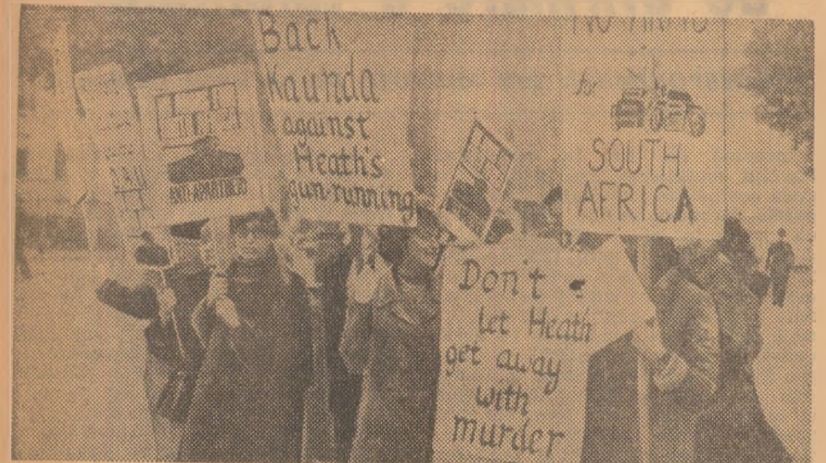
Priviți un raport al Organizației Unității Africane, dat publicității la Addis Abeba, Marea Britanie nu a făcut nici o declarație că va renunța la intenția sa de a reînvia vânzările de arme către regimul rasist de la Pretoria. Dimpstrivă, prezintă un raport, în timpul convorbirilor cu reprezentanții O.U.A., guvernul englez a lăsat să se înțeleagă că va începe să realizeze intențiile sale. Mai mult, el preconizează semnarea cu guvernul R.S.A. a unui acord militar. În fotografie: Demonstrație la Londra împotriva intenției guvernului conservator de a livra arme rasiștilor din Republica Sud-Africană.