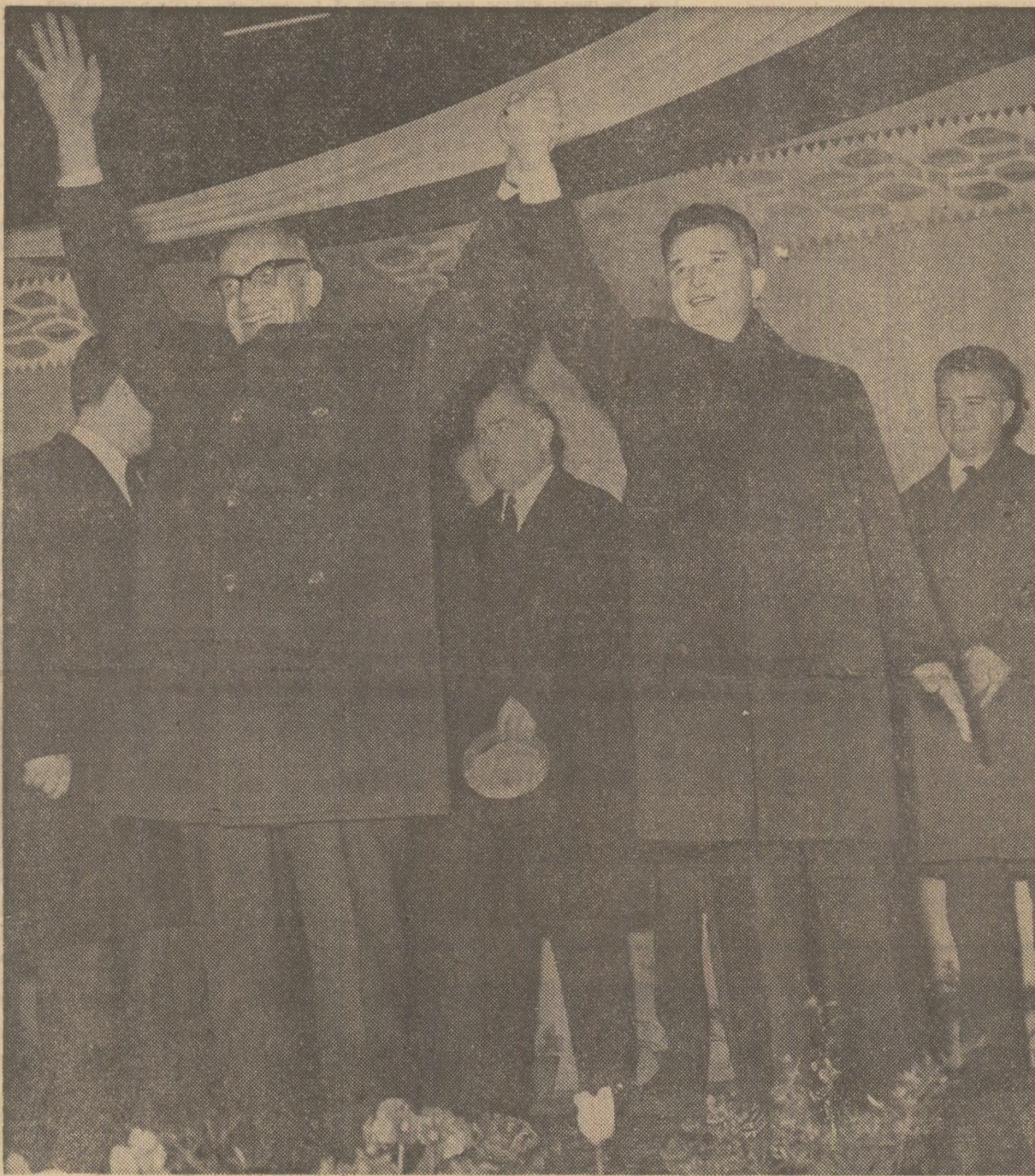
Să trăiască și să înflorească prietenia dintre poporul român și poporul polonez!

În uralele și aplauzele multimit, oaspeții se îndreaptă spre primul obiectiv al vizitei, uzinele „Electroputere”.