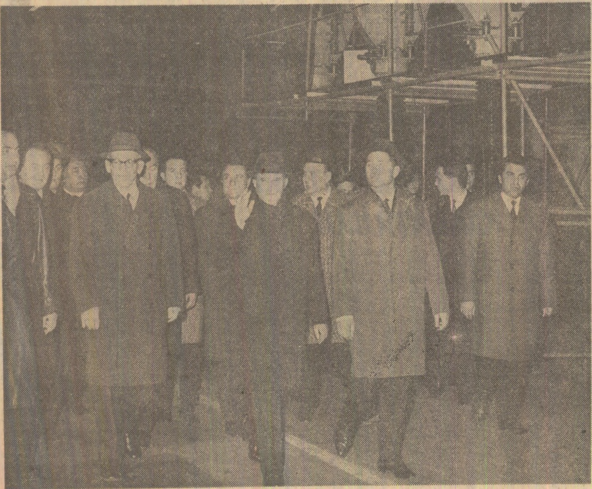
La uzina „Electroputere”

Președintele Consiliului de Miniștri al Republicii Socialiste România