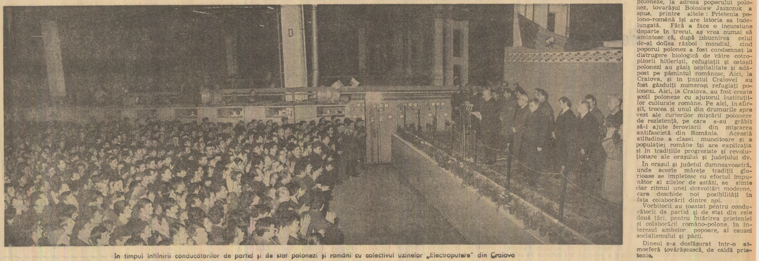
În timpul întîlnirii conducătorilor de partid și de stat polonezi și români cu colectivul uzinelor „Electroputere” din Craiova

Cele două țări ale noastre au trebuit să învingă în perioada trecută greutăți asemănătoare pe calea dezvoltării lor. Din momentul în care popoarele noastre au pășit, sub conducerea partidelor lor muncitorești, pe calea construcției socialismului, energia clasei muncitoare și a maselor populare eliberată de către noi, orînduire, a permis atât Poloniei, cit și României, ca și altor țări socialiste frățești, să obțină un ritm înalt de creștere, necunoscut în istoria popoarelor noastre, măsurat în primul rînd prin progresele în domeniul industrializării. Ac-