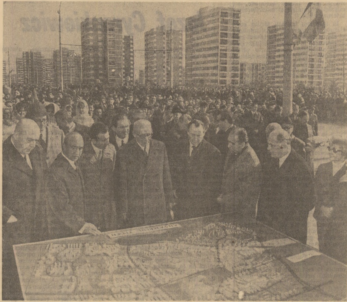
În fața machetei înfățișând noul cartier Titan din Capitală