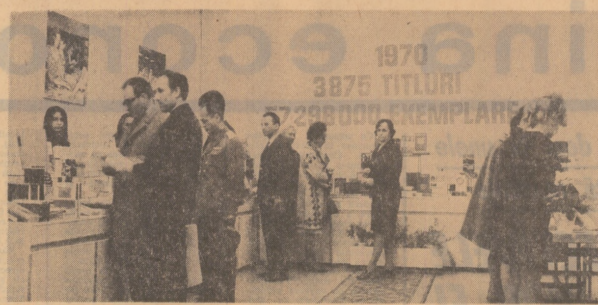
Aspect din expoziție

Ceea ce s-ar conveni reluat în încheierea acestei anchete ar fi, în primul rând, necesitatea de a se clarifica acea concepție universitară care să concorde pe deplin cu cerințele simultane ale pregătirii teoretice temeinice și specifice subinginerilor, dar și accentuarea și pregătirea pentru munca în producție. Ațingerea acestui țel obligă Ministerul Învățământului și toate celelalte ministere interesate să se pronunțe mai operativ asupra problemelor complexe pe care le ridică imperativul perfecționării învățământului de subingineri.