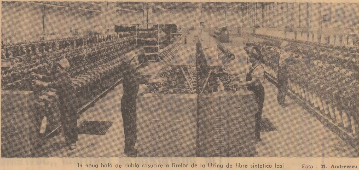
În noua hală de dublă rîscuire a firelor de la Uzina de fibre sintetice Iasi

Florea CEAUSESCU Manole CORCACI corespondenții „Științei”